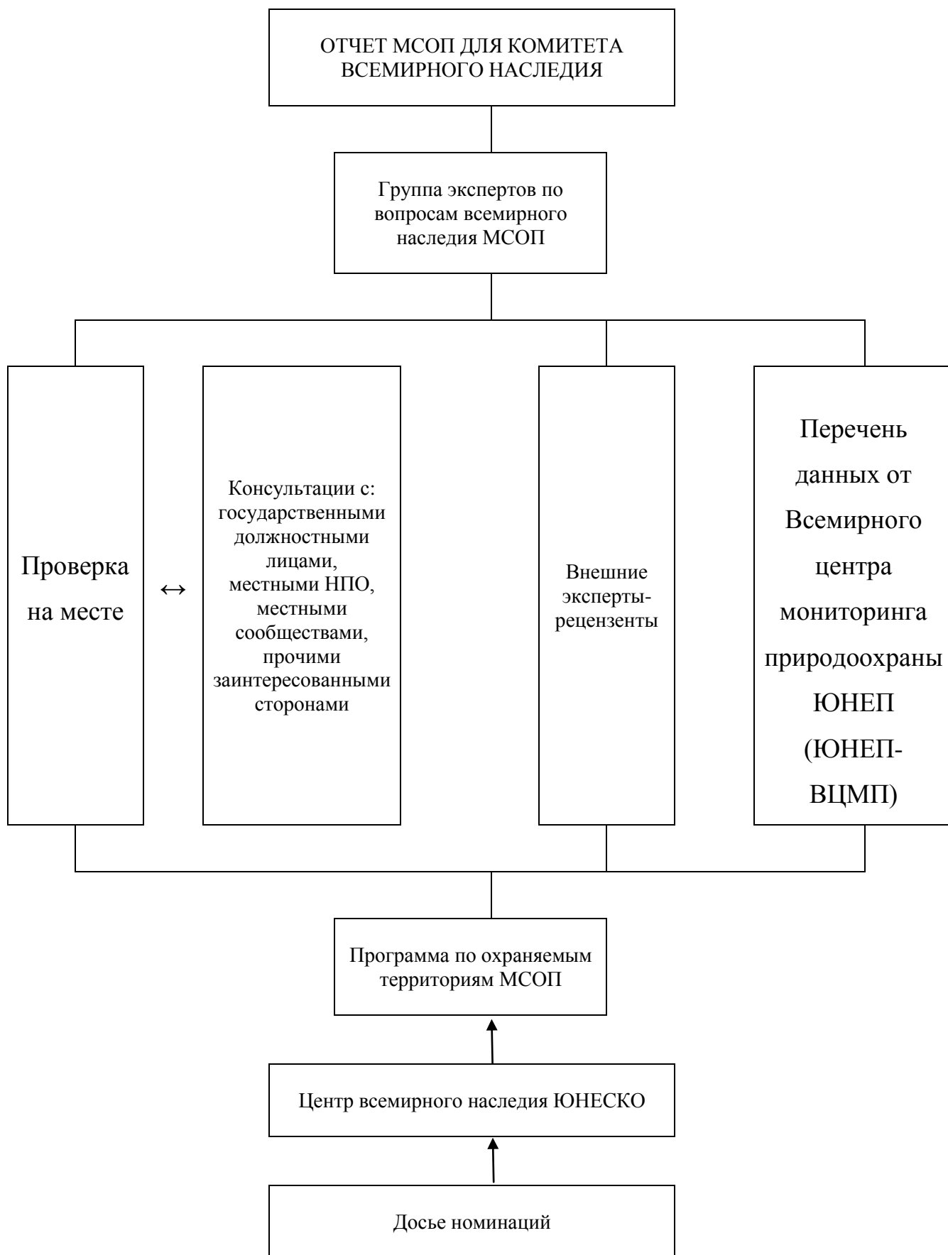
РИСУНОК 2: ПРОЦЕДУРА ОЦЕНКИ МСОП