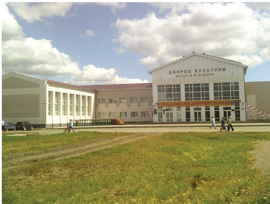
Илл. 10. Исилькуль. Дворец культуры им. В.В. Радула, 2018 г.

В период уборки урожая начиналась особая активизация деятельности культурпросветучреждений: так в 1967 году, по данным газеты «Знамя», было проведено 320 лекций, 32 тематических вечера, действовало 114 кружков художественной самодеятельности, было поставлено 33 концерта, 70 спектаклей и 90 концертов народного театра, была организована выставка самодеятельных художников.