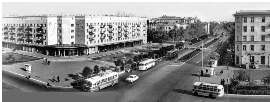
Илл. 11. Ленинградская площадь, 1964 г.