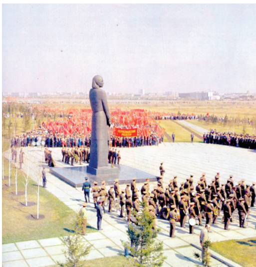
Илл. 2. Празднование Дня Победы в Омске, Парк Победы (середина 1970-х гг.).

омичей и новосибирцев приковывал военный парад на Красной площади в столице нашей Родины – городе-герое Москве. По телевидению демонстрировались художественные фильмы о войне – «Щит и меч», «Брестская крепость», «17 мгновений весны», «Они сражались за Родину», «Молодая гвардия», «Два бойца», «Летят журавли», «Освобождение» и другие. Самыми любимыми фильмами о войне среди всех возрастов являлись фильмы «А зори здесь тихие» и «В бой идут одни старики». Популярность этих кинолент объясняется простотой и трогательностью героев фильмов, которые стали символами верности долгу, нестигаемости и настоящего патриотизма. Песнями о войне, которые омичи и новосибирцы любили слушать на концертах и исполняли сами во время застолий и празднований, стали песни «Вставай, страна огромная», «Хотят ли русские войны», «Темная ночь», «Враги сожгли родную хату», «Журавли», «Катюша», «Землянка», «На безымянной высоте», «Песенка фронтового шофера», «Синий платочек», «Смуглянка», «Десятый наш десантный батальон» и другие. Самой популярной являлась песня Давида Тухманова и Владимира Харитонova «День Победы», написанная в 1975 г. к 30-летию Победы.