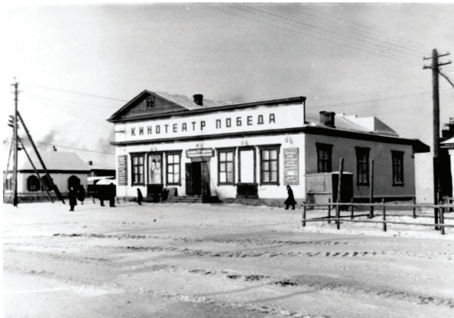
Илл. 11. Исилькуль. Кинотеатр «Победа», 1956 г.

монстрировалось в кинотеатре «Победа», в клубе железнодорожников и в клубе им. В.И. Ленина. В 50-е годы XX в. в Исилькуле, как и в других райцентрах по распоряжению Омского облисполкома, появился летний кинотеатр с количеством мест в 320 человек 63 . В 1961 году в Исилькуле открылся детский кинотеатр.