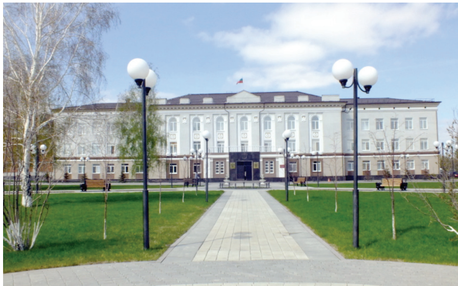
Илл. 3. Ишим. Административное здание, ул. Гагарина, 67, 2012 г. Источник: Живой Журнал. – URL: https://klyaksina.livejournal.com/605053.html (дата обращения: 22.02.2019)

Ранний и поздний периоды советской эпохи отражены в ряде административных и функциональных зданий. В стиле модерн было сооружено здание железнодорожного вокзала. Советский стиль, ориентированный на ордерные композиции в традициях исторического зодчества характерен для административного здания на ул. Гагарина, 67 (1955 г.). Три здания Ишима начала XX в. отвечают стилю конструктивизма: «Дом обороны (1931 г.), здание клуба имени Ильича (1926 г.), содержащее парадный вестибюль и зрительный зал; кинотеатр им. В.В. Блюхера (1930 г.)» 5 .