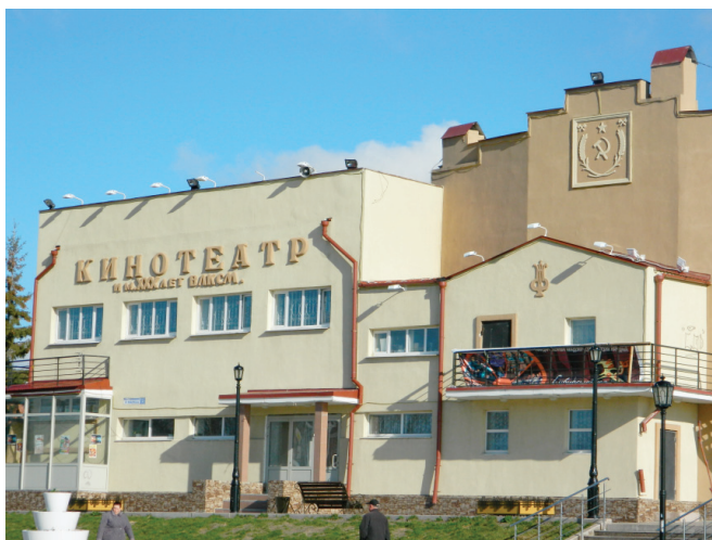
Илл. 1. Ишим. Кинотеатр им. 30 лет ВЛКСМ, 2013 г.