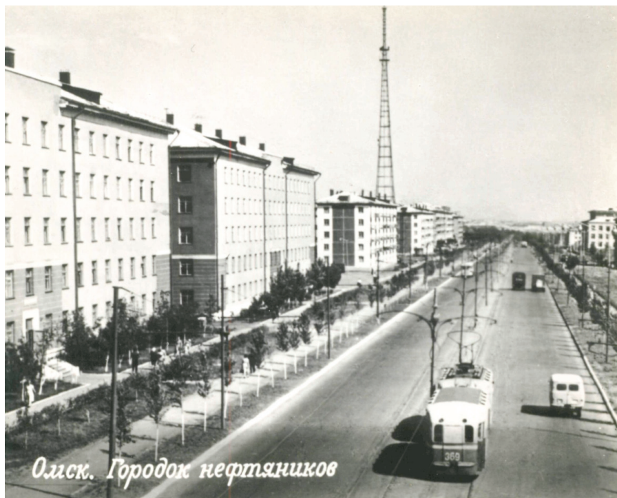
Илл. 8. Городок Нефтяников, 1966 г.

Кордным. Телевизионный – Чередовыми и т. д. Каждый «системообразующий» завод выстраивал свою собственную инфраструктуру: жилищную, образовательную, культурную, спортивную. Так, в Парке культуры и отдыха им. 30-летия ВЛКСМ (Октябрьский район) негласное соревнование вели два наиболее мощных оборонных завода: авиационный завод и моторостроительный завод им. Баранова. Если один из них строил стадион, каток или бассейн, то второй, делал то же самое. В результате парк быстро редел, теряя свое зеленое убранство, хотя и наполнялся важными инфраструктурными сооружениями.