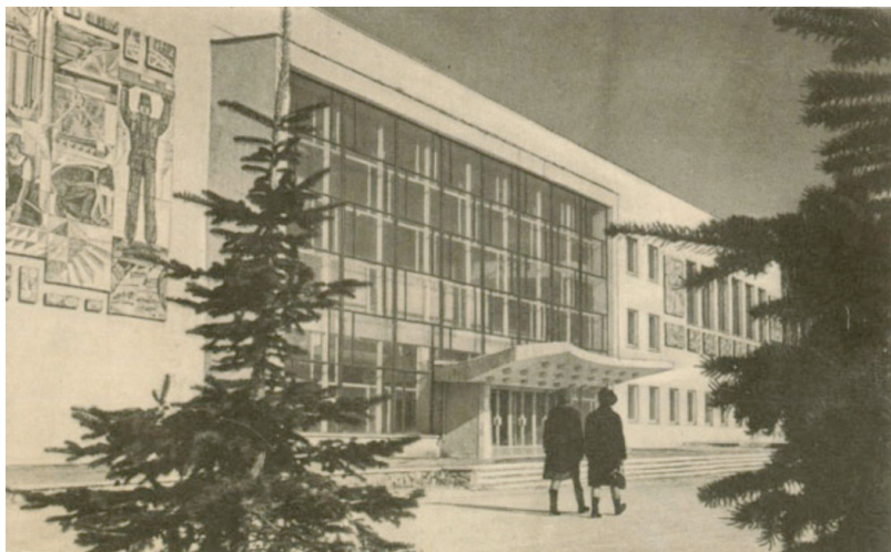
Илл. 6. Дворец культуры «Строитель».

Общественные здания, построенные в 1950–1980-е гг., формировали центры новых планировочных районов. Здания, как правило, строились как полифункциональные. В композиционном решении сооружений подчеркивалась несущая основа, использование простых геометрических объемов, сочетание фактур, включение элементов природного ландшафта. Пространство общественных зданий «сливалось» с пространством города за счет больших остекленных площадей, «выноса» во вне части объема зданий. В данный период было распространено тиражирование типовых проектов, даже при строительстве крупных общественных зданий 8 .