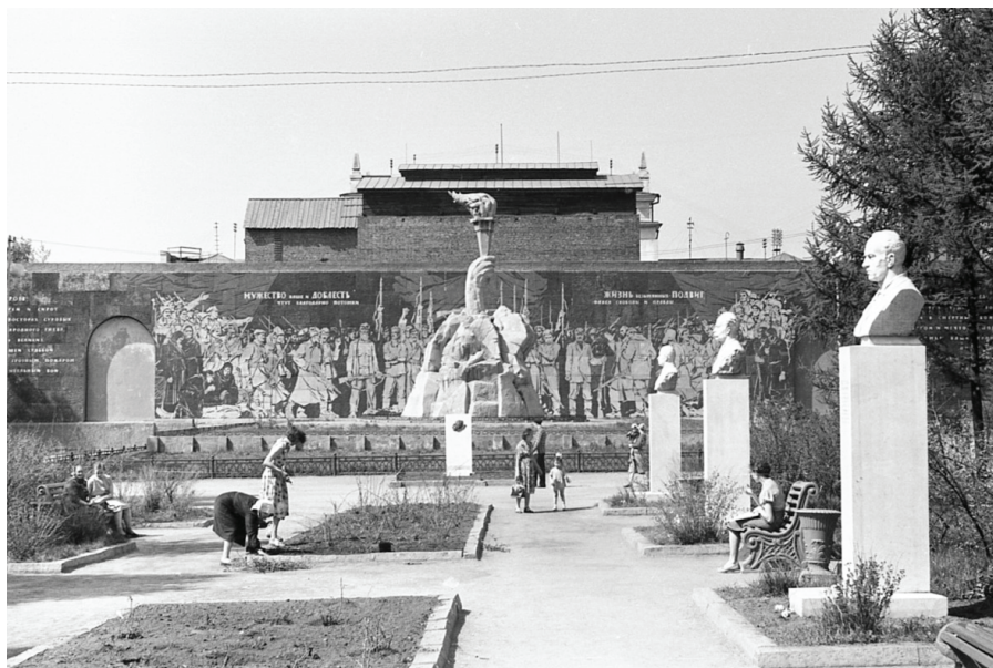
Илл. 7. Сквер Героев революции.

В 1967 г. в Кировском районе был открыт мемориальный ансамбль «Подвигу сибиряков в Великую Отечественную войну 1941–1945 гг.» (Монумент Славы), сооруженный по проекту А.С. Чернобровцева. Мемориал включает себя памятник Скорбящей Матери, Вечный огонь, пять десятиметровых пилонов, на которых изображены сцены, посвященные отдельным этапам войны, и запечатлены имена горожан, погибших на фронтах. Рядом с пилонами на размещены урны с землей с мест боевых сражений.