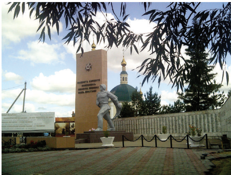
Илл. 8. Исилькуль. Мемориал славы воинам Великой Отечественной войны: памятник воинам-землякам, погибшим в годы Великой Отечественной войны, 2018 г.