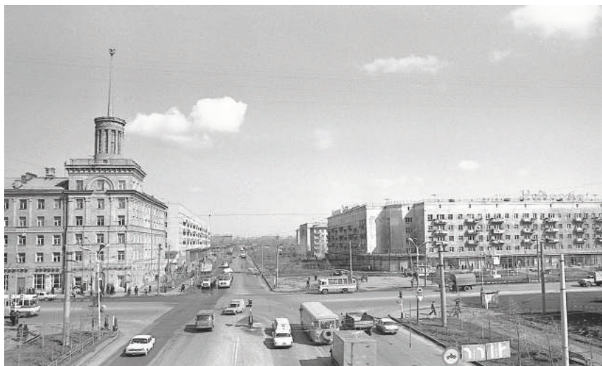
Илл. 9. Перекресток ул. Масленникова и пр. К. Маркса, 1970-е гг.

с вводом жилья сдавались объекты соцкультбыта (школы, детские сады, кинотеатры и пр.). Несмотря на высокие темпы жилищного строительства в городе по-прежнему оставался высоким удельный вес жилого частного сектора, который хотя и был в основном выдавлен на окраины города, но кое-где сохранился и в центральных районах. В 1985 г. удельный вес жилого частного сектора составлял 17,3% от общегородской застройки, или 210 тыс. кв. м 22 . Культурный ландшафт города страдал незавершенностью, серо-бетонной плоскостью и невыразительностью своих форм, хотя несколько и вырос вертикально. Однако появление значительного числа крупных социально значимых объектов и усиление всех видов коммуникационных связей придали городскому ландшафту большую связанность и целостность восприятия.