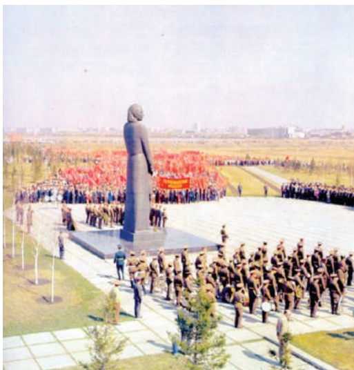
Илл. 2. Празднование Дня Победы в Омске, Парк Победы (середина 1970-х гг.).

омичей и новосибирцев приковывал военный парад на Красной площади в столице нашей Родины – городе-герое Москве. По телевидению демонстрировались художественные фильмы о войне – «Щит и меч», «Брестская крепость», «17 мгновений весны», «Они сражались за Родину», «Молодая гвардия», «Два бойца», «Летят журавли», «Освобождение» и другие. Самыми любимыми фильмами о войне среди всех возрастов являлись фильмы «А зори здесь тихие» и «В бой идут одни старики». Популярность этих кинолент объясняется простотой и трогательностью героев фильмов, которые стали символами верности долгу, нестигаемости и настоящего патриотизма. Песнями о войне, которые омичи и новосибирцы любили слушать на концертах и исполняли сами во время застолий и празднований, стали песни «Вставай, страна огромная», «Хотят ли русские войны», «Темная ночь», «Враги сожгли родную хату», «Журавли», «Катюша», «Землянка», «На безымянной высоте», «Песенка фронтового шофера», «Синий платочек», «Смуглянка», «Десятый наш десантный батальон» и другие. Самой популярной являлась песня Давида Тухманова и Владимира Харитонova «День Победы», написанная в 1975 г. к 30-летию Победы.