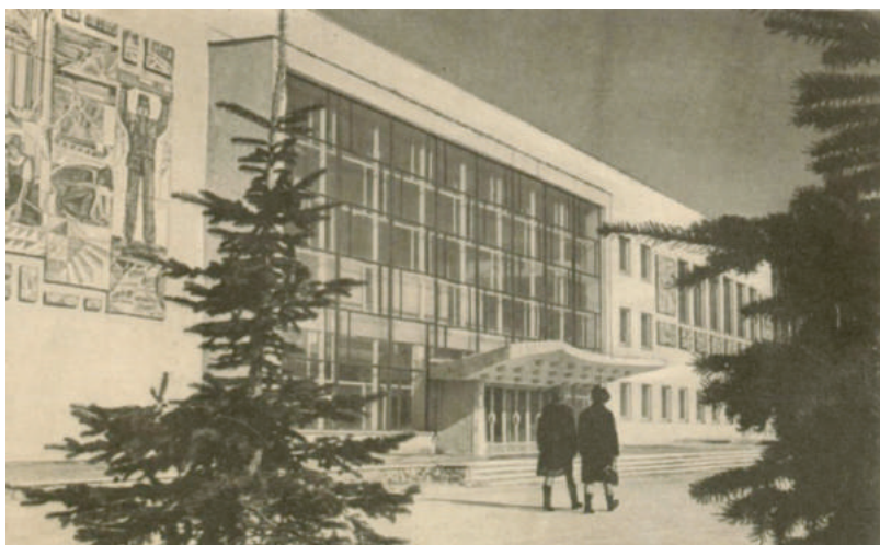
Илл. 6. Дворец культуры «Строитель».

Общественные здания, построенные в 1950–1980-е гг., формировали центры новых планировочных районов. Здания, как правило, строились как полифункциональные. В композиционном решении сооружений подчеркивалась несущая основа, использование простых геометрических объемов, сочетание фактур, включение элементов природного ландшафта. Пространство общественных зданий «сливалось» с пространством города за счет больших остекленных площадей, «выноса» во вне части объема зданий. В данный период было распространено тиражирование типовых проектов, даже при строительстве крупных общественных зданий 8 .