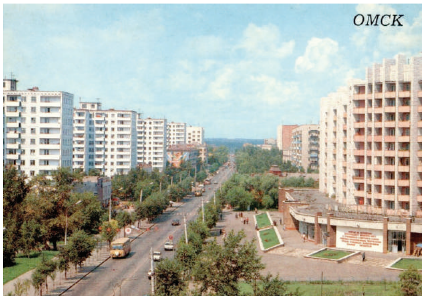
Илл. 10. Ул. Красный путь, 1988 г.

мических маркеров можно развернуто представить на примере советского Омска. Омск, как и многие из российских городов, имел богатое историческое прошлое и вполне устойчивую топонимическую систему на 1917 г. отражающую «культурный ландшафт дореволюционного города». В результате революционных преобразований (1917–1920) эта система подверглась сначала критике, а затем пересмотру.