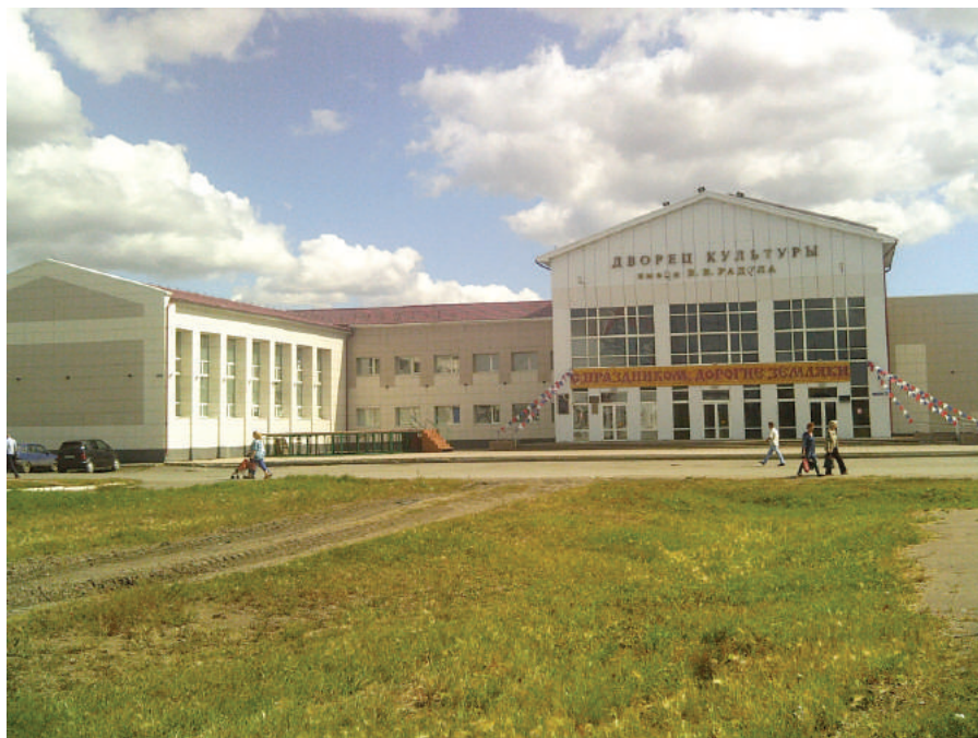
Илл. 10. Искилькуль. Дворец культуры им. В.В. Радула, 2018 г.

В период уборки урожая начиналась особая активизация деятельности культпросветучреждений: так в 1967 году, по данным газеты «Знамя», было проведено 320 лекций, 32 тематических вечера, действовало 114 кружков художественной самодеятельности, было поставлено 33 концерта, 70 спектаклей и 90 концертов народного театра, была организована выставка самодеятельных художников.