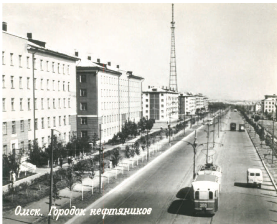
Илл. 8. Городок Нефтяников, 1966 г.

Кордным. Телевизионный – Чередовыми и т. д. Каждый «системообразующий» завод выстраивал свою собственную инфраструктуру: жилищную, образовательную, культурную, спортивную. Так, в Парке культуры и отдыха им. 30-летия ВЛКСМ (Октябрьский район) негласное соревнование вели два наиболее мощных оборонных завода: авиационный завод и моторостроительный завод им. Баранова. Если один из них строил стадион, каток или бассейн, то второй, делал то же самое. В результате парк быстро редел, теряя свое зеленое убранство, хотя и наполнялся важными инфраструктурными сооружениями.