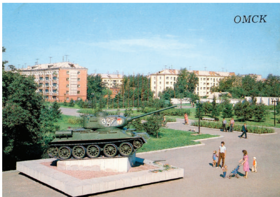
Илл. 12. Бульвар Победы. Мемориал «Слава Героям», танк Т 34-85.

ландшафта – мостов. Все они получили символически и идеологически выверенные наименования. Мост через реку Омь в створе улицы Ленина, законченный строительством к 50-й годовщине Великой Октябрьской социалистической революции получил наименование «Юбилейный», мост через реку Омь в створе ул. Гагарина и проспекта Маркса стал «Комсомольским». Мост через реку Омь в створе ул. Б. Хмельницкого и 2-й Восточной был назван «Октябрьским» (хотя в просторечье именовался «Горбатым»). Мост через реку Иртыш в створе ул. Масленникова – Ленинградской площади получил имя «Ленинградского» 24 .