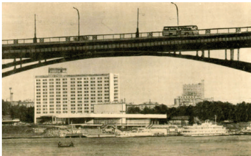
Илл. 1. Речной Вокзал и Октябрьский коммунальный мост.

Но одновременно с этим город рос, шли агломерационные процессы. Появлялись новые поселки вблизи города. Возводились жилые районы вокруг вновь созданных научных центров, промышленных предприятий, аэропортов. Это город Обь – поселок аэропорта Толмачево, поселок ОбьГЭС, наукограды Академгородок, Краснообск, Кольцово.