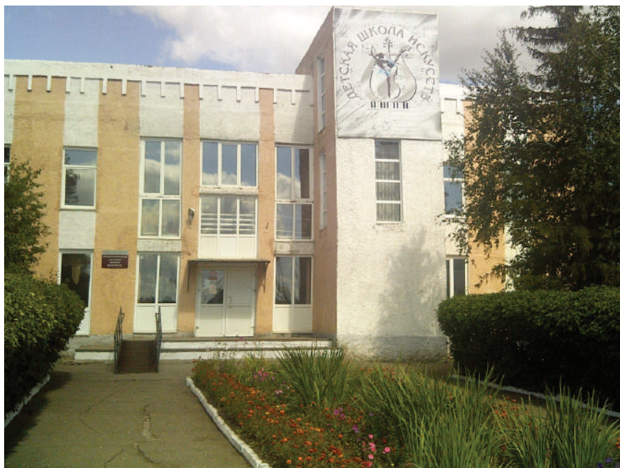
Илл. 9. Исилькуль. Детская школа искусств, 2018 г.