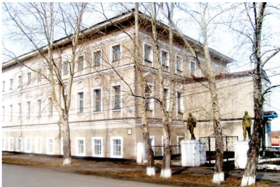
Илл. 7. Тара. Сменная общеобразовательная школа. Бывший Дом учителя.

Так, газета «Ленинский путь» от 2 июня 1960 г. сообщает, что «в ленинском зале школы № 2 им. Ф.Э. Дзержинского мимо памятника Ленину торжественным маршем прошли колонны пионеров, состоялось выступление гимнастов. Хорошо прошел праздник в Загородной роще. Состоялась торжественная линейка. Были подведены итоги экспедиции «Заветам Ленина верны» – рапортовали пионеры. Состоялся концерт городской музыкальной школы». Сочетание закрытых мест проведения мероприятий и на воздухе придавало им особую торжественность.