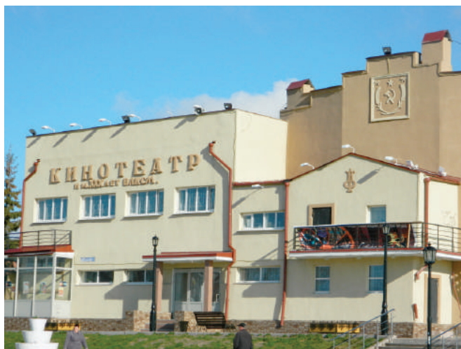
Илл. 1. Ишим. Кинотеатр им. 30 лет ВЛКСМ, 2013 г.