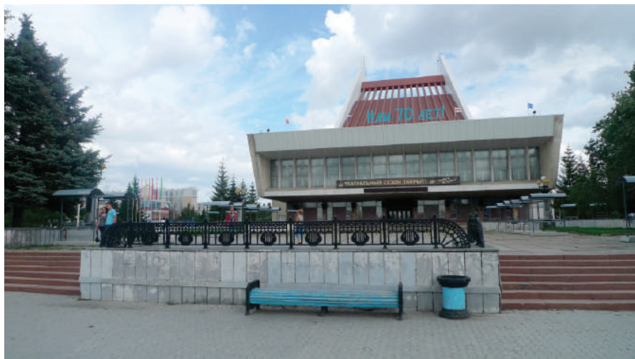
Илл. 13. Музыкальный театр, 2018 г.

в Советском районе – 1980 г. и др., 6 кинотеатров на 2,5 тыс. мест, музыкальный театр на 1200 мест (открылся в начале театрального сезона 1982 г.), зал органной и камерной музыки (первый концерт состоялся в декабре 1983 г.) 37 .