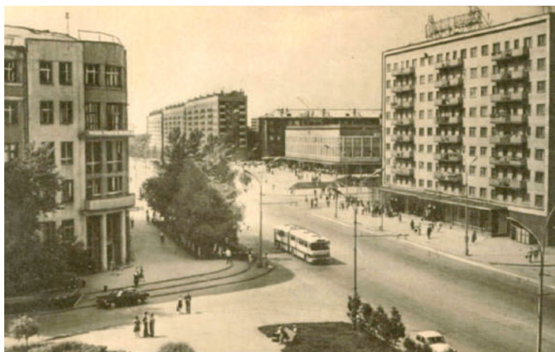
Илл. 2. Вокзальная магистраль.