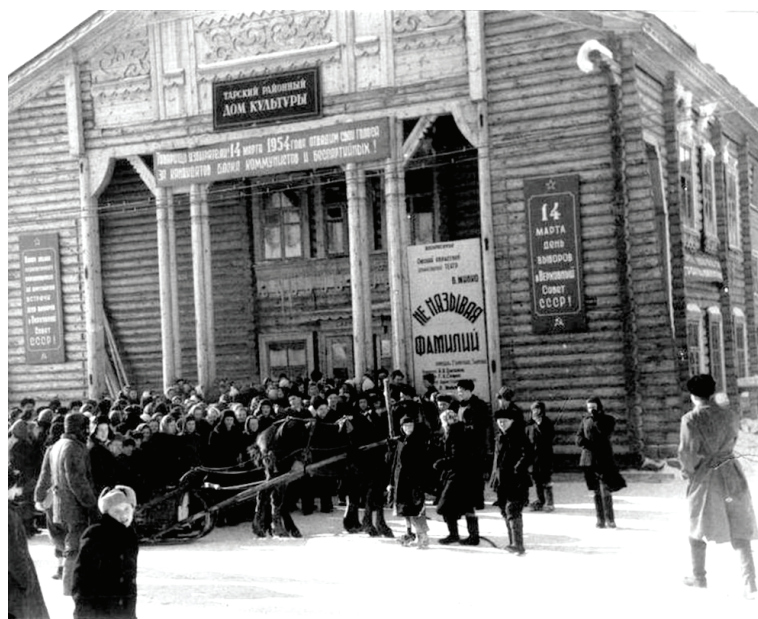
Илл. 5. Тара. Открытие Тарского районного дома культуры, 1954 г.

Работа Домов культуры целиком и полностью подчинялась политике партии и правительства и увязывалась с различными юбилеями советского календаря. Например, в связи с 40-летием Великой Октябрьской социалистической революции требовалось, по данным архивных документов, «усилить пропаганду произведений В.И. Ленина, развернуть работу по подготовке и проведению юбилейных мероприятий, рассказывать о завоеваниях советского народа, достижениях социалистического строительства. Организовать в РДК вечера встреч молодежи с участниками Великой Октябрьской социалистической революции и строительстве социализма в СССР, отчетные концерты коллективов, лекции-концерты. Проводить пропаганду передового опыта в Доме культуры» 24 .