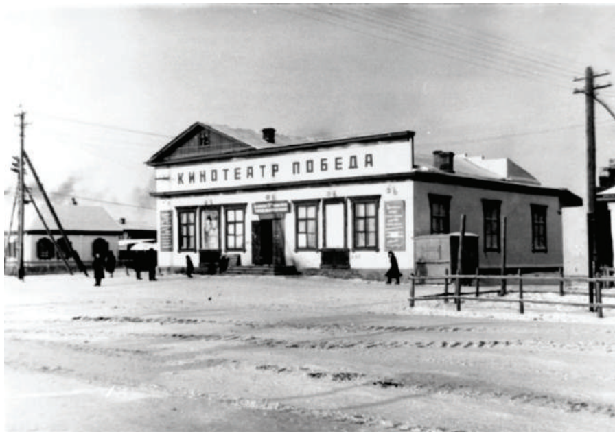
Илл. 11. Исилькуль. Кинотеатр «Победа», 1956 г.

монстрировалось в кинотеатре «Победа», в клубе железнодорожников и в клубе им. В.И. Ленина. В 50-е годы XX в. в Исилькуле, как и в других райцентрах по распоряжению Омского облисполкома, появился летний кинотеатр с количеством мест в 320 человек 63 . В 1961 году в Исилькуле открылся детский кинотеатр.