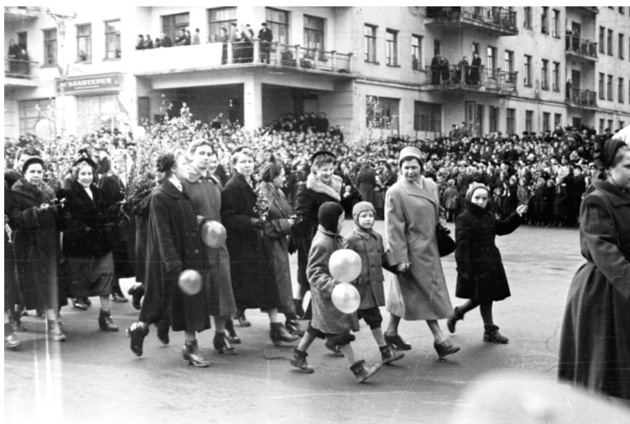
Илл. 3. Празднование 1 Мая. Новосибирск, начало 1970-х гг.