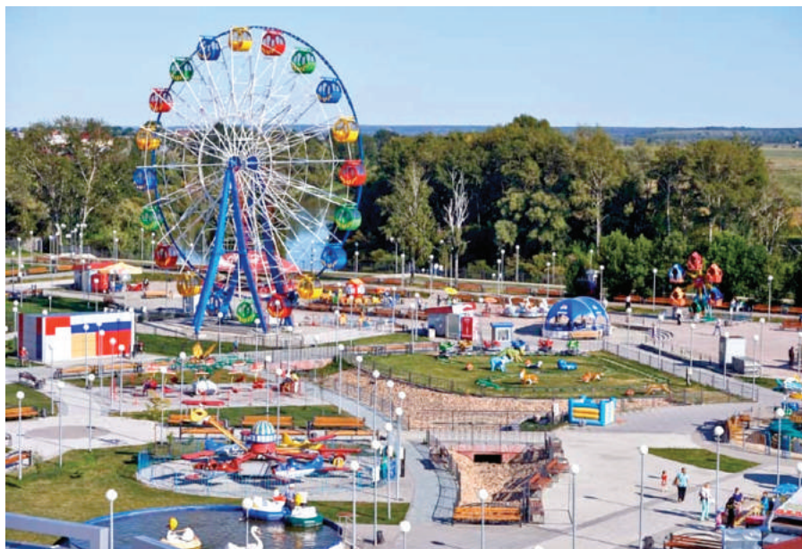
Илл. 4. Ишим. Городской парк культуры, 2015 г.

редко встречаются в средних и малых городах Западной Сибири и нуждаются в государственной охране. Позднее Ишим получил статус исторического города.