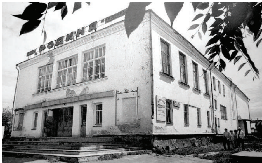
Илл. 6. Тара. Кинотеатр «Родина». Съемки 60-х годов XX в.

Кинообслуживанию, работе СМИ в городе уделялось особое внимание. 8 июля 1960 г. началось строительство широкоэкранного кинотеатра, рассчитанного на 500 мест, закончившееся 10 августа 1963 г. Кинотеатр в Таре стал называться «Родина». Он был возведен на пересечении улиц Ленина и Советской 26 . В Таре работал детский кинотеатр.