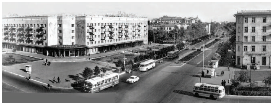
Илл. 11. Ленинградская площадь, 1964 г.

Поздний советский город Омск (1980-е) переориентировался на местных героев войны (ул. Береженого, 1982; Дмитриева, 1983; Комкова, 1982; Лисицкого, Телегина) и труда (ул. Степанца 1978; Штанина, 1998) 23 .