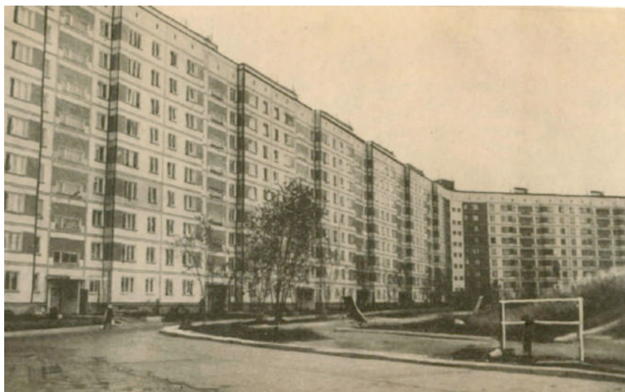
Илл. 4. Жилмассив Снегири.