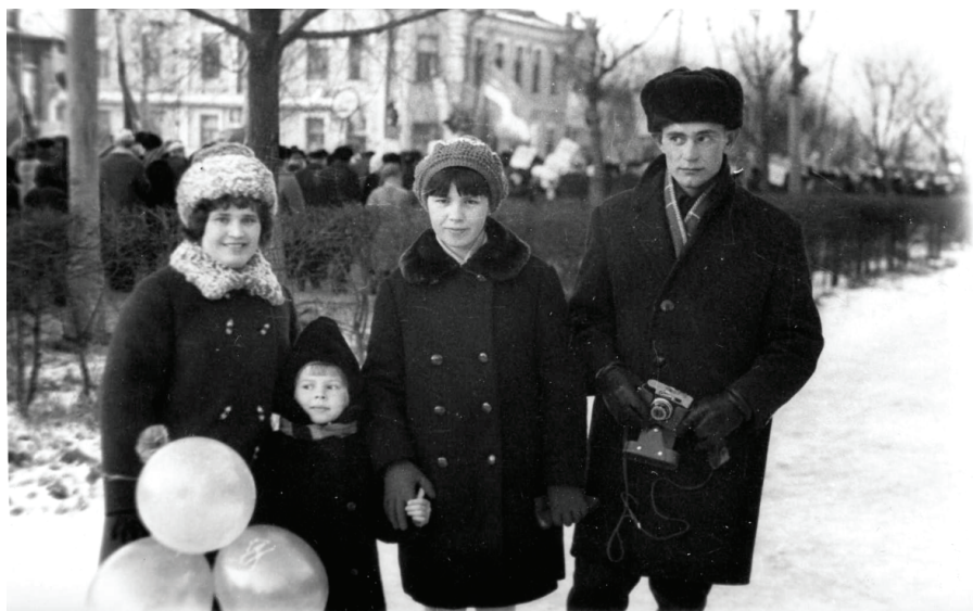
Илл. 1. Участники демонстрации в годовщину Великой Октябрьской социалистической революции. Омск, 1970 г.

Шествия демонстрантов сопровождалось музыкой, которая неслась из всех громкоговорителей, установленных на общественных зданиях и движущихся в колоннах машинах. Демонстранты несли транспаранты с лозунгами «Да здравствует Великая Октябрьская социалистическая революция!», «Слава КПСС!», портреты Ленина и членов политбюро, гербы союзных республик, красные флажки, разноцветные воздушные шары, искусственные бумажные гвоздики. В Новосибирске перед трибунами проходили колонны Ленинского, Кировского, Октябрьского, Заельцовского, Дзержинского, Центрального и Железнодорожного районов. В Омске демонстранты представляли Советский, Ленинский, Октябрьский, Куйбышевский, Центральный, Кировский, Первомайский районы. Открывали шествие отдельные колонны эмблемы предприятий, установленные на грузовой автомобиль. За ними следовали духовые оркестры (в Омске вызывала восторг зрителей колонна барабанщиц, одетых в костюмы гусар, ОМПО им. Баранова). Во главе колонн шли директора, парторги, комсорги и профсоюзные лидеры предприятий, за которыми следовали группы знаменосцев. В колоннах играли на гармошках, пели революционные и военные песни («Интернационал», «Марсельезу»,