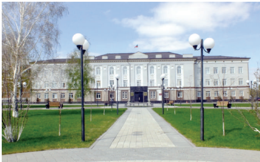
Илл. 3. Ишим. Административное здание, ул. Гагарина, 67, 2012 г.

Ранний и поздний периоды советской эпохи отражены в ряде административных и функциональных зданий. В стиле модерн было сооружено здание железнодорожного вокзала. Советский стиль, ориентированный на ордерные композиции в традициях исторического зодчества характерен для административного здания на ул. Гагарина, 67 (1955 г.). Три здания Ишима начала XX в. отвечают стилю конструктивизма: «Дом обороны (1931 г.), здание клуба имени Ильича (1926 г.), содержащее парадный вестибюль и зрительный зал; кинотеатр им. В.В. Блюхера (1930 г.)» 5 .