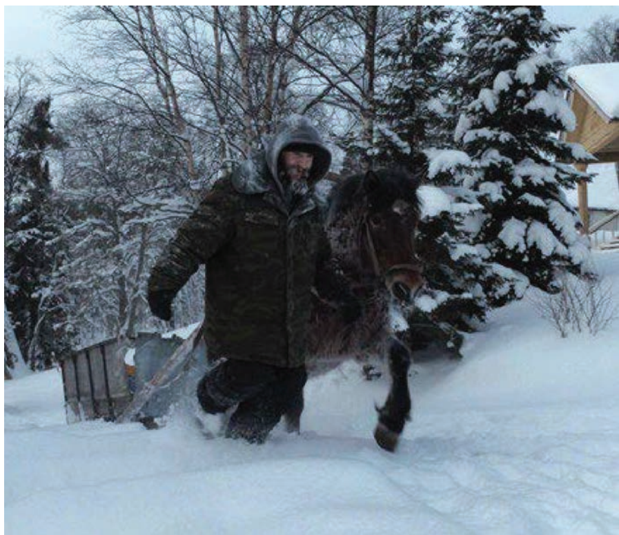
Рис. 11. Остров Анзер. Доставка груза на вершину горы Голгофа зимой

Кроме этого, за 20 лет существования скита его усердием и с помощью жертвователей почти полностью была отреставрирована Церковь Распятия Господня, утеплена и приспособлена для богослужения Церковь Воскресения Христова, восстановлены и построены вновь 5 часовен; срублены по старым, аутентичным технологиям 6 келий-изб; по мере возможности проведено благоустройство территорий, отремонтированы дороги, прочищены фрагменты озерно-канальных систем. Все это проделано за 20 лет и поддерживается в настоящее время при строгой субординации и послушании, характерным для Православной церкви: скиты — подведомственные ставропигиальному (т. е. напрямую управляемому Святейшем Патриархом) Соловецкому монастырю организации; в каждом скиту назначен скитоначальник, или Настоятель скита. Постоянно в Голгофо-Распятском скиту проживает примерно 20 насельников, при этом все без исключения вопросы решаются по благословию Настоятеля скита.