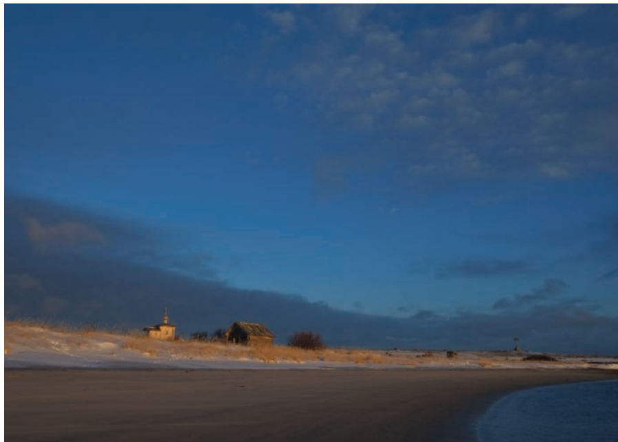
Рис. 9. Остров Анзер. Кирилловская морская губа. На горизонте — часовня во имя прп. Кирилла Новоезерского

деятельности территорию лесного фонда в границах острова Анзер, Голгофо-Распятский скит при этом продолжает многовековые традиции православного пустынножительства, в особенности — в период практически полугодового зимнего естественного затвора, когда связь не только с материком, но и с Соловецким островом отсутствует по погодным условиям.