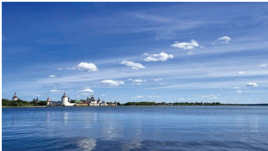
Рис. 1. Кирилло-Белозерский музей-заповедник