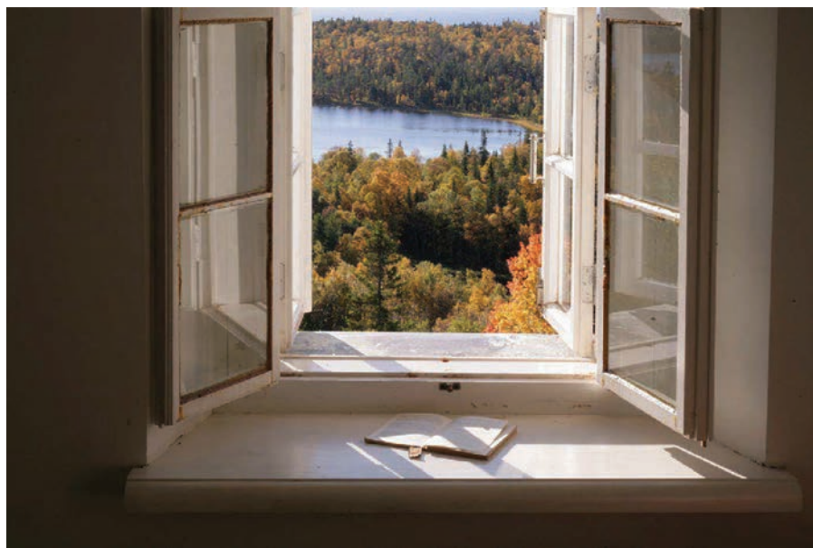
Рис. 14. Остров Анзер. Вид из окна скитского корпуса