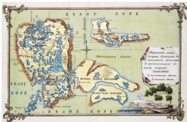
Рис. 5. Генеральный план острова Соловецкого, XVIII в.

Соловецкий монастырь, расположенный на Соловецком архипелаге (347 кв. км) и основанный в 1436 г., был одним из самых известных и крупных в России. Кроме сонма почитаемых святых и новомучеников лагерного времени, особых певческих и иконописных традиций, драгоценной утвари, святая обитель славилась своим крепким хозяйственным укладом. Уникально на архипелаге разнообразие типов традиционных монашеских поселений, одновременно демонстрирующих пример высокой целостности духовного, культурного и природного пространства. При знакомстве с историей развития обители неизбежно возникает вопрос: как можно было управляться с огромными территориями удаленного архипелага (в т. ч. — с побережьем материка) в суровых условиях русского Приполярья, успешно управлять ими на протяжении веков?