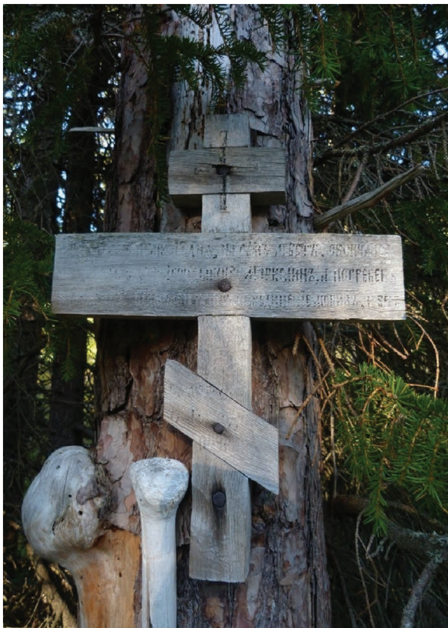
Рис. 10. Остров Анзер. Крест на месте кончины иеродиакона Маркеллина