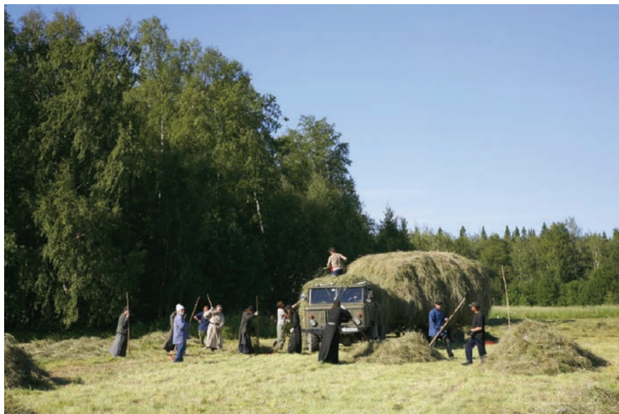
Рис. 12. Монастырский сенокос

Можно констатировать: при определении в рамках достопримечательного религиозно-исторического места режимов и регламентов Анзера необходимо учитывать обстоятельства, которые мы пытались изложить: подойти с пониманием к насущной необходимости максимально соблюдать на острове Анзер, в отсутствие мирского населения, те режимы, которые, в соответствии с IV критерием ВУЦ и видом пользования, должны соответствовать и способствовать скитской монашеской жизни как в Голгофо-Распятском и Свято-Троицком скитах, так и во всех исторических скитских промысловых и хозяйственных поселениях (около десяти), расположенных на территории острова.