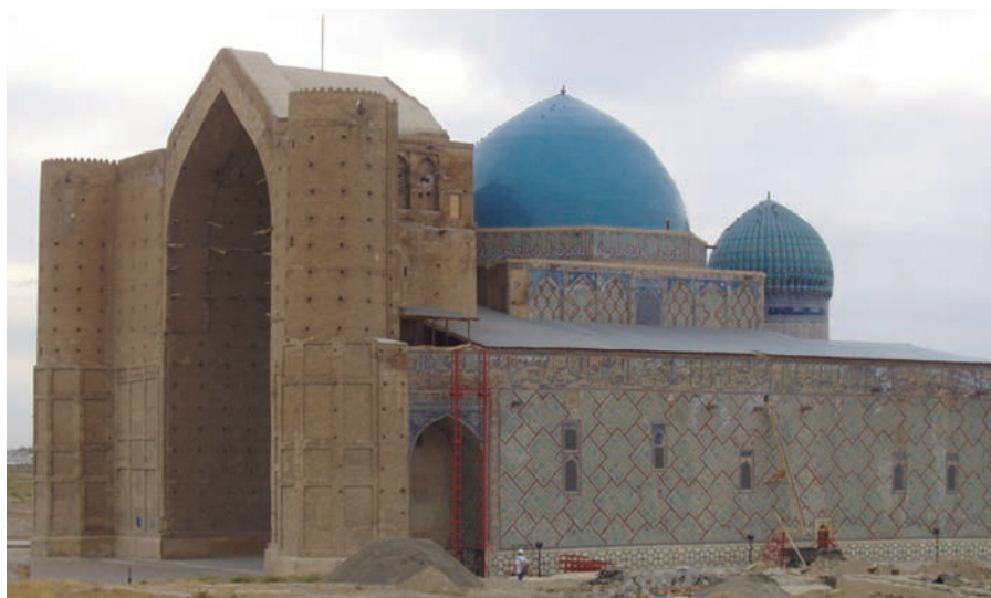
Рис. 4. Мавзолей Ходжи Ахмеда Ясави: вид с востока

Интересно, что на крыше можно найти плитку, оставленную иранскими мастерами. Тем не менее, мавзолей никогда не пустовал, он являлся ханокой. Ханока — это мусульманский памятник, где есть и мавзолей, и библиотека, и места трапезы для паломников. Мавзолей функционировал как ханока вплоть до времен СССР. На данный момент мавзолей находится в Туркестане.