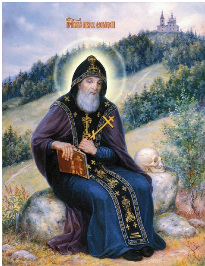
Рис. 6. Преподобный Иов (в схиме — Иисус) Анзерский, основатель Голгофо-Распятского скита (1635–1720 гг.)

Необходимо пояснить, что монашествующие могут жить киновиально, т. е. в общежительной обители, или пустынножитьельствовать (жить в пустыни), отшельничать, анахоретствовать. Все эти уклады представлены на Анзере и в наши дни. В летний период остров регулярно посещают иноки из других, в том числе многонаселенных обителей, чтобы некоторое время провести «в затворе», ни на что не отвлекаясь от молитвы, внутренней беседы с Богом. Анзерский остров своей уединенностью и девственной природой издавна привлекал стремящихся к пустынножительству. Предлагаем ознакомиться с особенностями уставной монашеской жизнедеятельности и с управлением многокомпонентным хозяйством.