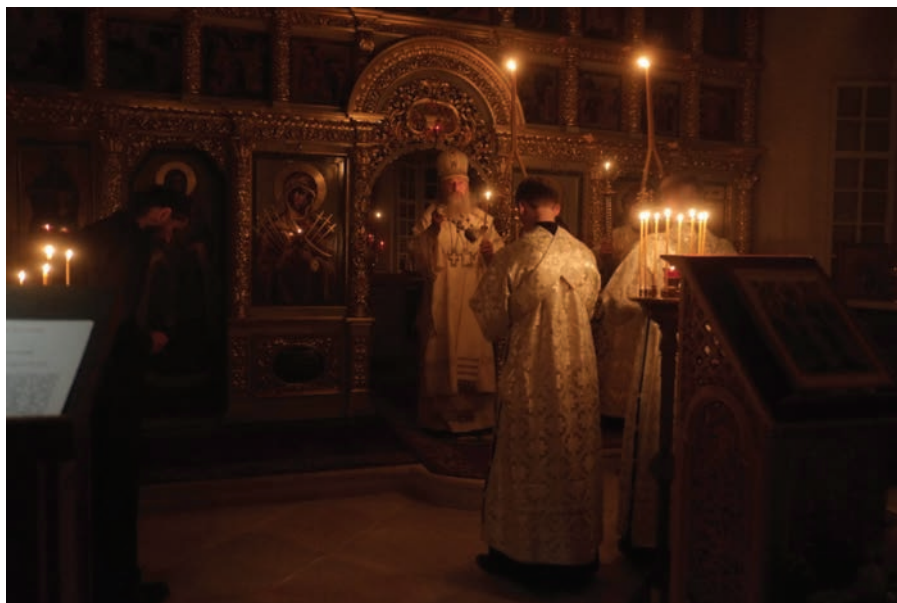
Рис. 7. Остров Анзер, Голгофо-Распятский скит. Ночная служба в храме Распятия Господня (1827–1830 гг.); восстановлен усердием скита

Само слово «инок», т. е. иной, говорит нам о многом и приводит к выводу, что не нужно пытаться оценивать, сравнивать с общепринятыми нормы иноческой жизни. Нынешняя православная религиозная деятельность скитов на острове Анзер (площадь острова 47 кв. км) ведется, как и во всем Соловецком монастыре, в соответствии с собственным Уставом, святоотеческими наставлениями и церковным Преданием.