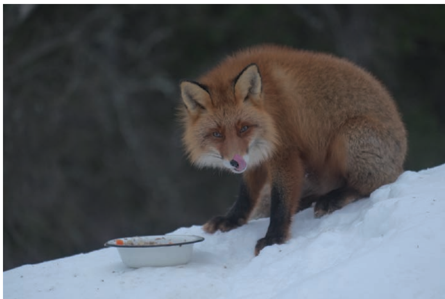
Рис. 13. Анзерские «братья меньшие» не остаются без заботы скитян

По мнению эксперта в области сохранения Всемирного наследия Х.-М. Маллараха, монастырский уклад ведения хозяйства является оптимальным прежде всего для развития и управления самого объекта религиозного назначения, но основные принципы применимы и для управления депрессивными территориями. По мнению автора, такой подход в ведении хозяйства позволяет говорить об устойчивом развитии конкретной территории.