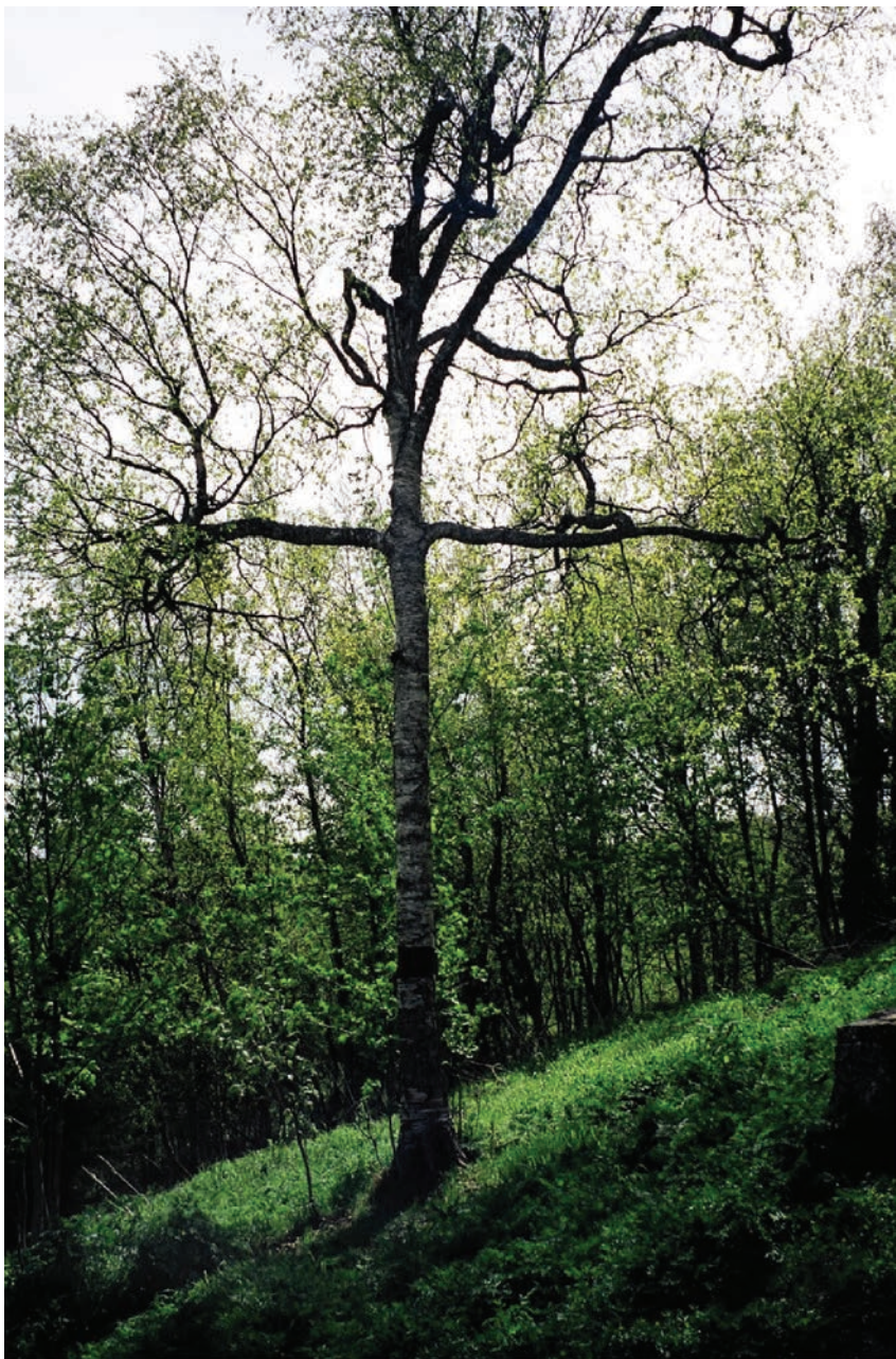
Рис. 15. Остров Анзер. Береза в виде креста, выросшая на склоне горы Голгофа