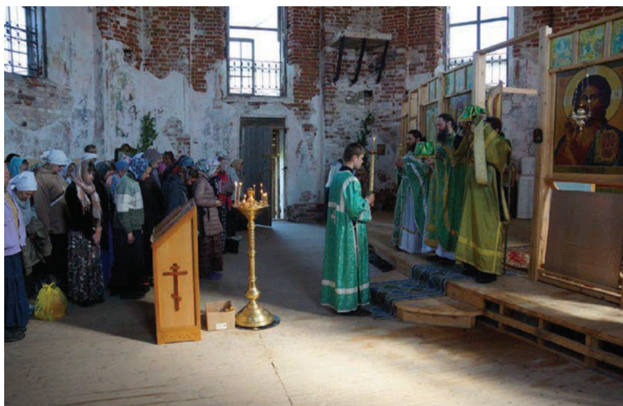
Рис. 8. Остров Анзер. Богослужение в Свято-Троицком скиту

В 1992 г. ансамбль Соловецкого монастыря был включен в списки объектов всемирного наследия ЮНЕСКО в соответствии с IV критерием: «Соловецкий комплекс является исключительным примером монастырского поселения в суровых условиях Северной Европы, превосходно иллюстрирует веру, целеустремленность и мужество русской православной религиозной общины средневековья. Дальнейшая история обители хорошо прослеживается в богато представленных сохранившихся свидетельствах». Формулировка критерия во многом отражает обстоятельства нынешней иноческой жизни на Анзере, равно как и на всем Соловецком архипелаге, в суровых условиях русского Севера. Организациями, управляющими объектом всемирного наследия ЮНЕСКО, являются Соловецкий монастырь и музей, поскольку в их пользовании и оперативном управлении находятся почти все объекты культурного наследия (памятники истории и культуры) архипелага. С Соловецким монастырем традиционно согласовывают документы стратегического планирования, разработанные для Соловков.