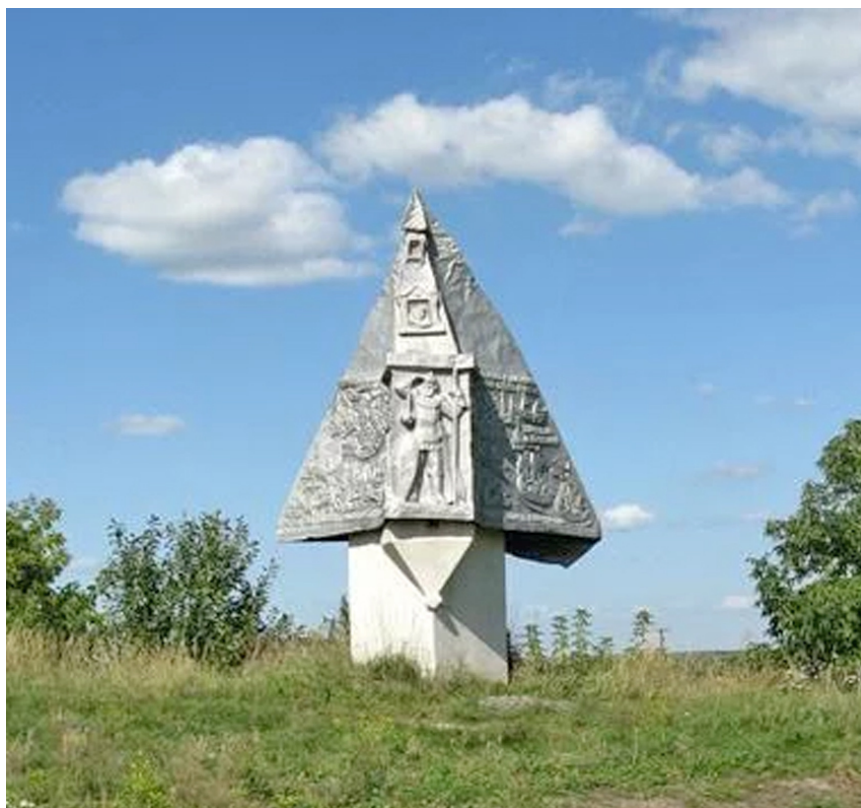
Рис. 9. Памятный знак «Основателям города Тары».