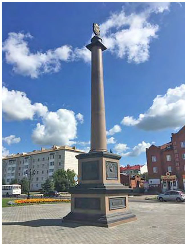
Рис. 3. «Историческая колонна на Привокзальной площади». 19 августа 2019 г., Ишим