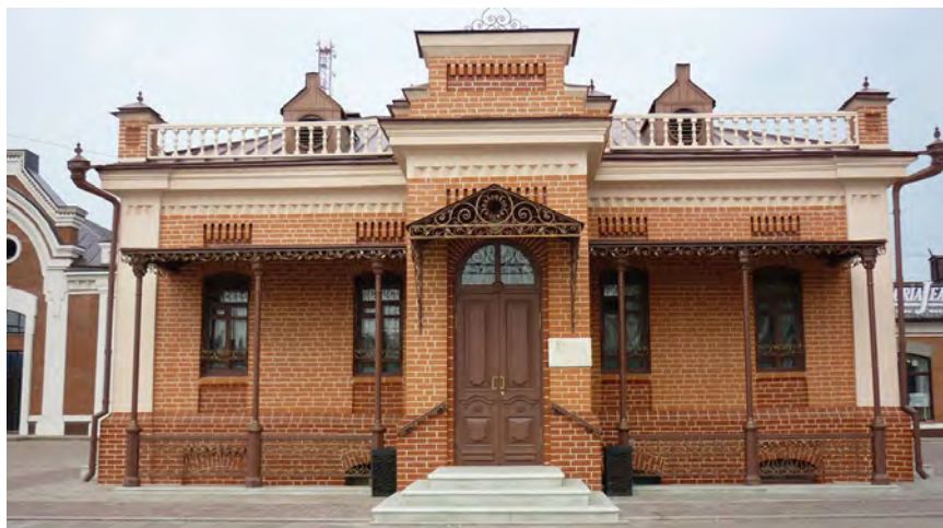
Рис. 4. Здание Литературно-краеведческого центра, 2011–2018 гг. Источник: Уникальность архитектуры Тюмени безусловна: рассказываем, какие здания делают наш город неповторимым [Электронный ресурс] // 72.RU. Городской портал Тюмени : [сайт]. URL: https://72.ru/text/gorod/65691841 (дата обращения: 11.11.2019)

общеизвестная и новая / уникальная, размещается также на сайте ТОНБ. Полезная для исследователей местной истории информация содержится в краеведческих подразделах «Раритетные издания», «Новинки краеведения», «Электронная выставка», а также «Наши издания» в разделе «Ресурсы».