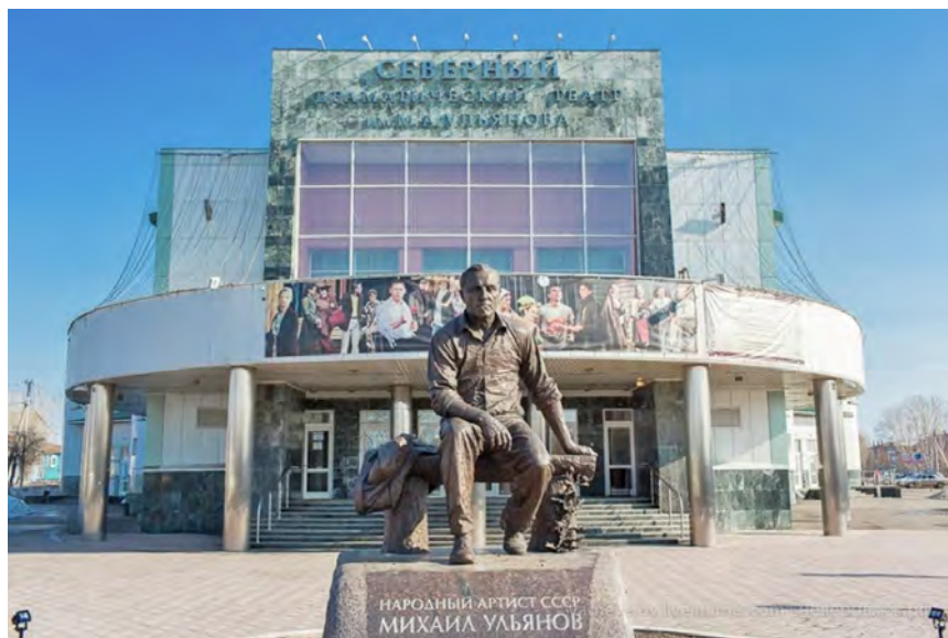
Рис. 8. Памятник М. А. Ульянову.

15 метров, увенчанный главкой с крестом. По замыслу автора памятник олицетворяет часовню и напоминает жителям города о людях, которые его основали 28 . Этой же идеи подчинена круговая надпись: «От граждан города Тары в честь ее четырех веков. 1594–1994».