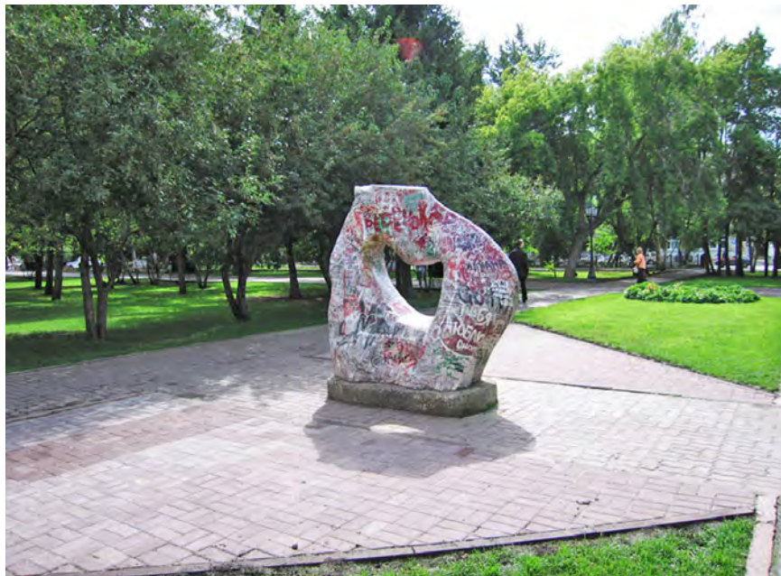
Рис. 6. Скульптурная композиция «Любовь» в Первомайском сквере.