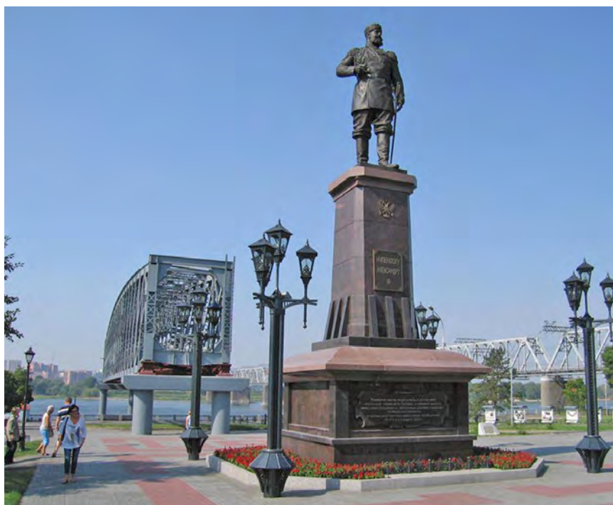
Рис. 3. Памятник императору Александру III на набережной Оби.