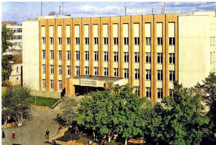
Рис. 1. Тюменская областная научная библиотека, 1988–1990 гг. Источник: Областная научная библиотека (1988–1990) // Горизонты Тюмени. М. : Советская Россия, 1990. 159 с.

После реконструкции здание ТОНБ кардинально преобразилось: появились колонны, арочный декор, гранитная облицовка фасада, внешних и внутренних лестниц 43 .