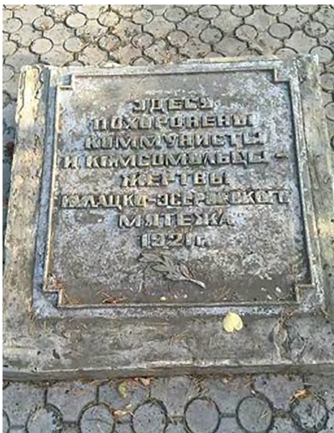
Рис. 4. Мемориальная плита братской могилы жертв Западно-Сибирского крестьянского восстания. 20 августа 2019 г., база отдыха «СССР» близ г. Ишима. Описание: мемориальная плита, находившаяся до 1976 г. на братской могиле в Первомайском сквере. На дату съемки располагалась на базе отдыха «СССР» в Синицынском бору

крупнейшем в период Гражданской войны, которое также именуется «Ишимским». С другой стороны — местные органы власти, не желающие лишний раз акцентировать внимание на сложных и неудобных вопросах отечественной истории, неподдающихся однозначной оценке, не вписанных в официальный нарратив. Третьим участником стала компания «Екатеринбургский художественный фонд», развернувшая в Ишиме активную деятельность в 2011 г., реализуя свои замыслы, при этом не всегда ориентируясь на интересы местного сообщества.