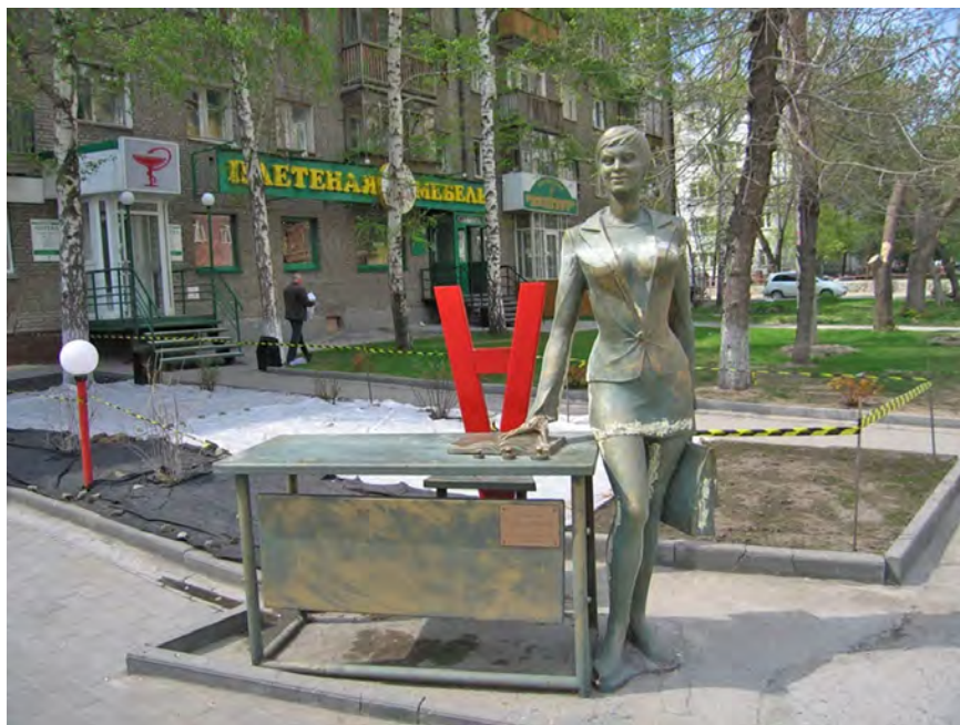
Рис. 5. Скульптура «Деловая женщина» на улице Мичурина.