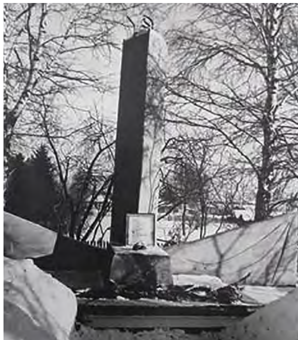
Рис. 2. Памятник жертвам колчаковщины.

В августе 1919 г. белогвардейцами в Таре было расстреляно 17 человек. В память о них летом 1920 г. на братской могиле на окраине города жители установили деревянный памятник. В 1977 г., в год 60-летия Октябрьской революции, деревянный памятник был заменен на обелиск из железобетонных конструкций в виде трехгранной усеченной пирамиды, которую венчала металлическая пятиконечная звезда. На мемориальной доске были высечены имена жертв белогвардейского террора, у подножия пирамиды — красноармейская шапка-ушанка с красной лентой. Композицию завершали бетонные плиты по бокам памятника, символизирующие приспущенные в знак траура знамена (рис. 2).