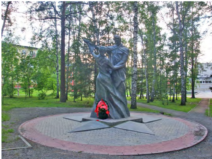
Рис. 4. Памятник «Вальс Победы» в Академгородке.

ДК «Академия» в 2010 г. была установлена скульптурная композиция «Вальс Победы» (скульптор — А. Агриколянский), которая изображает юношу и девушку, танцующих вальс, что символизирует торжество жизни, радость победы, надежды на будущее.