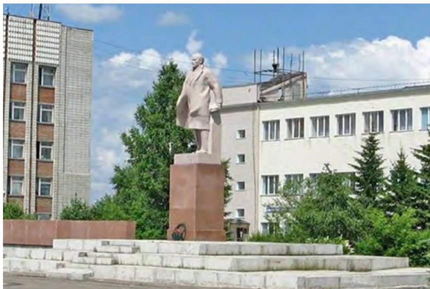
Рис. 1. Памятник В. И. Ленину. Источник: фото автора. 2017 г.

Еще один памятник вождю был установлен в Таре в 1959 г. на территории автотранспортного предприятия. Его инициаторами выступили работники предприятия. Памятник был заказан в Ленинграде на заводе «Монумент-скульптура». Постамент для него был изготовлен сотрудниками предприятия. Следует отметить, что и сегодня коллектив автотранспортного предприятия занимается благоустройством территории вокруг памятника 19 .