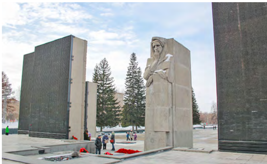
Рис. 2. Мемориальный ансамбль «Подвигу сибиряков в Великую Отечественную войну 1941–1945 гг.».