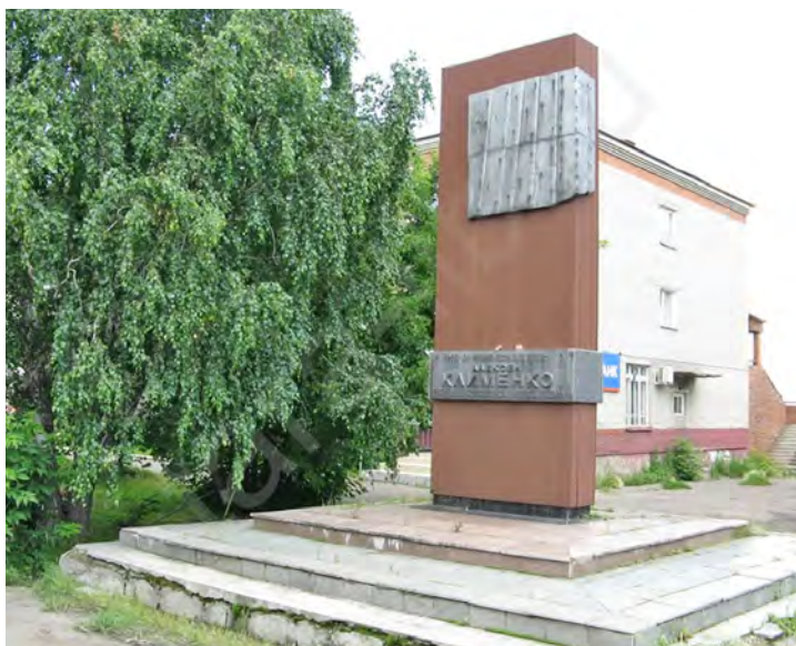
Рис. 3. Памятник А. Клименко (после реконструкции). Источник: Памятники истории и памятные места города Тары. Тара: МУК «ТЦБС», 2010. С. 14

Еще одним символом, связанным с трагическими событиями первой половины XX в., является памятник красноармейцу Алексею Клименко. Он погиб 16 ноября 1919 г. при освобождении города от колчаковцев и был похоронен в центре города. На его могиле земляки установили деревянный памятник в виде четырехгранной усеченной пирамиды, увенчанной пятиконечной звездой. 5 августа 1988 г., в канун первого Дня города, открылся реконструированный обелиск — стела, облицованная мраморными плитами. На одной из ее граней размещена мемориальная доска с надписью: «Здесь похоронен командир взвода 455 особого стрелкового полка Алексей Клименко, героически погибший в бою 15 ноября 1919 г. при освобождении города Тары от колчаковщины» (рис. 3).