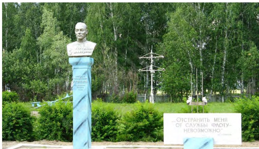
Рис. 7. Памятник Н. Г. Кузнецову.