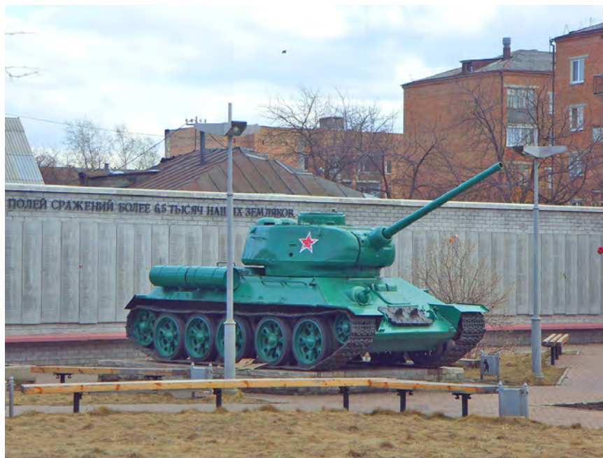
Рис. 5. Памятник-танк.

ного комплекса активно включились горожане, и в День города, в 2005 г., состоялось открытие обновленного сквера Победы. С площади в сквер был перенесен танк, появились ограждения в виде якорных цепей, скамейки и арочные проходы.