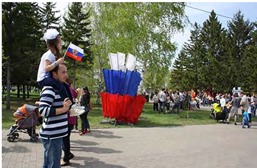
Рис. 1. Празднование 9 Мая в парке Победы. Омск, май 2015 г.

День России, День молодежи, массовые гуляния, посвященные празднованию Дня Победы. В летний период коллективы парков активно работали с летними оздоровительными площадками, на базе которых проводились следующие мероприятия: праздники, ролевые игры, развлекательно-познавательные и игровые программы, конкурсы, эстафеты, семейные праздники, посвященные мамам и бабушкам, акции эколого-благоустроительного характера (например, в Омске акция «Раскрась скворечник, установи домик для птиц»), спортивные состязания, шоу-программы, смотры творческой самодеятельности и др. Кроме того, проводился ряд мероприятий социальной направленности, например бесплатные мероприятия для детей из детских домов, детей из малообеспеченных семей и другие благотворительные акции и мероприятия социальной направленности.