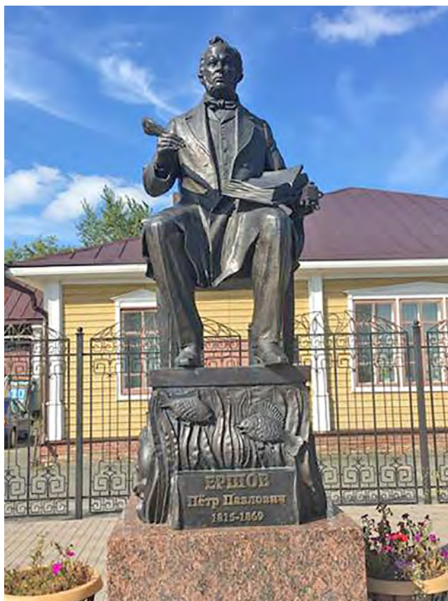
Рис. 1. Памятник П. П. Ершову. 20 августа 2019 г., Ишим. Памятник располагается возле Культурного центра имени П. П. Ершова

культуре. Своеобразными брендами Ишима является Пётр Ершов, родившийся в деревне Безруково (ныне — Ершово) близ Ишима, автор всемирно известной сказки «Конек-горбунок», а также история девушки Прасковьи Луполовой — дочери ссыльного солдата, отправившейся пешком в Петербург просить помилования для отца, ставшей прототипом для ряда литературных произведений начала XIX в. Эти фигуры явились основой для формирования представлений о прошлом Ишима в краеведческих текстах, а также в мемориальных практиках, в том числе в установке памятников.