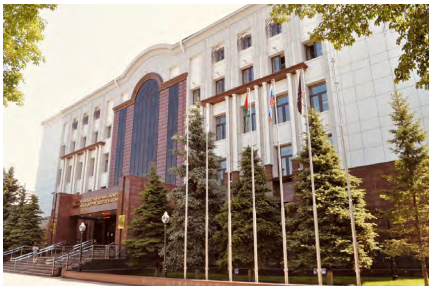
Рис. 2. ТОНБ, 2009–2018 гг.

Источник: О войне стихов немало сложено [Электронный ресурс] // «Тюменские известия» — парламентская газета : [сайт]. URL: https://t-i.ru/articles/19870 (дата обращения: 11.11.2019)