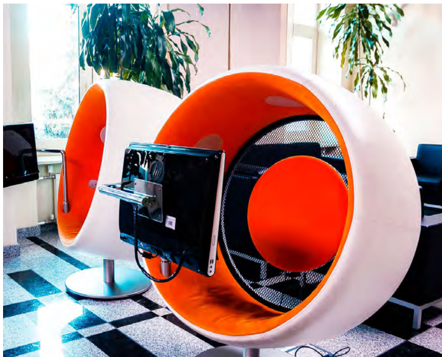
Рис. 3. Мультимедийные кресла.

работы с документами и информацией, для проведения совещаний и деловых встреч, видеоконференций, обучающих и культурных мероприятий различного уровня, а также полноценного отдыха читателей. Учреждение располагает также трехуровневой автостоянкой. С 2011 г. библиотекой реализуется региональная комплексная программа Тюменской области «Доступная среда». Комфорт библиотеки оценил в 2016 г. представитель тюменских СМИ, провел тест-драйв учреждения, отметил плюсы и совсем мало минусов 44 .