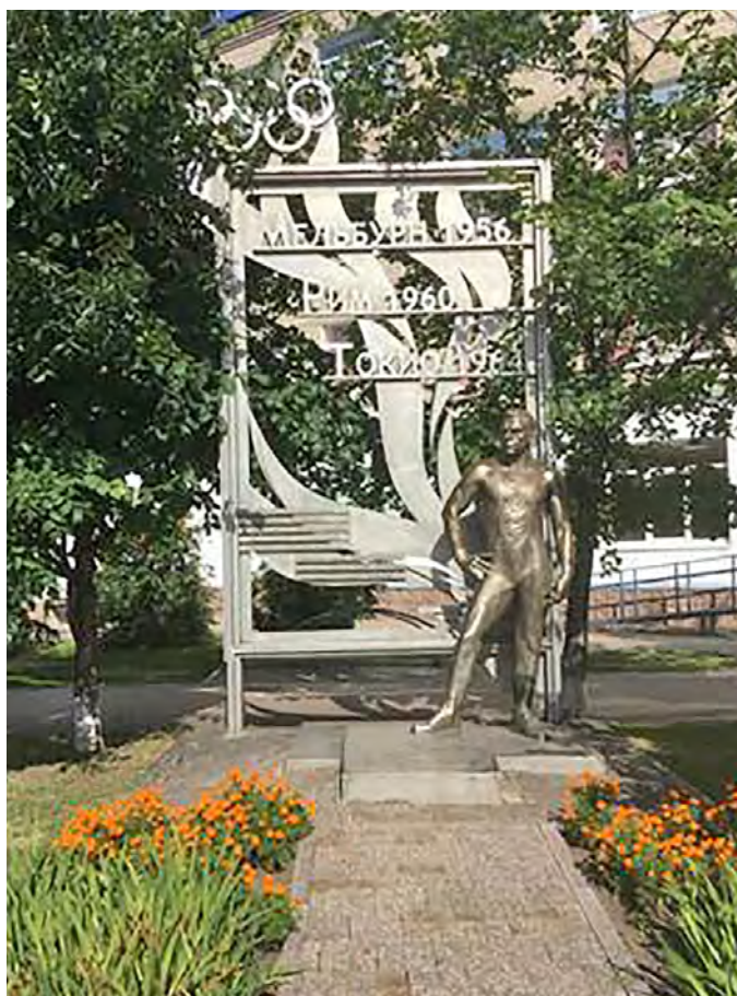
Рис. 6. Памятник Б. А. Шахлину.

характер и волю, а памятник Никитину сопровождается скульптурным изображением чертежа Останкинской телебашни. Этим памятникам даются полярные оценки со стороны специалистов. Надежда Леонидовна Проскурякова склонна вовсе не считать их памятниками, уравнивая с малой городской скульптурой. Геннадий Андреевич Крамор, напротив, считает памятники Шахлину и Никитину одними из наиболее значимых для города, подчеркивая их удачное месторасположение для проведения экскурсий.