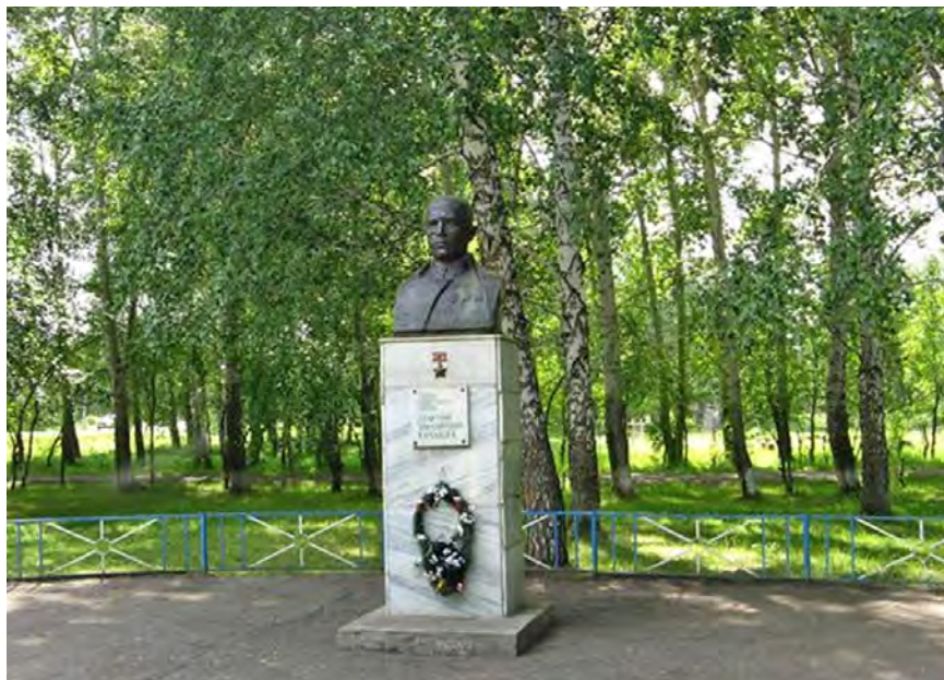
Рис. 6. Памятник Д. М. Карбышеву. Источник: фото автора, 2017 г.

Памятник Д. М. Карбышеву установлен перед школой-интернатом по инициативе его воспитателей и воспитанников; он является единственным памятником подобного рода в малых городах Среднего Прииртышья (рис. 6).