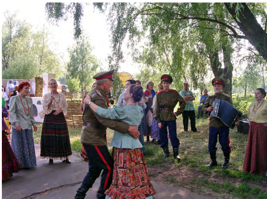
Рис. 2. Фестиваль казачьей культуры «Наследие» в парке «Зеленый остров». Омск, июнь 2005 г.

Решение о создании городского ПКиО «Зеленый остров» было принято 20 июля 1981 г., а торжественное открытие состоялось 10 августа 1985 г. Парк строился по проекту архитекторов Г. Чиркина, Л. Масловой, А. Гаценко, Г. Проскуриной и инженера Е. Дамирова методом народной стройки и при активном участии коллективов промышленных предприятий и организаций Омска. Парк занимает территорию в 42 гектара.