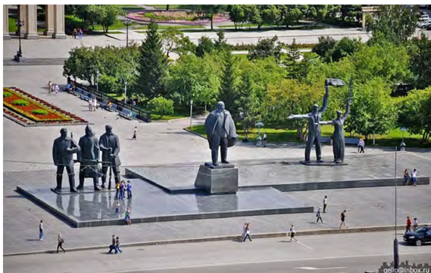
Рис. 1. Памятник В. И. Ленину на площади В. И. Ленина. Источник: Архитектура Новосибирска. Архитектурно-строительный справочник. URL: http://nsk.novosibdom.ru/node/354 (дата обращения: 08.07.2019)

революции, и слева — фигуры юноши с факелом и девушки с колосьями, символизирующие будущее, преемственность поколений.