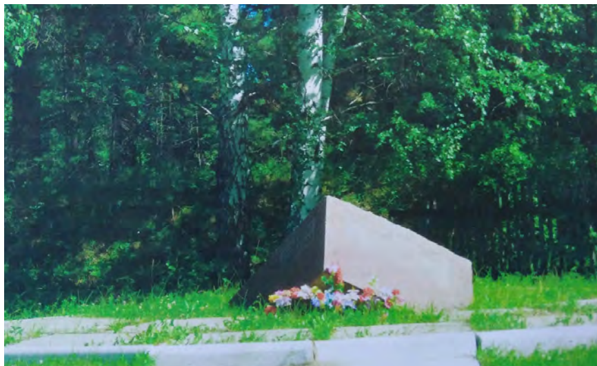
Рис. 11. Памятный знак жертвам политических репрессий.

на которых размещены надписи: «Тарчанам-землякам, погибшим в годы репрессий» и «Помним, скорбим». Ежегодно в День памяти жертв политических репрессий возле памятника проходят митинги.