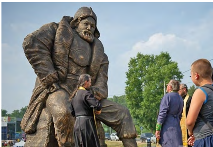
Рис. 10. Памятник Ермаку.

Иртыша на Тару реку, где было бы государю впредь прибыльное пашню завести и Кучума-царя истеснить и соль устроить». Здесь же размещен герб Тары.