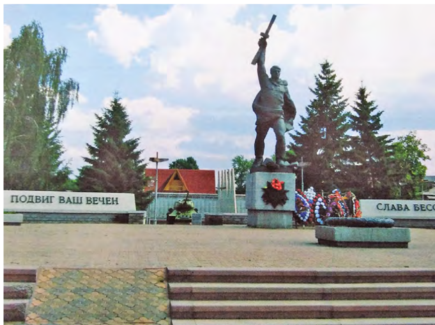
Рис. 4. Сквер Победы.

4 августа 1989 г. мемориальный комплекс был дополнен еще одним элементом — это памятник-танк, водруженный на пьедестал (рис. 5) и посвященный тарчанам-танкистам, участвовавшим в боях за Родину 26 . После открытия памятника ветераны войны высказали пожелание об установлении на башне танка номера и надписи на его пьедестале.