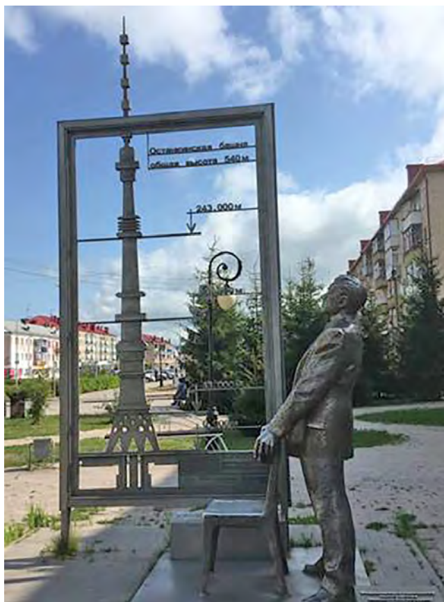
Рис. 5. Памятник Н. В. Никитину. 21 августа 2019 г., Ишим

Еще одни герои советской эпохи, связанные с Ишимом, обладают куда более основательным и непротиворечивым обоснованием для коллективной мемориализации. В 2011 г. все тем же Екатеринбургским художественным фондом были установлены памятники Н. В. Никитину, советскому архитектору и конструктору, автору проекта Останкинской башни, и Б. А. Шахлину, советскому гимнасту, семикратному олимпийскому чемпиону. Детство Никитина и Шахлина прошло в Ишиме, здесь они получали начальное образование. Памятники им выполнены в стилистическом единстве, основным материалом для обоих послужила нержавеющая сталь. В случае с Шахлиным это должно подчеркивать его «железный»