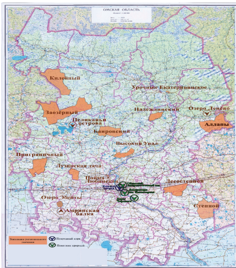
Рис. 1. Особо охраняемые природные территории Омской области 4