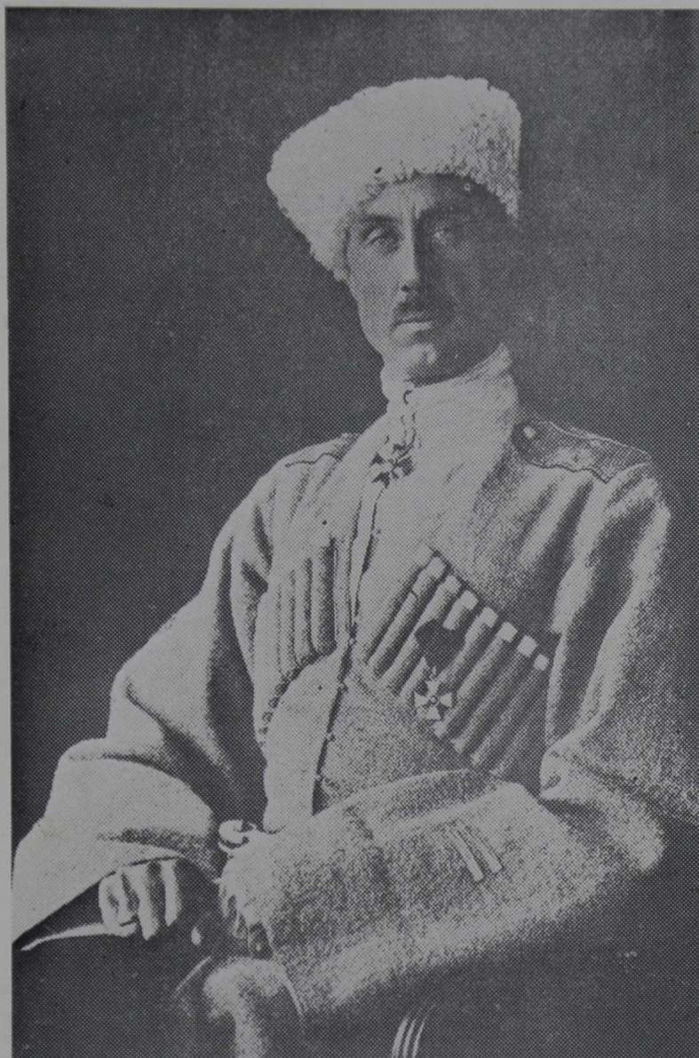
Командующий Кавказской Армией Генерал Барон Петр Николаевич Врангель.