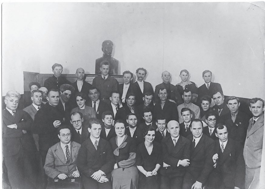
Первая конференция корреспондентов журнала «Колхозный театр», Москва, 7–10 января 1936 г.