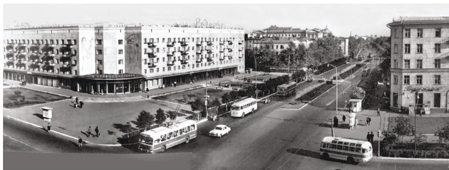
Илл. 11. Ленинградская площадь, 1964 г.