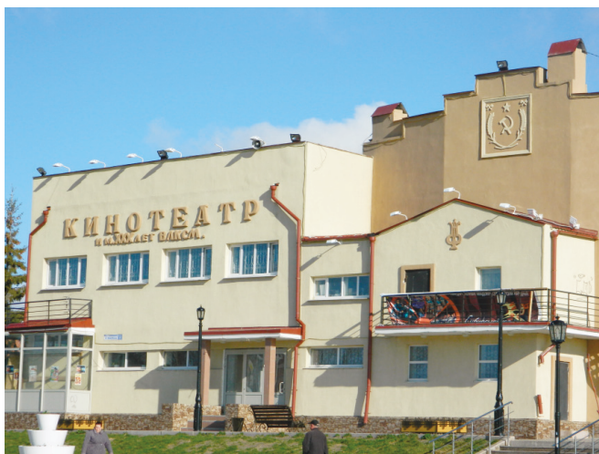
Илл. 1. Ишим. Кинотеатр им. 30 лет ВЛКСМ, 2013 г. Источник: Википедия – свободная энциклопедия. – URL: https://ru.wikipedia.org/wiki/Ишим (дата обращения: 22.02.2019)