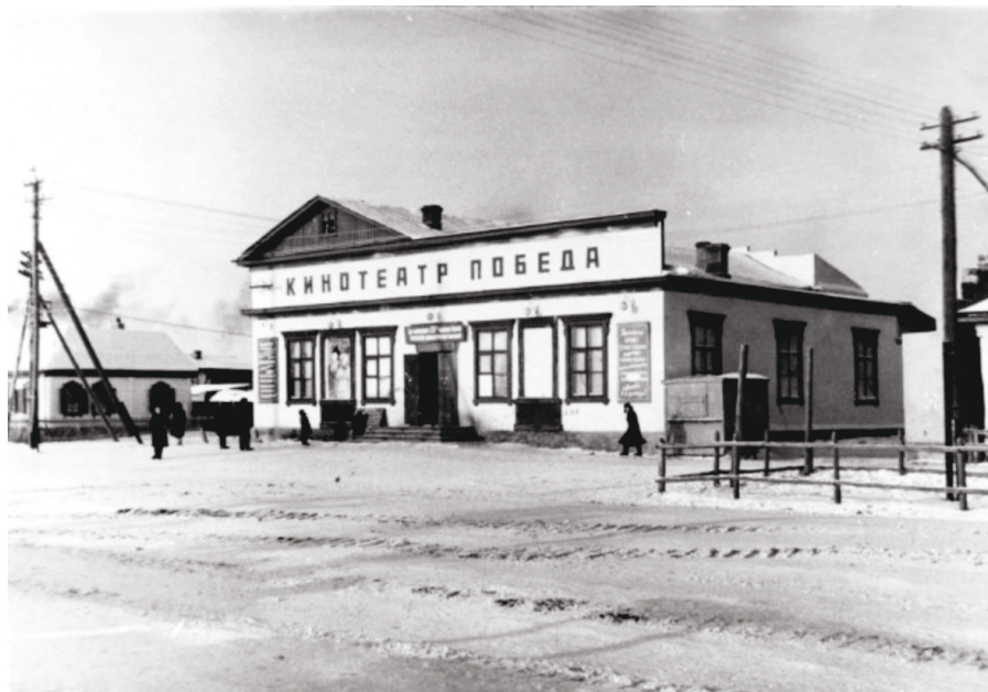
Илл. 11. Исилькуль. Кинотеатр «Победа», 1956 г.

монстрировалось в кинотеатре «Победа», в клубе железнодорожников и в клубе им. В.И. Ленина. В 50-е годы XX в. в Исилькуле, как и в других райцентрах по распоряжению Омского облисполкома, появился летний кинотеатр с количеством мест в 320 человек 63 . В 1961 году в Исилькуле открылся детский кинотеатр.