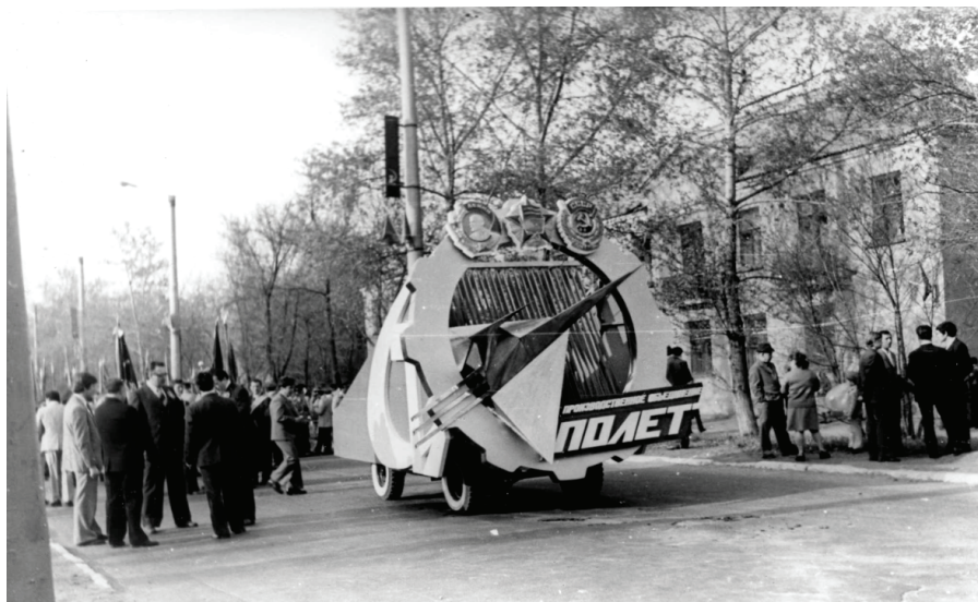
Илл. 5. Эмблема ПО «Полет» на демонстрации. Омск, середина 1970-х гг.