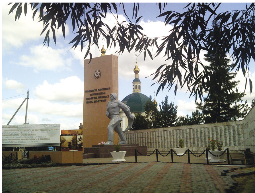
Илл. 8. Исилькуль. Мемориал славы воинам Великой Отечественной войны: памятник воинам-землякам, погибшим в годы Великой Отечественной войны, 2018 г.