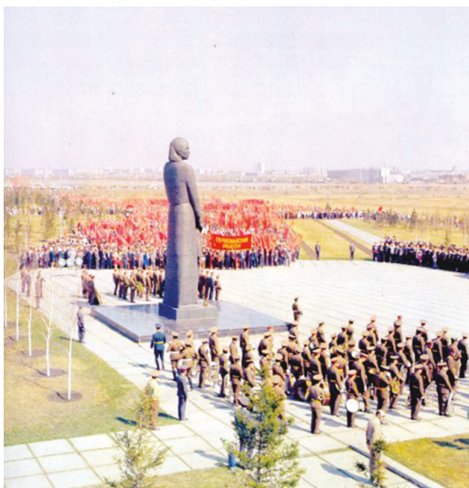
Илл. 2. Празднование Дня Победы в Омске, Парк Победы (середина 1970-х гг.).

омичей и новосибирцев приковывал военный парад на Красной площади в столице нашей Родины – городе-герое Москве. По телевидению демонстрировались художественные фильмы о войне – «Щит и меч», «Брестская крепость», «17 мгновений весны», «Они сражались за Родину», «Молодая гвардия», «Два бойца», «Летят журавли», «Освобождение» и другие. Самыми любимыми фильмами о войне среди всех возрастов являлись фильмы «А зори здесь тихие» и «В бой идут одни старики». Популярность этих кинолент объясняется простотой и трогательностью героев фильмов, которые стали символами верности долгу, несгибаемости и настоящего патриотизма. Песнями о войне, которые омичи и новосибирцы любили слушать на концертах и исполняли сами во время застолий и празднований, стали песни «Вставай, страна огромная», «Хотят ли русские войны», «Темная ночь», «Враги сожгли родную хату», «Журавли», «Катюша», «Землянка», «На безымянной высоте», «Песенка фронтового шофера», «Синий платочек», «Смуглянка», «Десятый наш десантный батальон» и другие. Самой популярной являлась песня Давида Тухманова и Владимира Харитонova «День Победы», написанная в 1975 г. к 30-летию Победы.