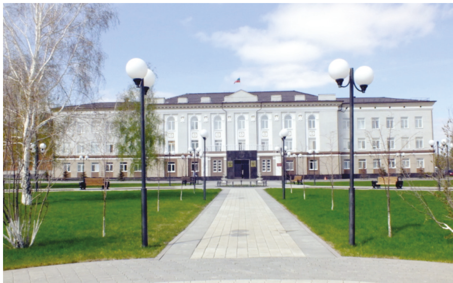
Илл. 3. Ишим. Административное здание, ул. Гагарина, 67, 2012 г.

Ранний и поздний периоды советской эпохи отражены в ряде административных и функциональных зданий. В стиле модерн было сооружено здание железнодорожного вокзала. Советский стиль, ориентированный на ордерные композиции в традициях исторического зодчества характерен для административного здания на ул. Гагарина, 67 (1955 г.). Три здания Ишима начала XX в. отвечают стилю конструктивизма: «Дом обороны (1931 г.), здание клуба имени Ильича (1926 г.), содержащее парадный вестибюль и зрительный зал; кинотеатр им. В.В. Блюхера (1930 г.)» 5 .