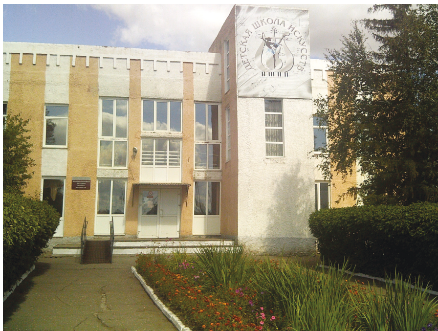
Илл. 9. Исилькуль. Детская школа искусств, 2018 г.

В библиотеках использовались многообразные формы активизации читателей, привлечения их к строительству социализма. Мероприятия библиотек носили массовый характер и были приурочены к датам советского календаря. Приведем пример работы Исилькульских библиотек в 1971 г. Они принимали участие «в смотре 50-летия Советской власти, Всесоюзном конкурсе «Дорогой отцов». За 9 месяцев организовано 280 книжных выставок, проведено 242 обзора литературы, 1100 громких чтот и бесед, 92 литературных вечера и конференции 54 . В 1970-х годах деятельность Исилькульских библиотек подчинялась также работе партийных съездов. Библиотеки – к XXIV съезду КПСС; картотеки «От съезда – к съезду, плакаты «Лозунги по пропаганде партийного съезда» 55 .