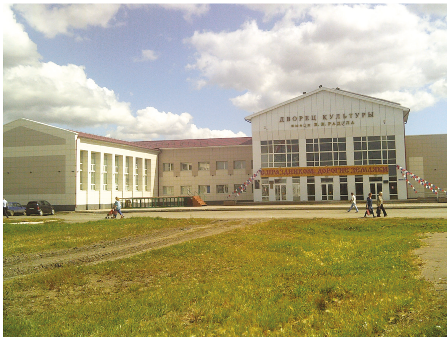
Илл. 10. Ислыкуль. Дворец культуры им. В.В. Радула, 2018 г.

В период уборки урожая начиналась особая активизация деятельности культпросветучреждений: так в 1967 году, по данным газеты «Знамя», было проведено 320 лекций, 32 тематических вечера, действовало 114 кружков художественной самодеятельности, было поставлено 33 концерта, 70 спектаклей и 90 концертов народного театра, была организована выставка самодеятельных художников.