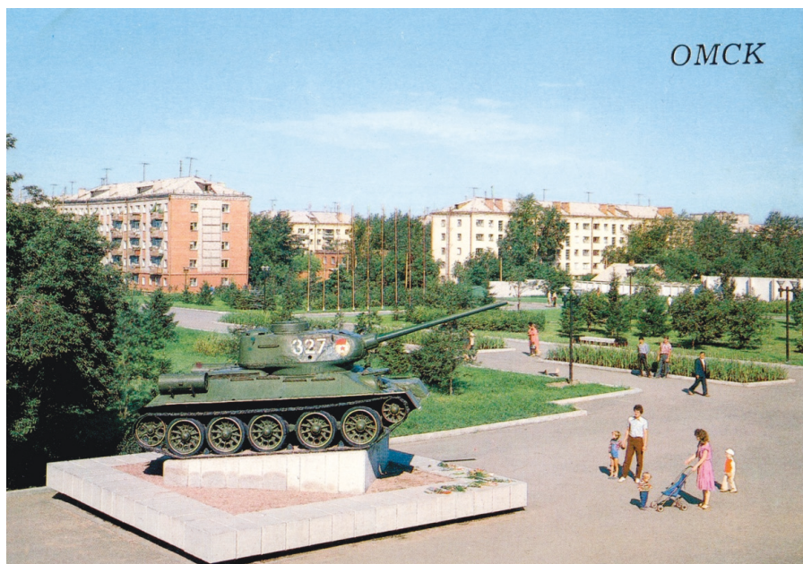
Илл. 12. Бульвар Победы. Мемориал «Слава Героям», танк Т 34-85.

ландшафта – мостов. Все они получили символически и идеологически выверенные наименования. Мост через реку Омь в створе улицы Ленина, законченный строительством к 50-й годовщине Великой Октябрьской социалистической революции получил наименование «Юбилейный», мост через реку Омь в створе ул. Гагарина и проспекта Маркса стал «Комсомольским». Мост через реку Омь в створе ул. Б. Хмельницкого и 2-й Восточной был назван «Октябрьским» (хотя в просторечье именовался «Горбатым»). Мост через реку Иртыш в створе ул. Масленникова – Ленинградской площади получил имя «Ленинградского» 24 .