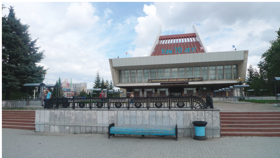
Илл. 13. Музыкальный театр, 2018 г.

в Советском районе – 1980 г. и др., 6 кинотеатров на 2,5 тыс. мест, музыкальный театр на 1200 мест (открылся в начале театрального сезона 1982 г.), зал органной и камерной музыки (первый концерт состоялся в декабре 1983 г.) 37 .