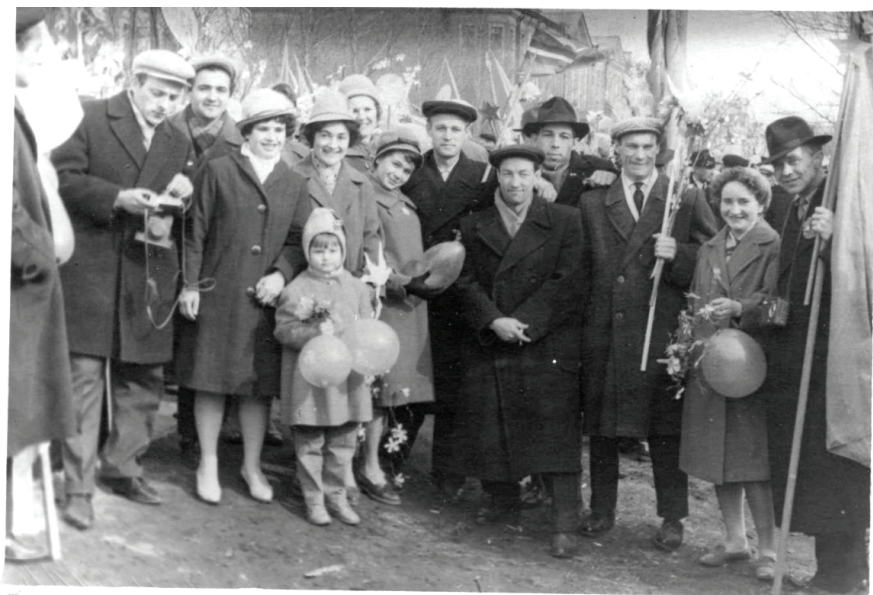
Илл. 4. Первомайская демонстрация. Омск, конец 1960-х гг.

раздавали тюльпаны жителям городка, поздравляя их с Первомаем. Вечером на крыльце главного корпуса НГУ выступали представители руководства университета и устраивался большой праздничный концерт при огромном стечении студентов и всех жителей Академгородка. Звучали песни на разных языках, студенты скандировали: «Когда мы едины, мы непобедимы!». В темноте на клумбе разжигался большой костер, являвшийся символической точкой притяжения праздника. Возле него представители разных стран танцевали и общались между собой всю ночь. А утром все вместе шли на демонстрацию. Демонстрация в Академгородке проходила по Морскому проспекту от Института археологии и этнографии СО РАН до Дома ученых, где на крыльце проходил торжественный митинг и звучали песни советских композиторов.