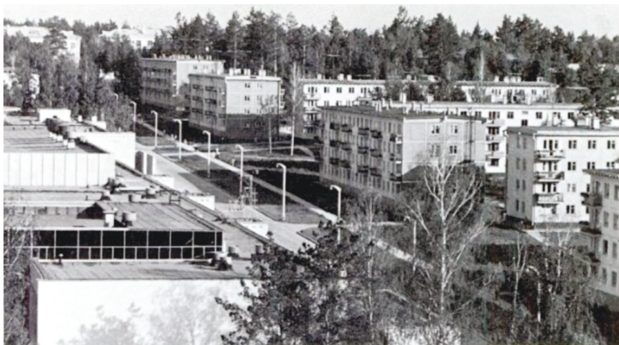
Илл. 3. Академгородок.