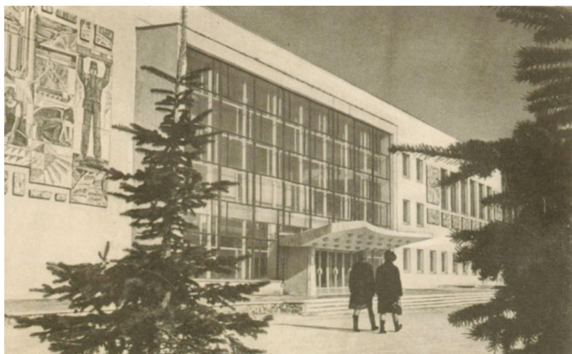
Илл. 6. Дворец культуры «Строитель».