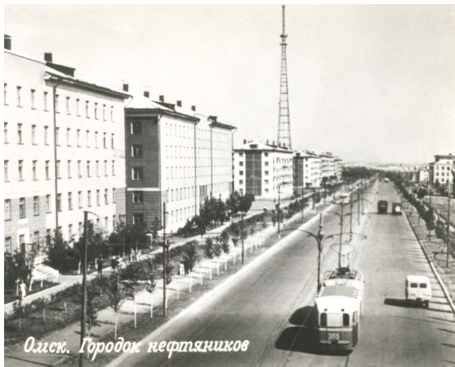
Омск. Городок нефтяников

Кордным. Телевизионный – Чередовыми и т. д. Каждый «системообразующий» завод выстраивал свою собственную инфраструктуру: жилищную, образовательную, культурную, спортивную. Так, в Парке культуры и отдыха им. 30-летия ВЛКСМ (Октябрьский район) негласное соревнование вели два наиболее мощных оборонных завода: авиационный завод и моторостроительный завод им. Баранова. Если один из них строил стадион, каток или бассейн, то второй, делал то же самое. В результате парк быстро редел, теряя свое зеленое убранство, хотя и наполнялся важными инфраструктурными сооружениями.