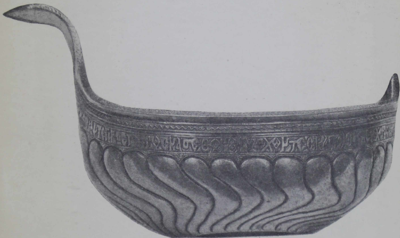
Ковшъ съ греческой надписью 1586 г.