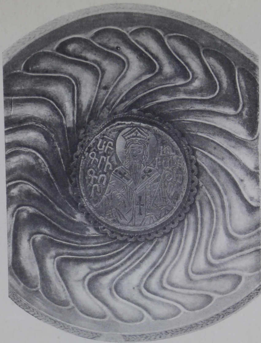
1. Дно ковша съ армянской надписью 1549 г.