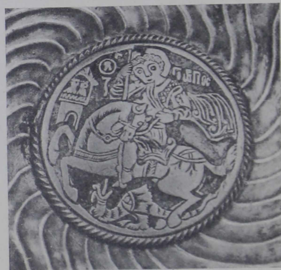
3. Дно ковша съ греческой надписью 1586 г.