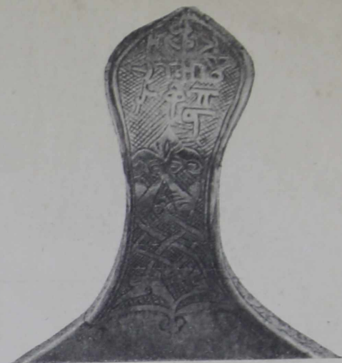
2. Ручка ковша съ греческой надписью.