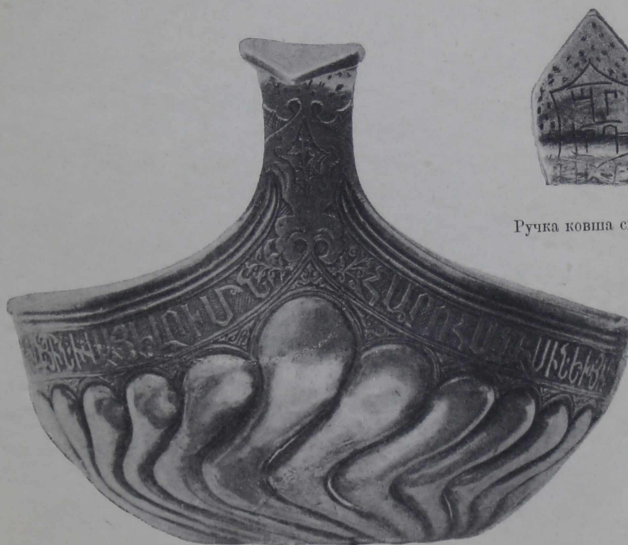
Ручка ковша снизу.