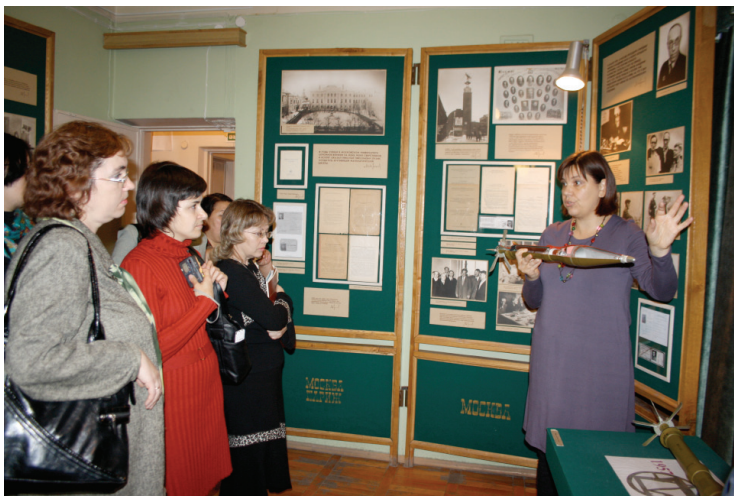
Илл. 6. Экскурсия в Музее истории СО РАН. Новосибирск, 2010 г.