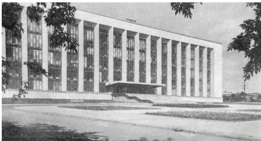
Илл. 5. ПИНТЬ СО АН СССР.