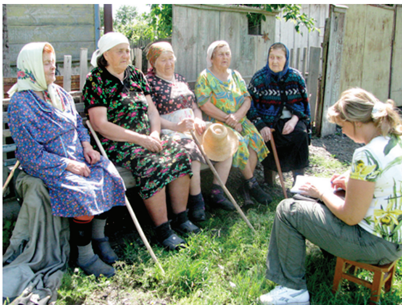
Илл. 13. Сбор полевого материала Т.Н. Золотовой. Д. Максимовка Шербакульского р-на Омской обл., 2009 г.

Конференции становились своеобразными коммуникационными площадками для учёных различных специальностей из разных городов и стран, а центром притяжения всегда являлся Омск. Это особенно ярко проявилось на примере конференции «Сибирская деревня», которая за 20 лет своего существования из локального мероприятия превратилась в заметное явление в научном сообществе не только Сибири, но и России, ближнего и дальнего зарубежья, объединив в едином научном пространстве историков, философов, культурологов, социологов, педагогов, аграриев из России, Польши, Болгарии, Германии, Украины, Казахстана, Армении, Узбекистана 3 .