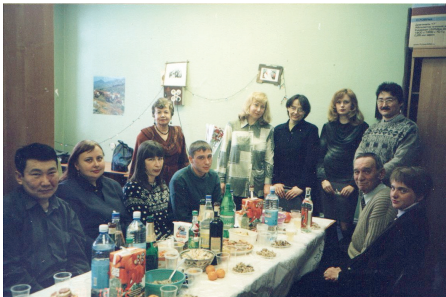
Илл. 4. Отдел этнографии ИАЭТ СО РАН, 1990-е гг.