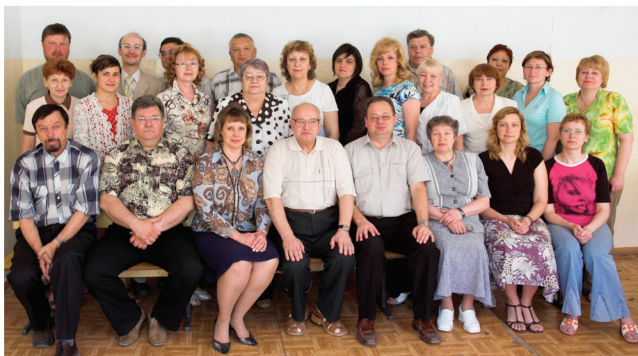
Илл. 3. Коллектив СФ РИК в год 15-летия филиала. Омск, 2008 г.

экспертиз, организация научных мероприятий, научно-издательская деятельность.