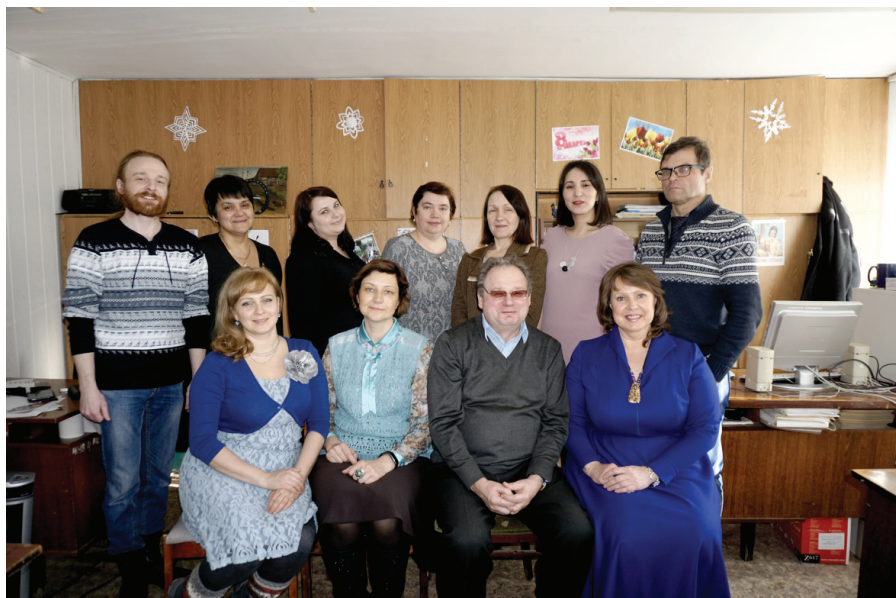
Илл. 27. Коллектив Сибирского филиала Института Наследия в год 25-летия филиала. Омск, 2018 г.