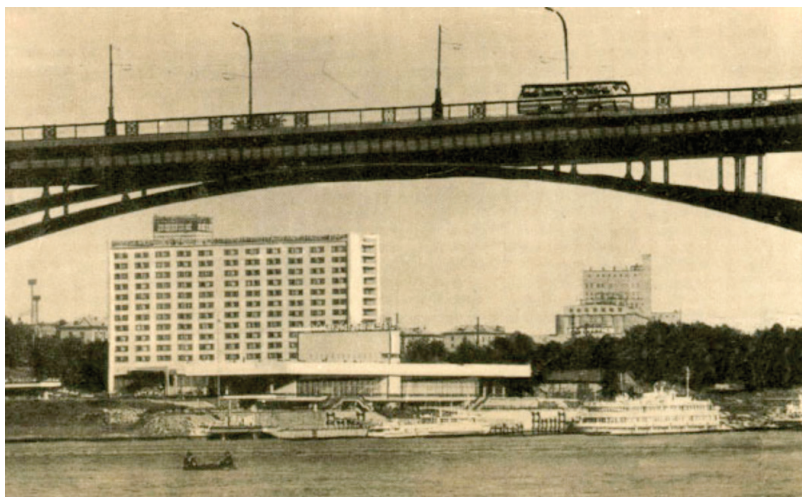
Илл. 1. Речной Вокзал и Октябрьский коммунальный мост.

Но одновременно с этим город рос, шли агломерационные процессы. Появлялись новые поселки вблизи города. Возводились жилые районы вокруг вновь созданных научных центров, промышленных предприятий, аэропортов. Это город Обь – поселок аэропорта Толмачево, поселок ОбьГЭС, наукограда Академгородок, Краснообск, Кольцово.