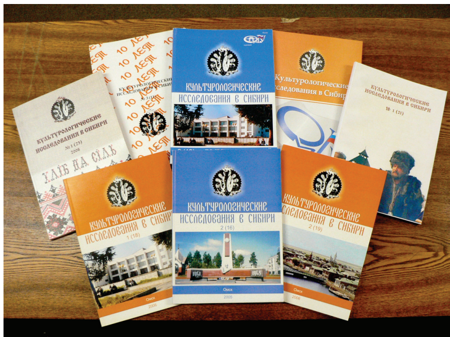
Илл. 22. Выпуски журнала «Культурологические исследования в Сибири». Омск, 2012 г.