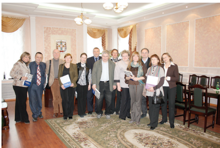
Илл. 19. Члены Совета Европы и ученые РИК в Министерстве культуры Омской области. Омск, 2012 г.