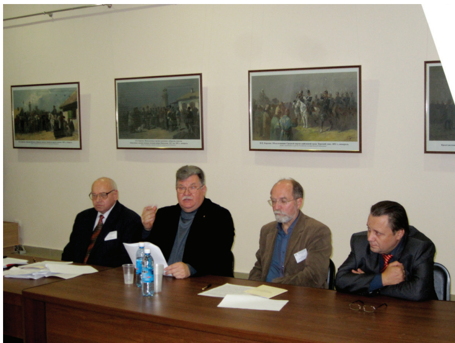
Илл. 21. На закрытии всероссийской научно-практической конференции «Ядринцевские чтения». Омск, 2012 г.