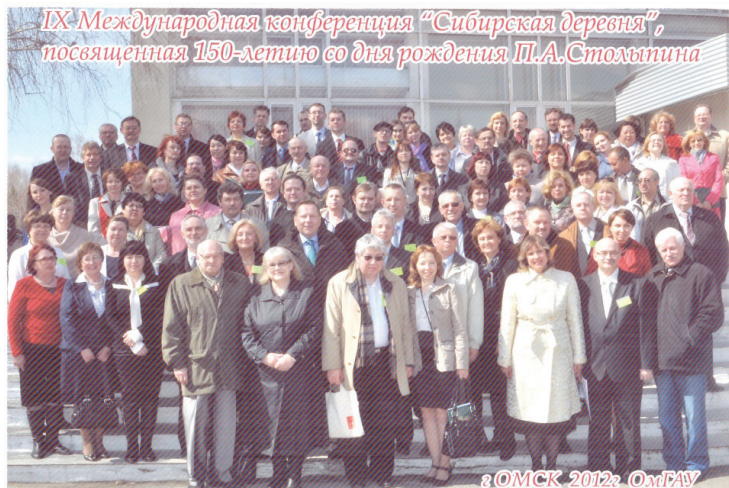
Илл. 17. Организаторы и участники IX Международной научно-практической конференции «Сибирская деревня: история, современное состояние, перспективы развития». Омск, 2012 г.