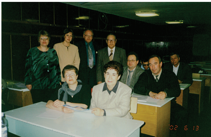
Илл. 25. Ученый совет СФ РИК. Омск, 2002 г.

Всего в 1993–2014 гг. коллектив сотрудников филиала принял участие в организации и проведении 157 научных и научно-практических конгрессов, конференций, симпозиумов и семинаров , в том числе: международных – 38, всероссийских – 86, региональных – 33. Среди организаторов, с которыми СФ РИК вместе проводил конференции, были учреждения из Новосибирска, Томска, Москвы, Санкт-Петербурга и других городов России, а также из других стран – Германии, Польши. Сотрудники филиала принимали активное участие в организации работы секций на различных конгрессах, конференциях, симпозиумах в других городах, сотрудничая с учреждениями науки, культуры, образования России, ближнего и дальнего зарубежья.