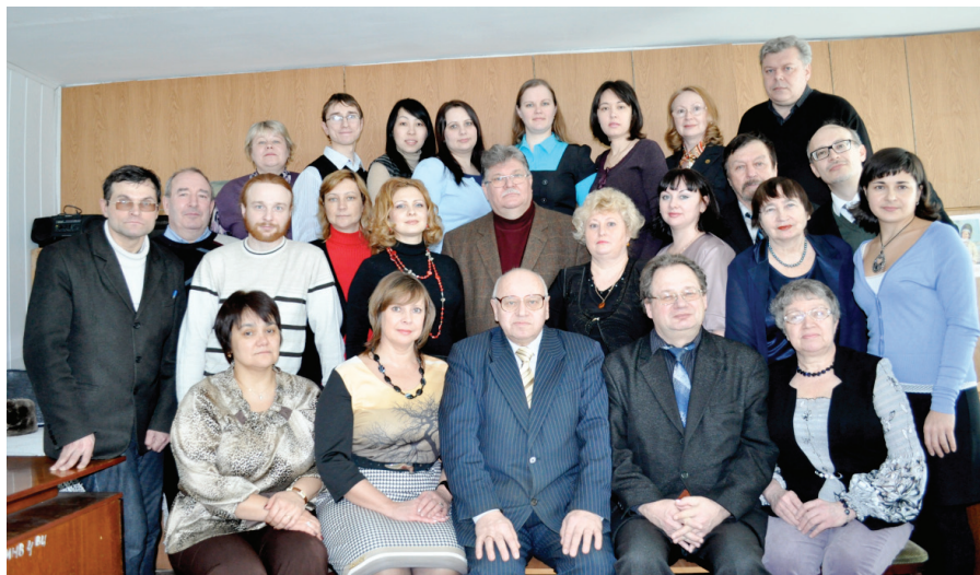
Илл. 26. Коллектив СФ РИК в год 20-летия филиала. Омск, 2013 г.

Сложные процессы оптимизации и реорганизации, происходившие в 2012–2013 гг. в ведомственных научно-исследовательских учреждениях Министерства культуры РФ, привели к тому, что Российский институт культурологии был реорганизован путем присоединения в качестве структурного подразделения к Российскому научно-исследовательскому институту культурного и природного наследия имени Д.С. Лихачёва (Приказ Министерства культуры РФ № 7 от 22.01.2014 г.). А через 3 месяца, 7 апреля 2014 г., по Институту наследия был издан приказ № 32 «О создании Сибирского филиала Института Наследия». Несмотря на формулировку «о создании» филиал и под старым, и под новым названием ни на один день не прекращал свою работу, хотя и вынужден был в связи с «оптимизацией» 2013 года сократить всех совместителей, которыми являлись доктора и кандидаты наук, профессора кафедр и директора музеев, осуществлявшие научную связь филиала с учреждениями науки, культуры и образования г. Омска.