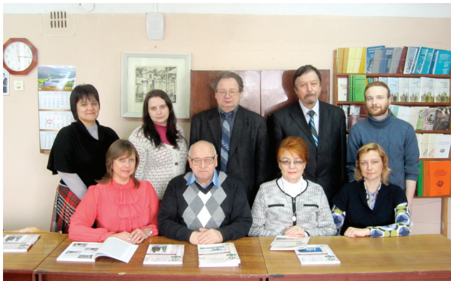
Илл. 23. Редколлегия научного журнала «Культурологические исследования в Сибири». Омск, 2013 г.

Сибирский филиал РИК вместе с Омским государственным университетом им. Ф.М. Достоевского и Омским филиалом Института археологии и этнографии Сибирского отделения Российской академии наук участвовал в издании многотомных научных серий , таких как «Интеграция археологических и этнографических исследований» (издавалась с 1994 г.), «Культура народов в этнографических собраниях российских музеев» (издавалась с 1986 г.), «Культура народов России» (1995–2002 гг.), «Этнографо-археологические комплексы: Проблемы культуры и социума» (издается с 1996 г.).