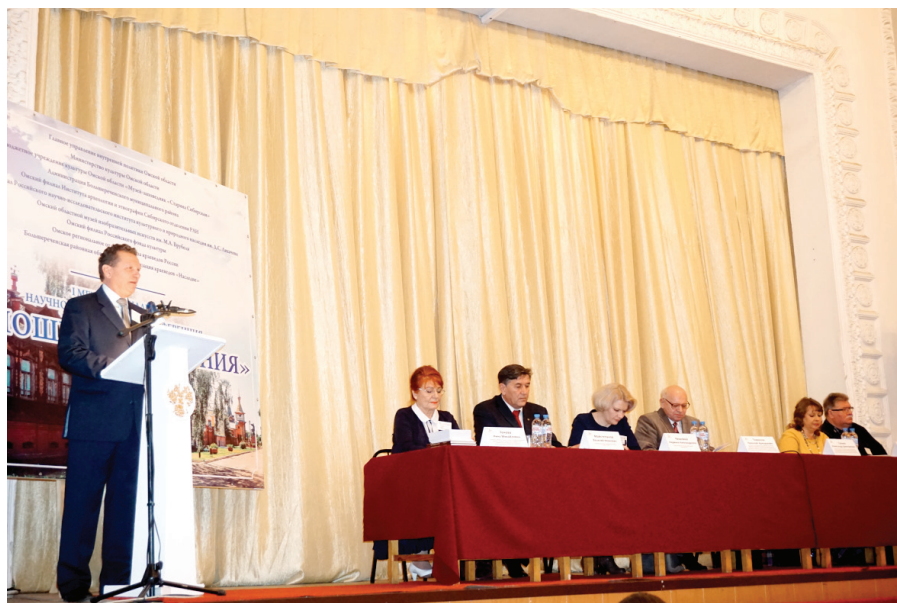
Илл. 28. На пленарном заседании научно-практической конференции «Аношинские чтения».

Сибирский филиал института Наследия продолжил традицию СФ РИК по подготовке и проведению на высоком научно-организационном уровне различных мероприятий, среди которых следует отметить научно-практические конференции и семинары «Лютеране в России: к 300-летию распространения лютеранства в Сибири» (Омск, 2014), «Ядринцевские чтения» (Омск, 2012, 2014, 2015, 2017), «Мосты мира» (Омск, 2016), «Аношинские чтения» (Большеречье, 2016), «Гражданская война в России (1917–1922 гг.): историческая память и проблемы мемориализации «красного» и «белого» движения» (Омск, 2016), «Народный костюм в Сибири» (Новосибирск, 2016).