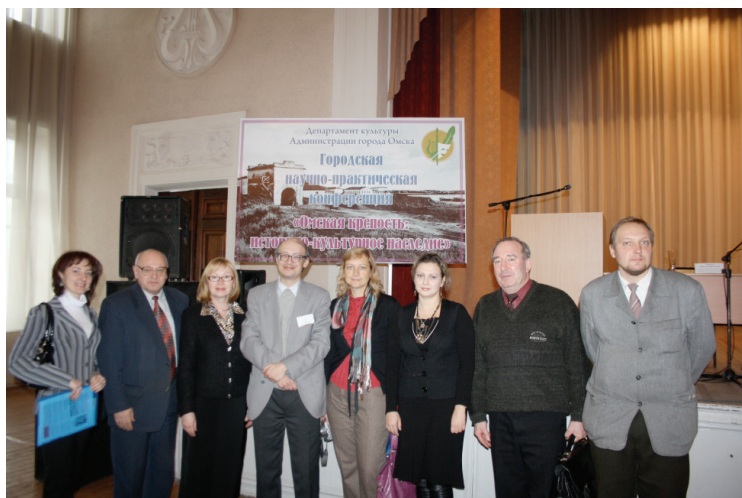
Илл. 8. Организаторы и участники научно-практической конференции «Омская крепость: историко-культурное наследие». Омск, 2010 г.