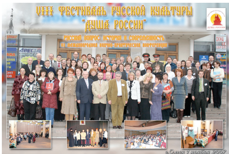
Илл. 16. Организаторы и участники VI Международной научно-практической конференции «Русский вопрос: история и современность». Омск, 2007 г.