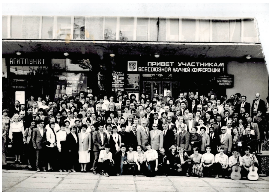
Илл. 3. Участники Всесоюзной научной конференции. Омск, 1987 г.