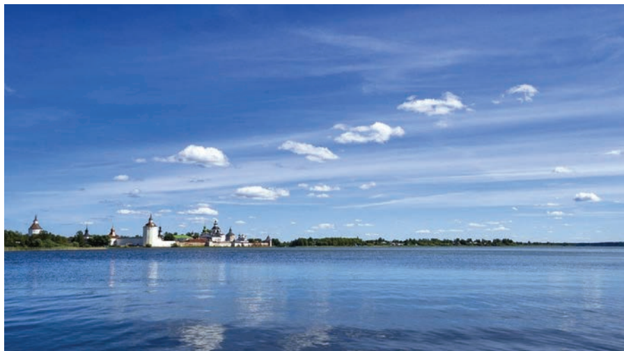
Рис. 1. Кирилло-Белозерский музей-заповедник