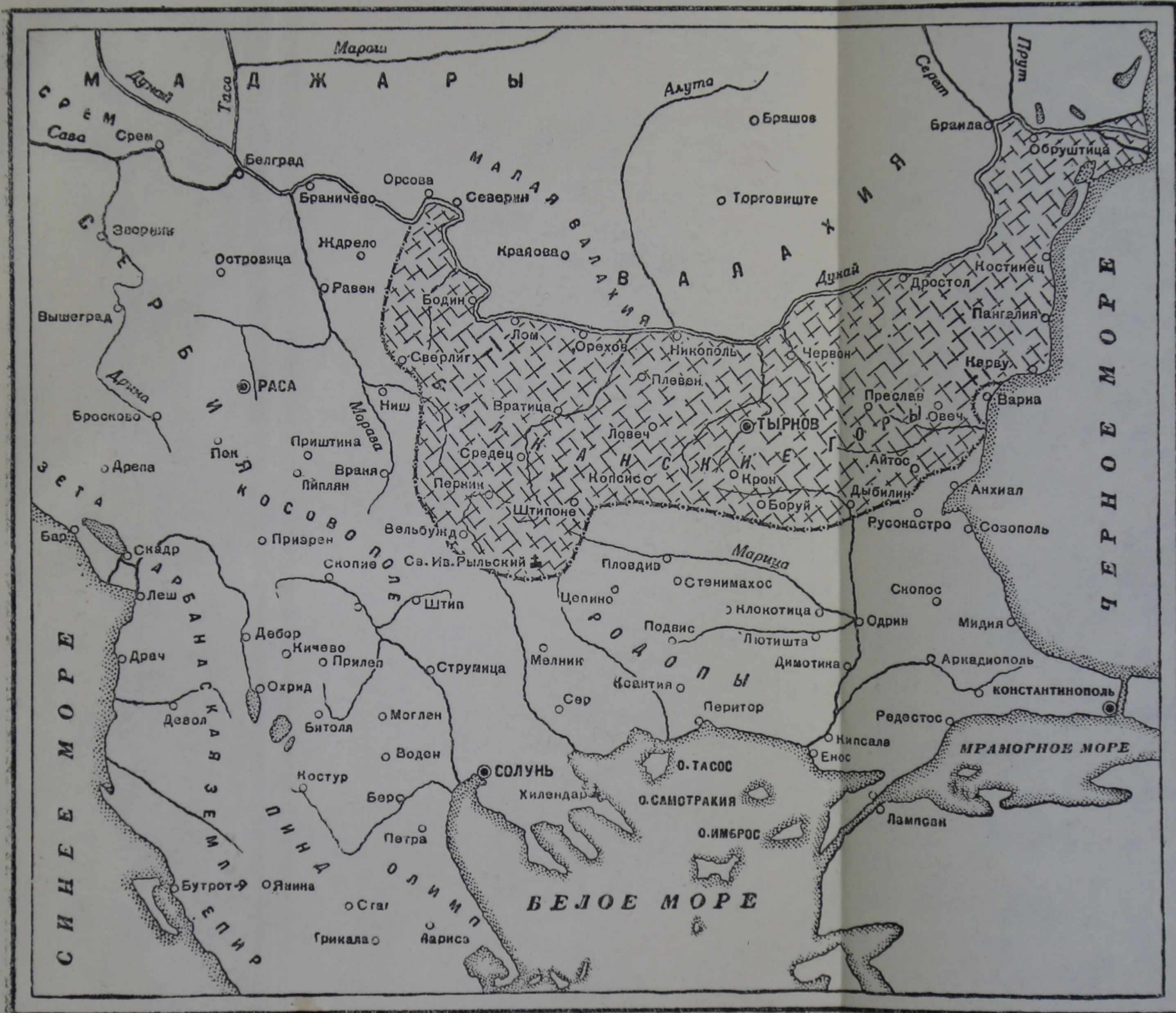
Болгария при Асене и Петре (1185—1197)