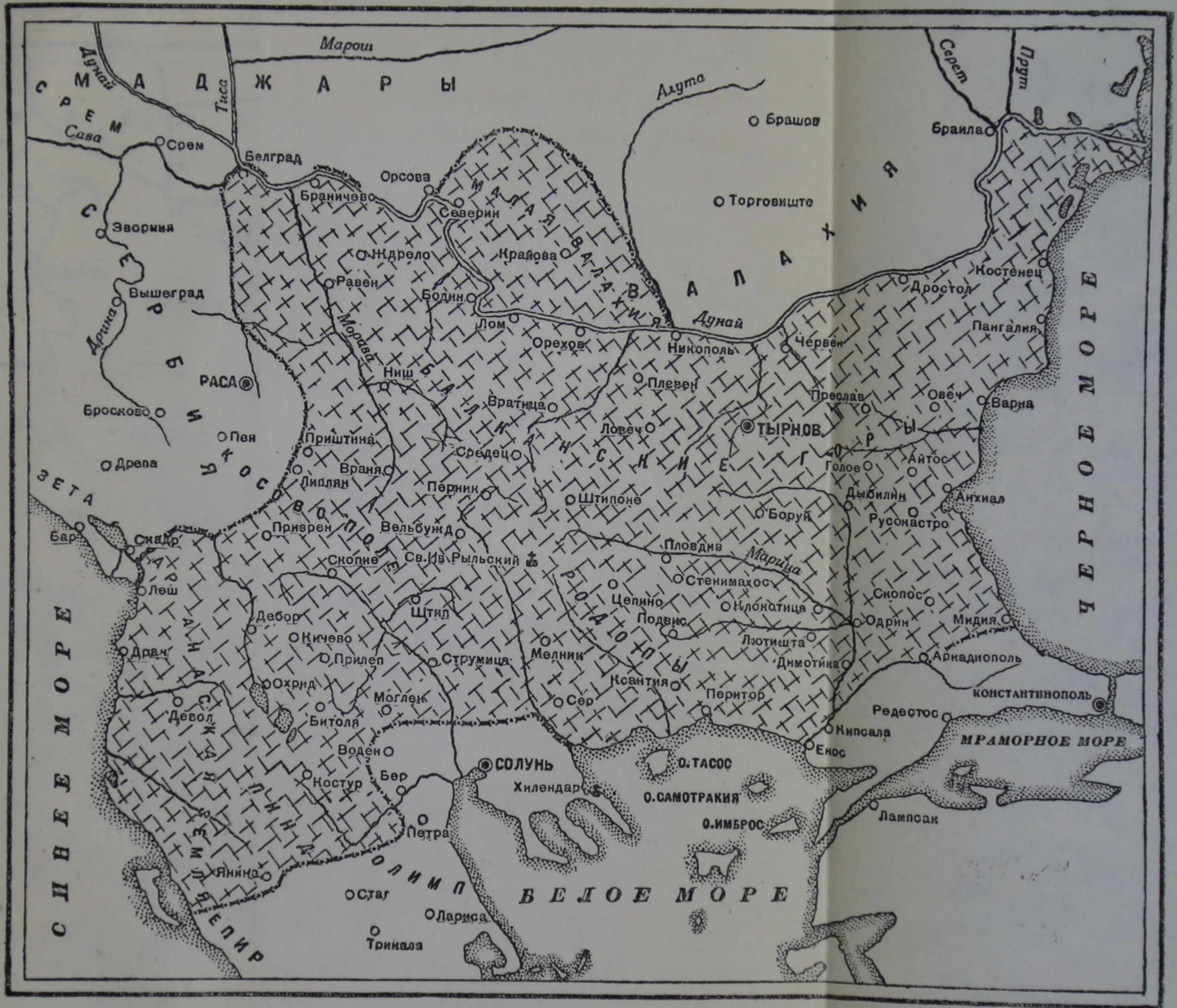
Болгария при Иване и Асене II (1218—1271)