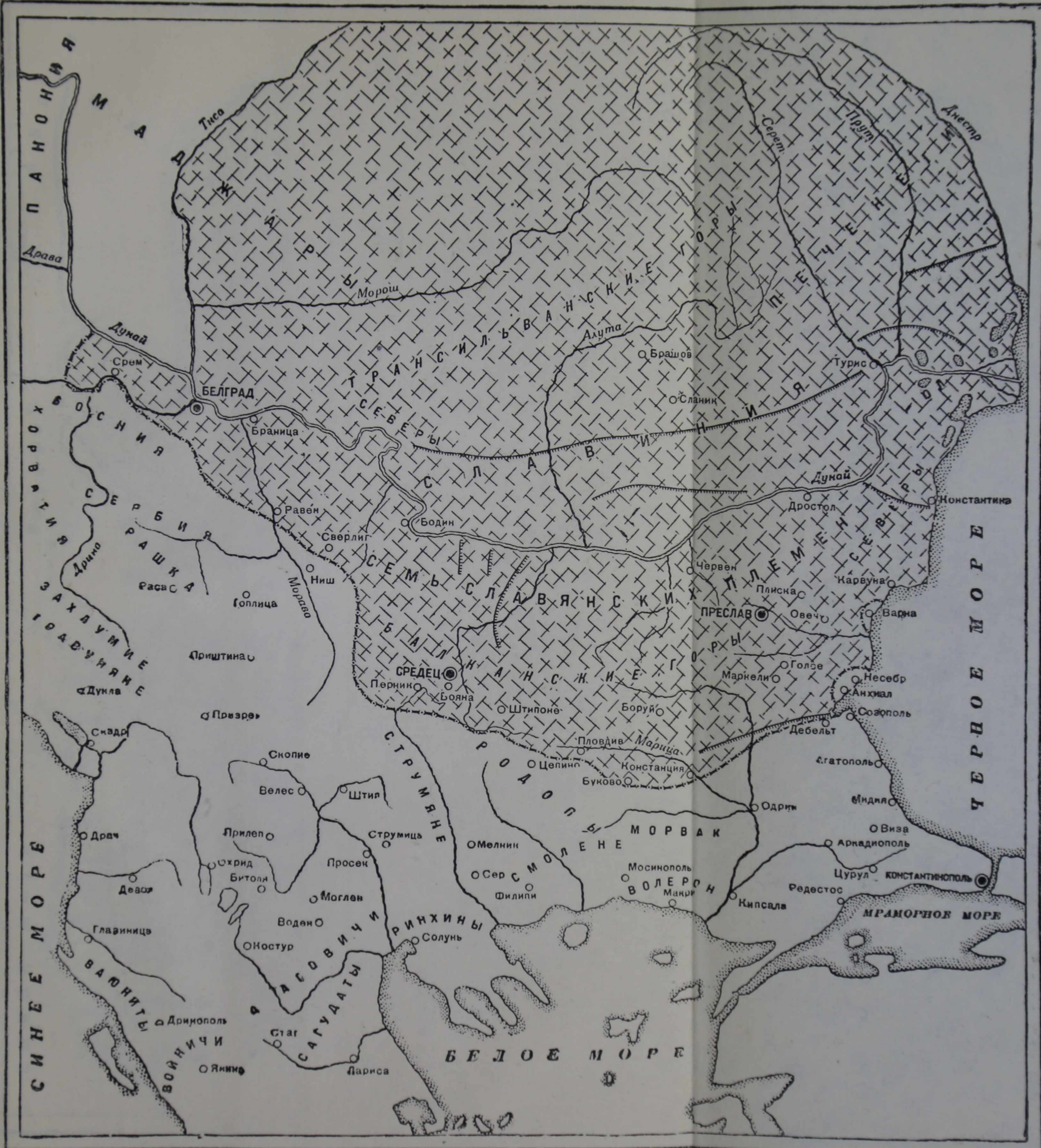
Болгария при Круме и Омортиче (начало IX века)