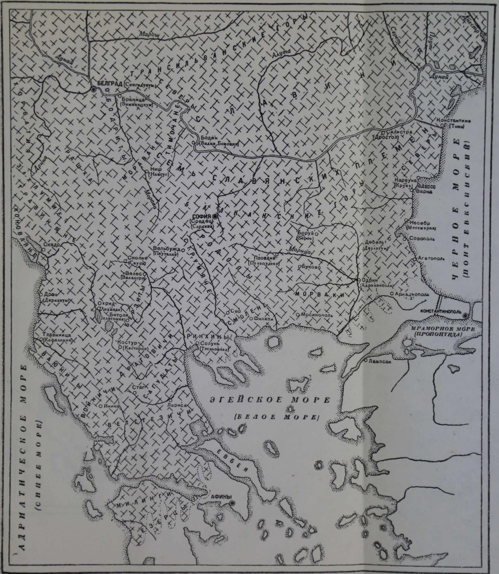
Славяне на Балканском полуострове