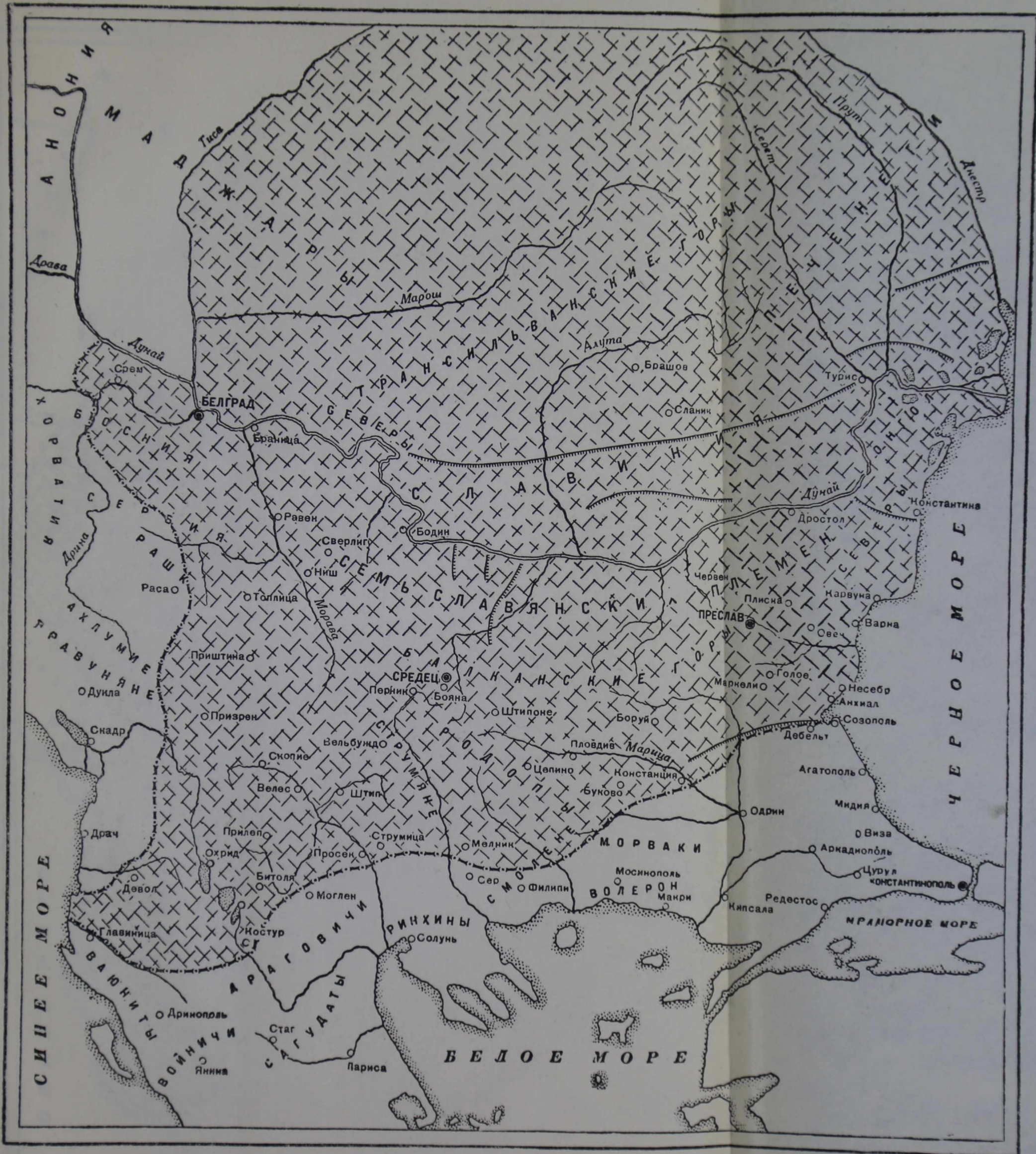
Болгария при Борисе-Михаиле (852—888)