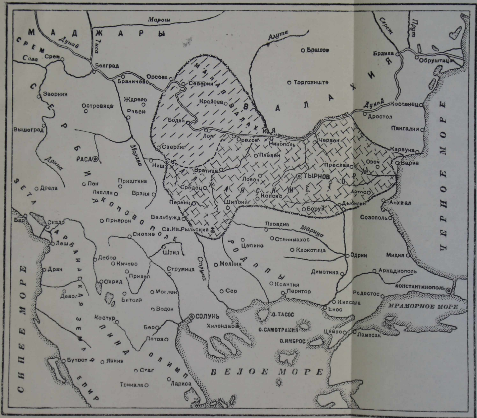
България при последних Шишмановицах