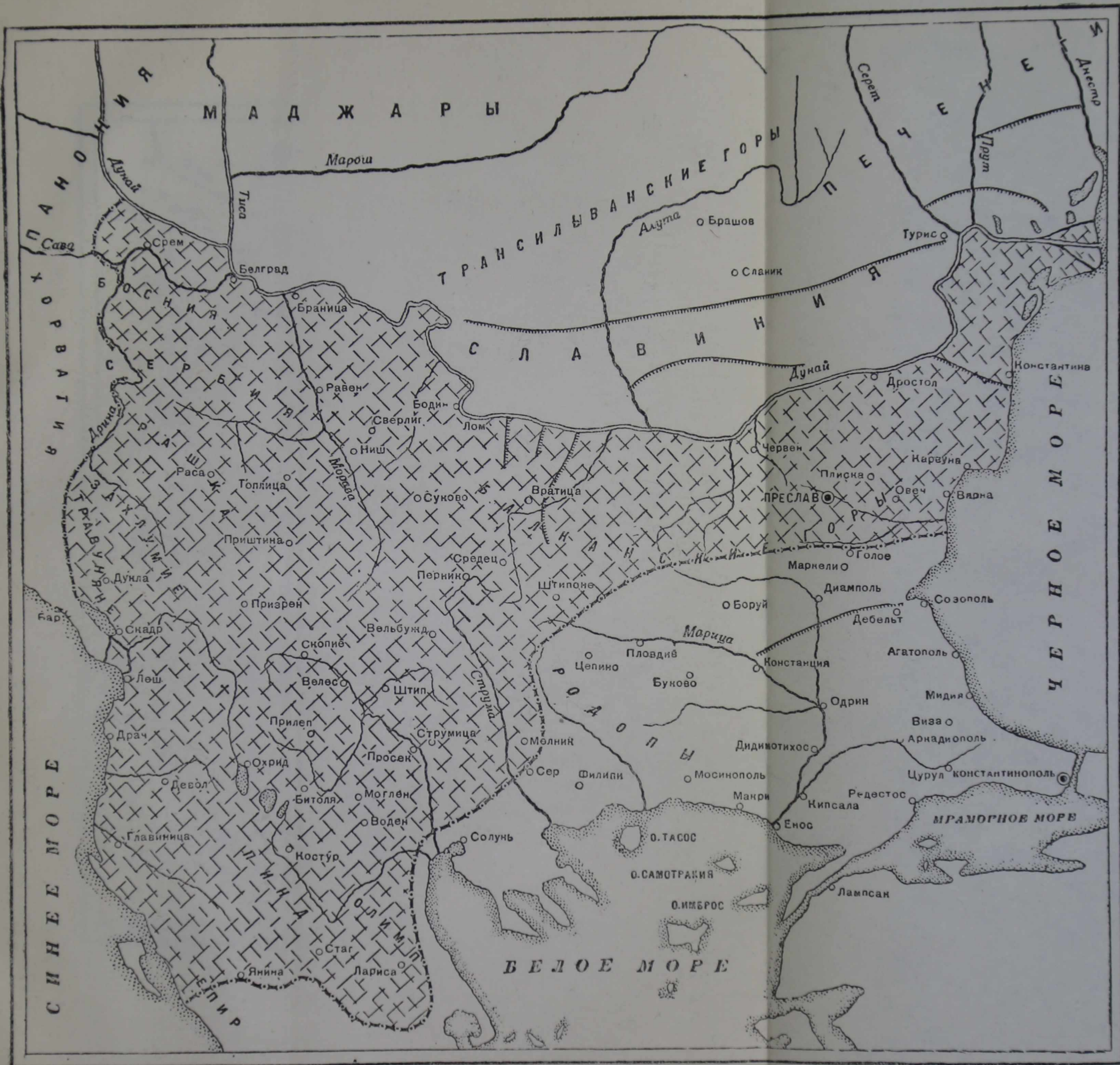
Болгария при царе Самуиле