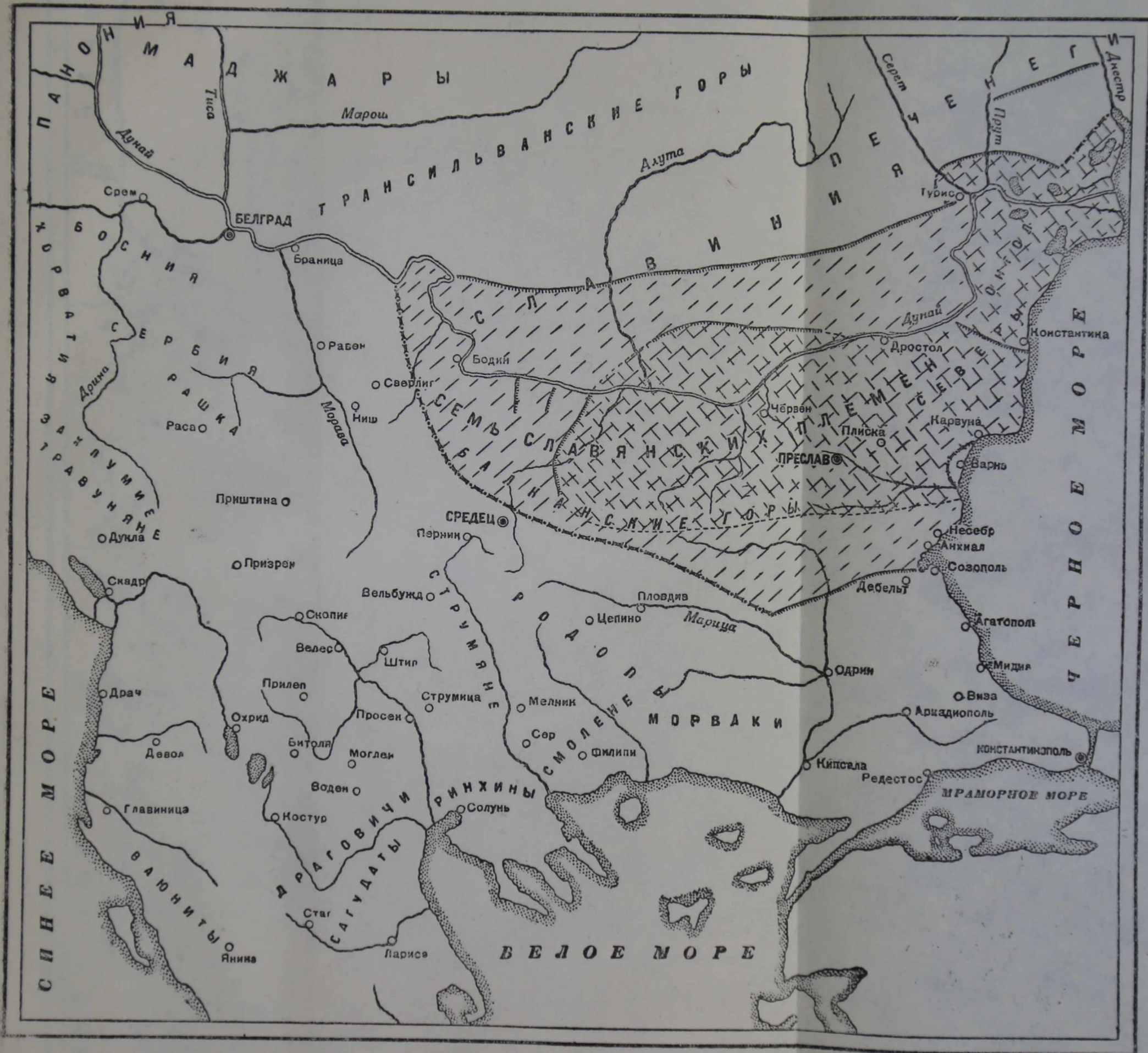
Болгария в VII—VIII вв.