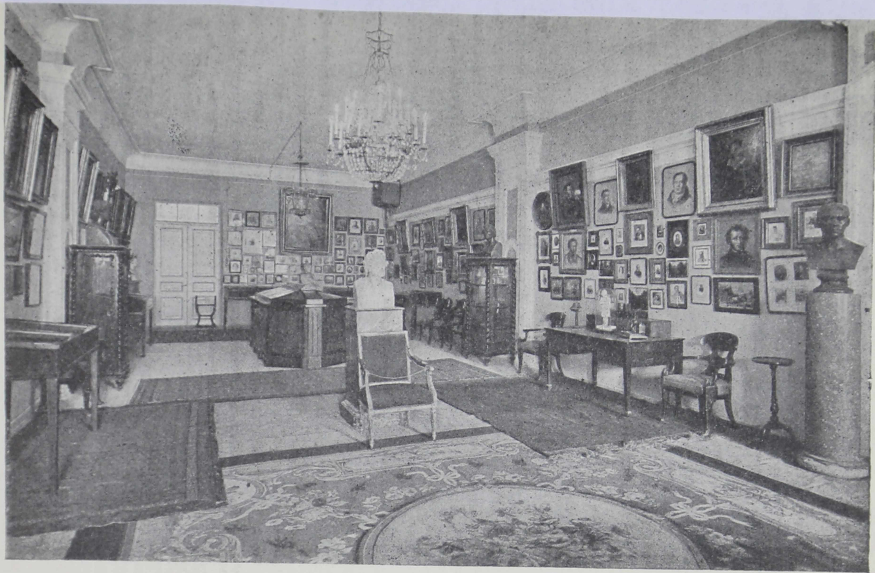
Зал 5. Пушкин и его современники.