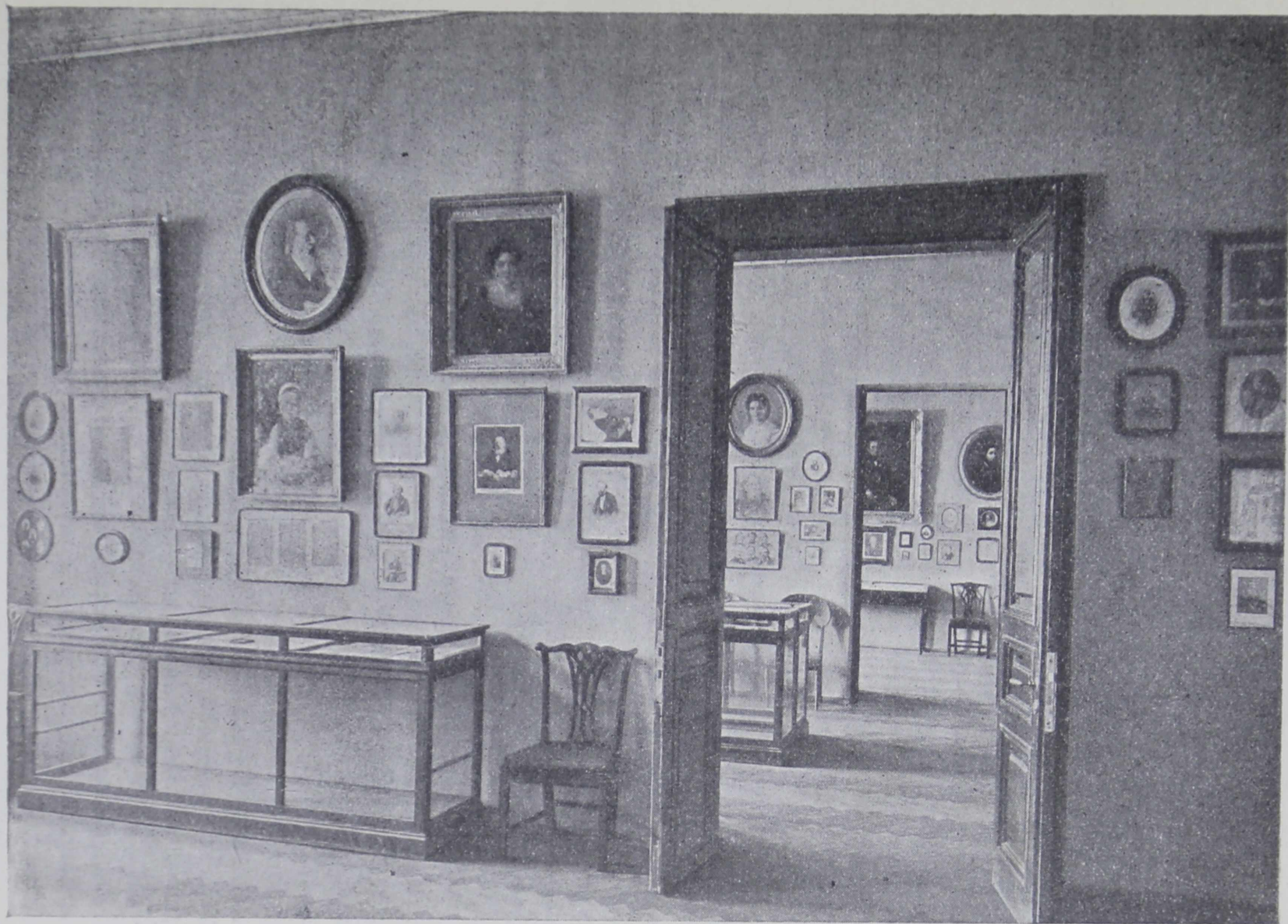
Кабинет (6). „Славянофилы“, и вид в кабинеты (4) и (5). Поэты.