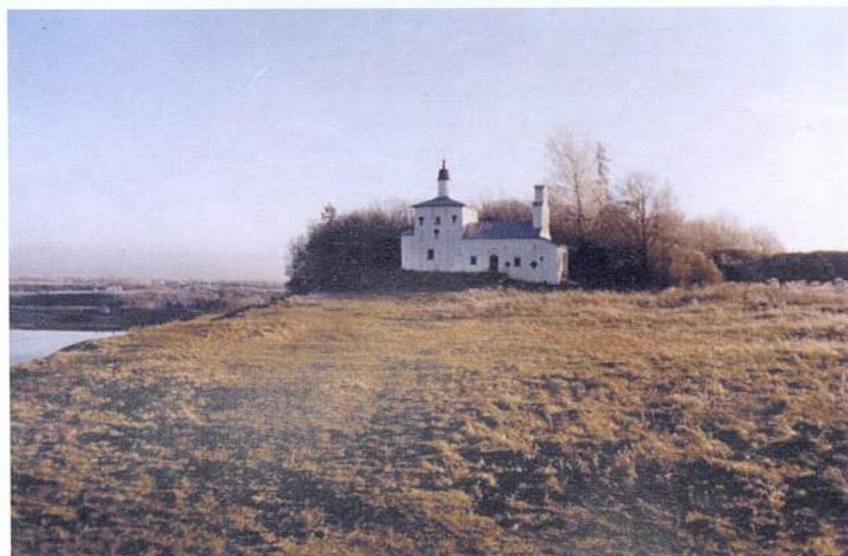
Рис. 27. Изборск. Труворово городище. Никольская церковь