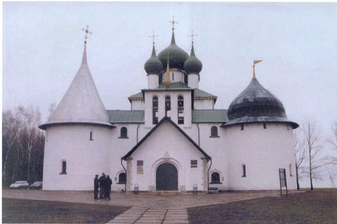
Рис. 25. Куликово поле. Красный холм. Храм Рождества Пресвятой Богородицы. Музей