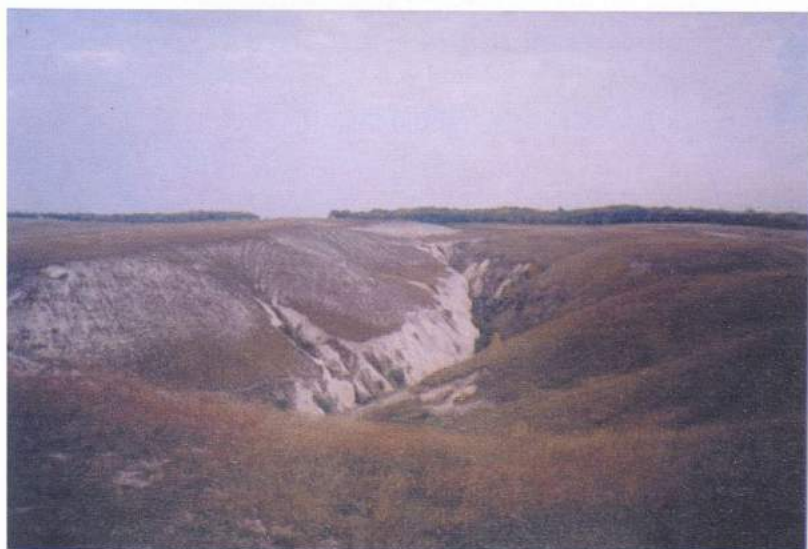
Рис. 20. Дивногорье. Дивногорский каньон и скальный могильник