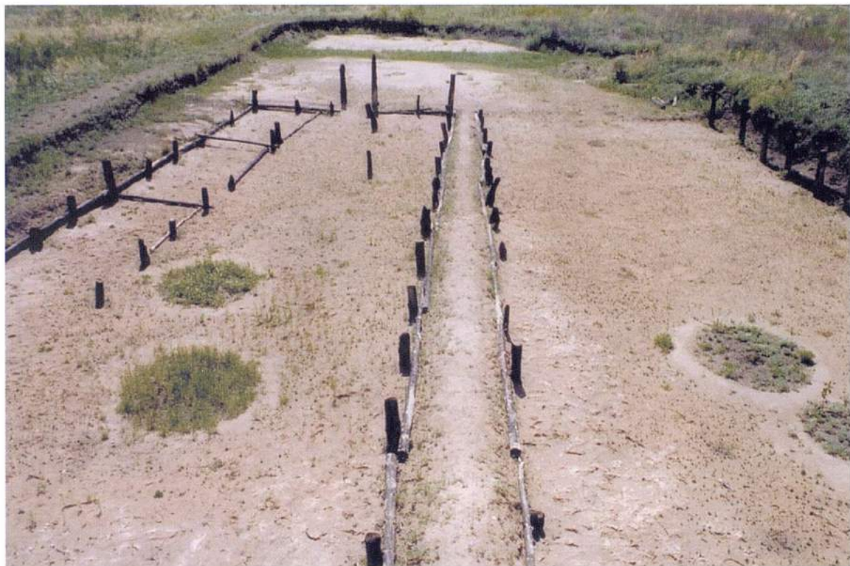
Рис. 18. Аркаим. Реконструкция раскопанного участка городища