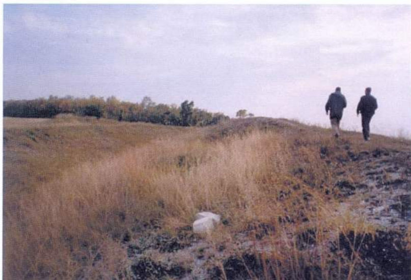
Рис. 21. Дивногорье. Маяцкое городище