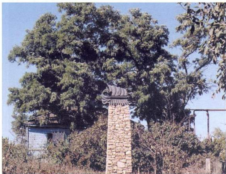
Рис. 14. Танаис. Символ музея