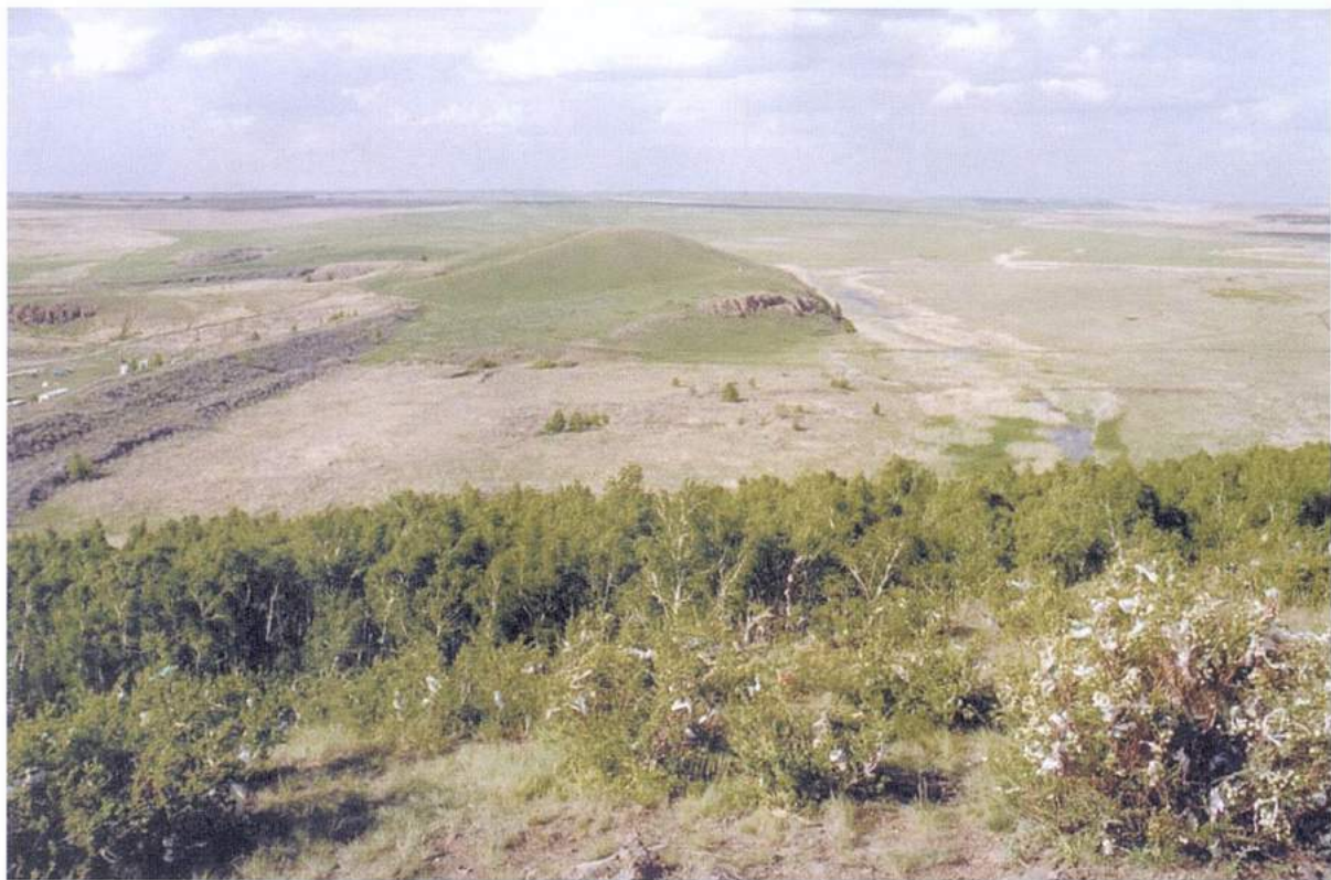
Рис. 16. Аркаим. Вид на гору Шаманку и долину Аркаима