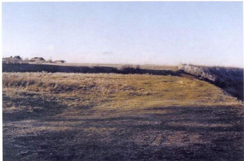
Рис. 26. Изборск. Труворово городище