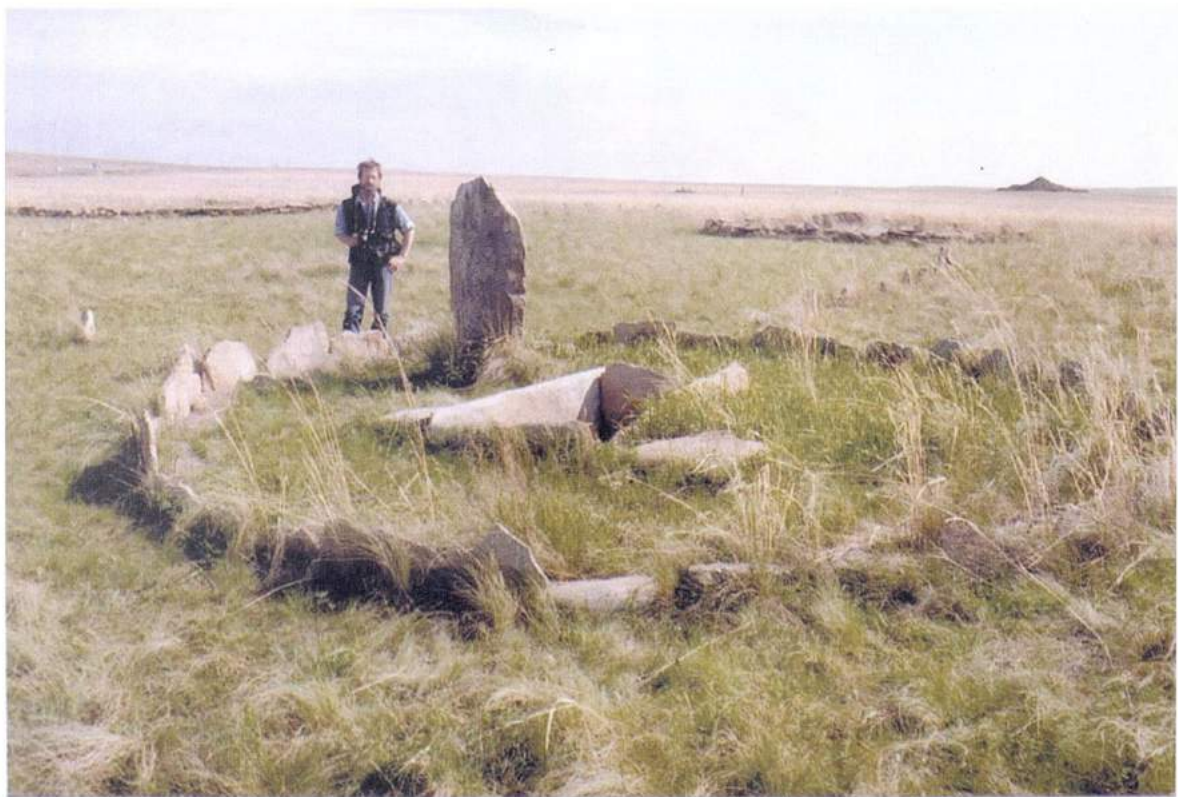
Рис. 17. Аркаим. «Археологический парк» – реконструкция менгира и кольцевой выкладки