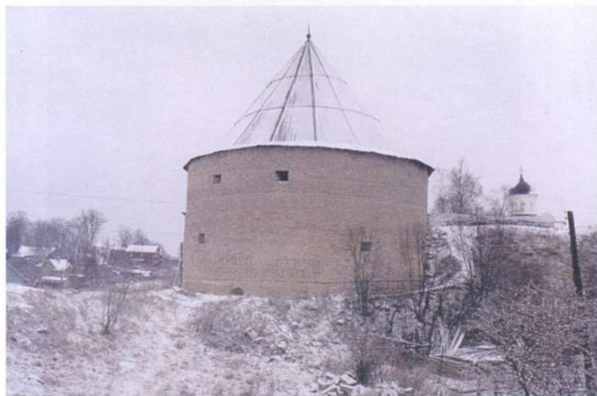
Рис. 8. Старая Ладога. Староладожская крепость