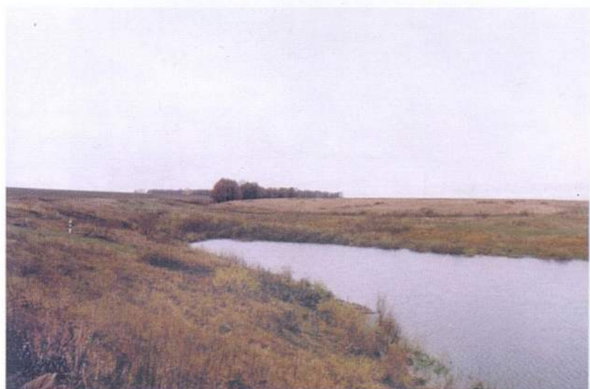
Рис. 24. Куликово поле. Место битвы