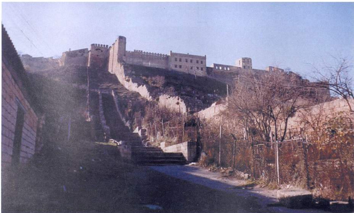
Рис. 5. Дербент. Вид на цитадель Нарын-кала и южную стену из верхней части города