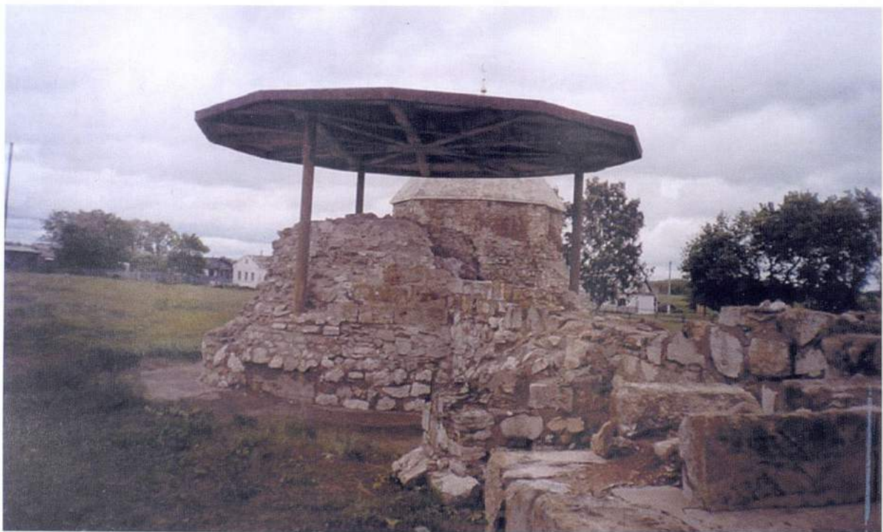
Рис. 10. Болгар. Соборная мечеть