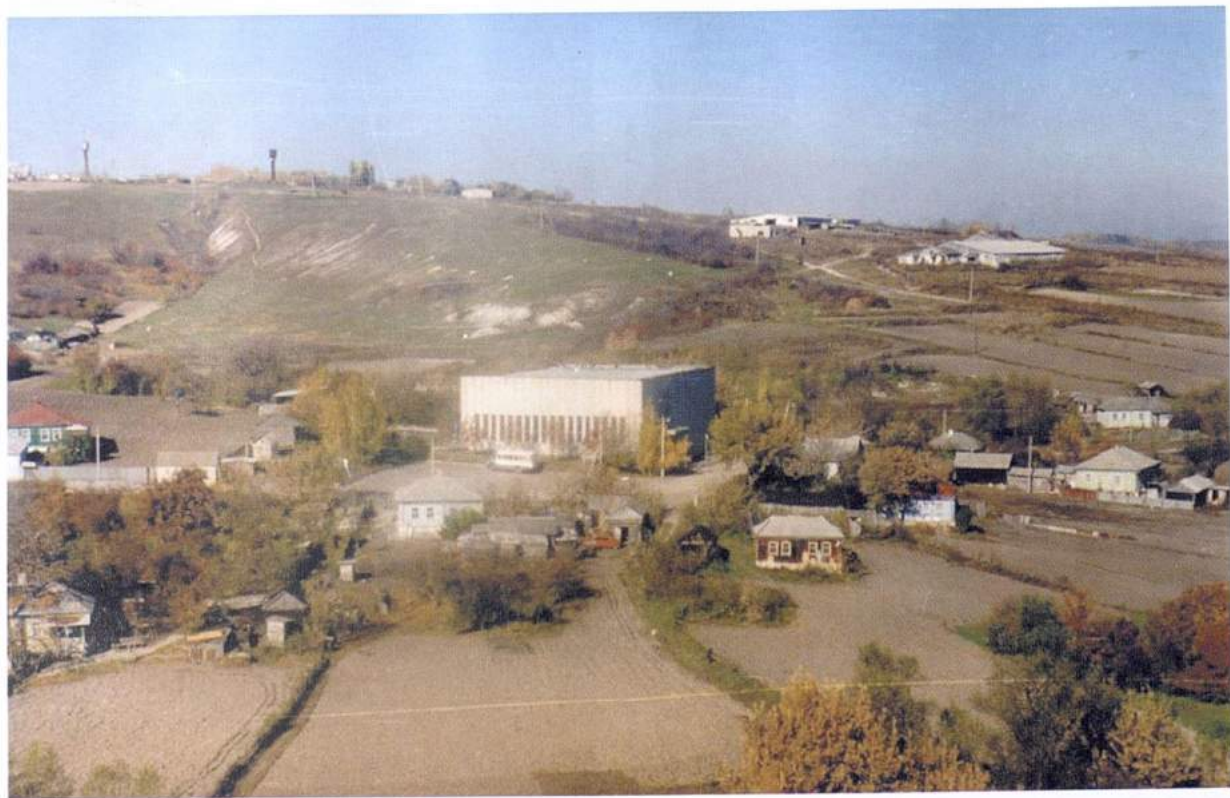
Рис. 30. Костенки. Здание музея