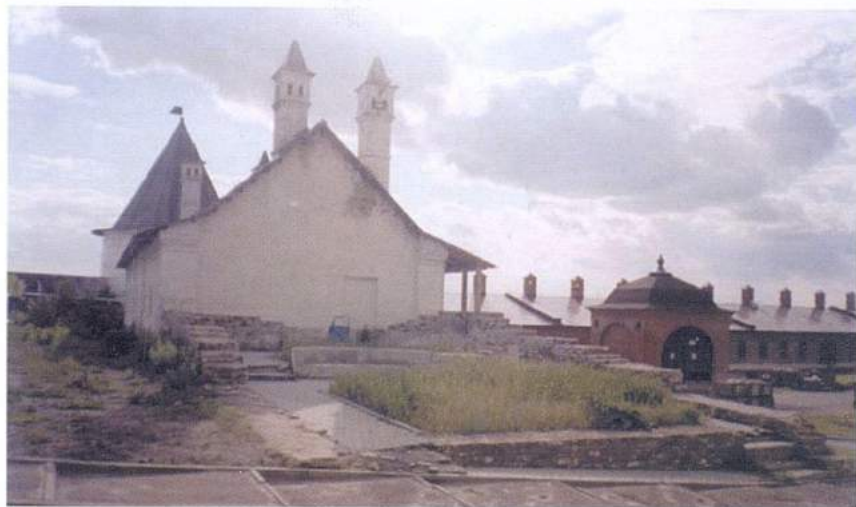
Рис. 4. Казань. Казанский кремль