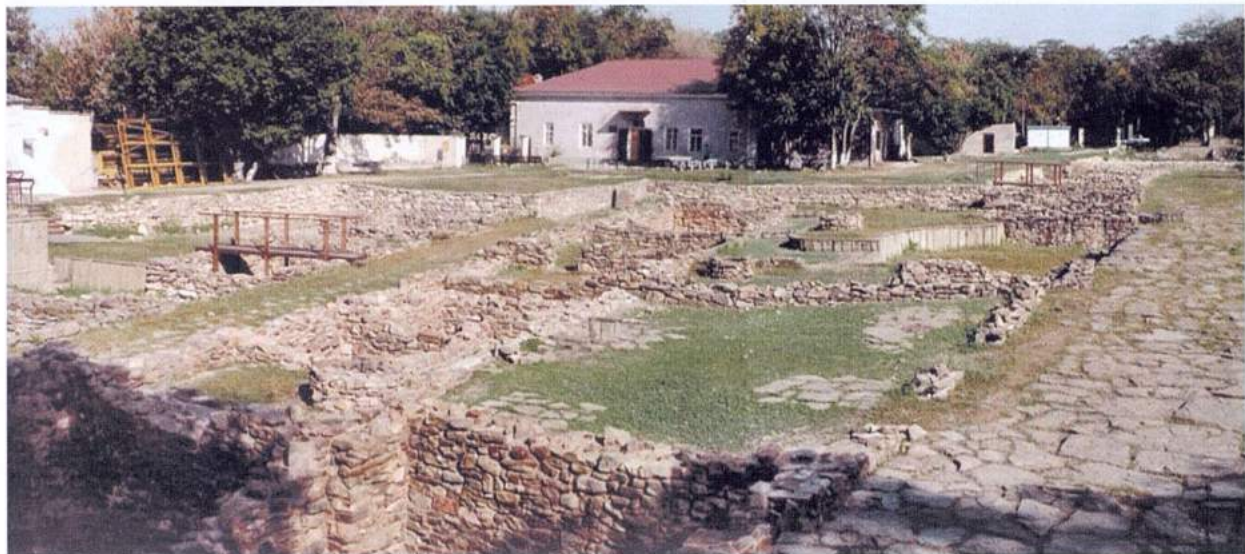
Рис. 11. Горгипшия. Центральная часть музеефицированного и реставрированного комплекса