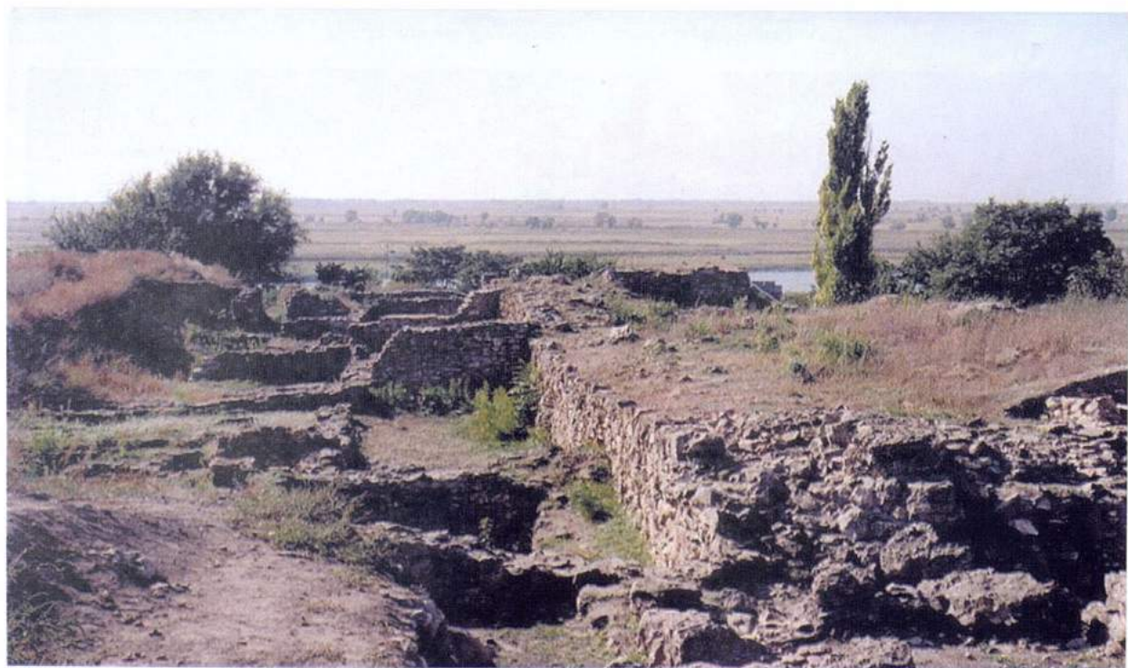
Рис. 15. Танаис. Древний город