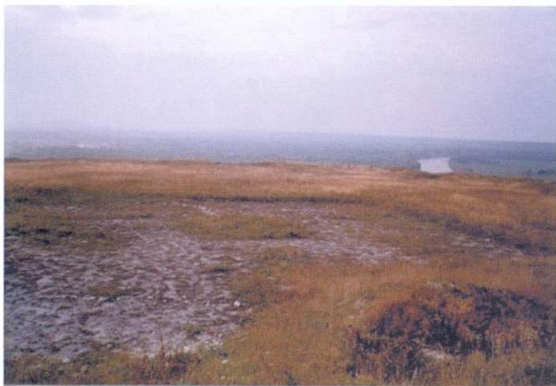
Рис. 22. Дивногорье. Маяцкое городище