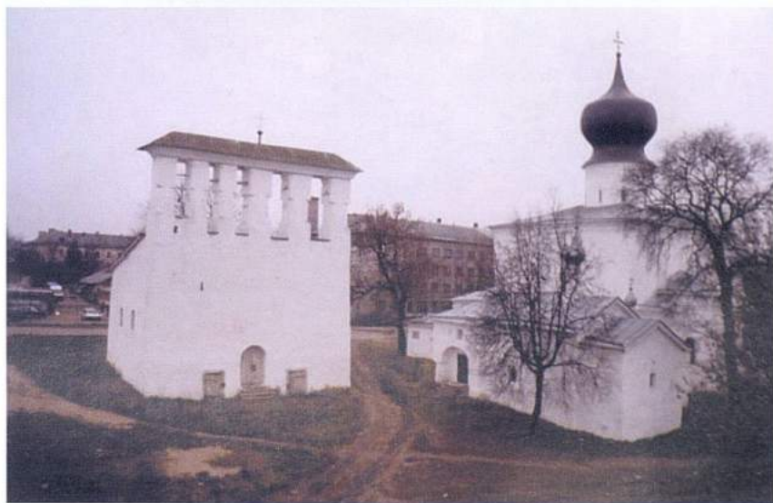
Рис. 2. Псков. Церковь Козьмы и Дамиана с Примостя