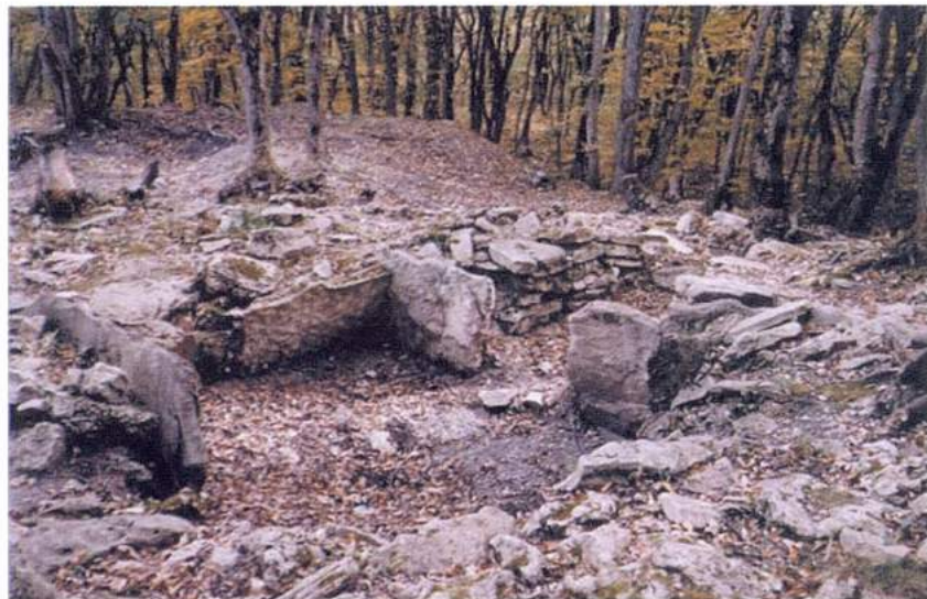
Рис. 28. Татарское городище. Склеп