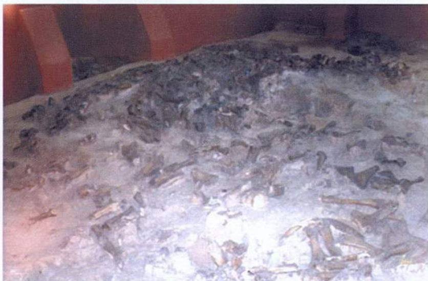
Рис. 32. Костенки. Музеефицированное палеолитическое жилище