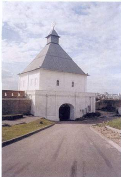
Рис. 3. Казань. Казанский кремль