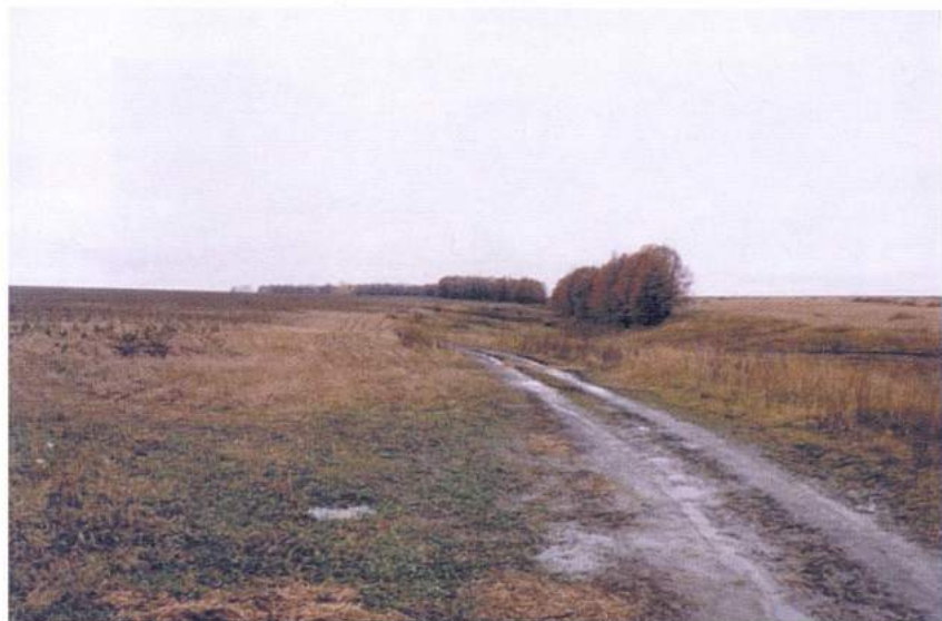
Рис. 23. Куликово поле. Место битвы, центральный объект