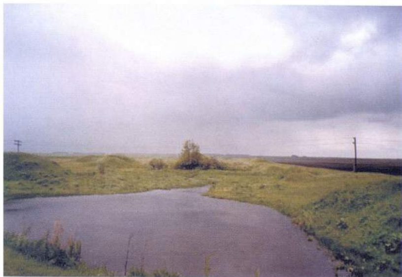
Рис. 19. Билярск. Вали Билярского городища