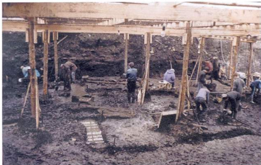
Рис. 1. Псков. Раскопки на территории посада. Мостовая XIII в.