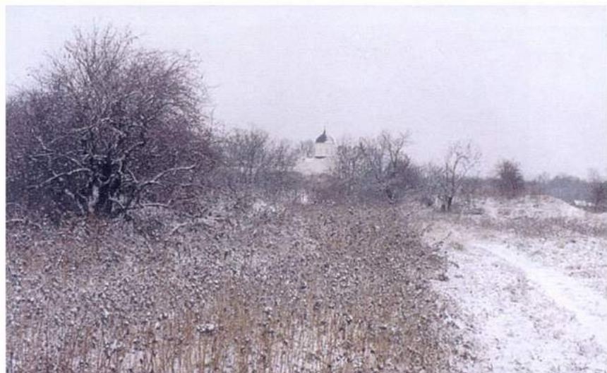
Рис. 7. Старая Ладога. Земляное городище