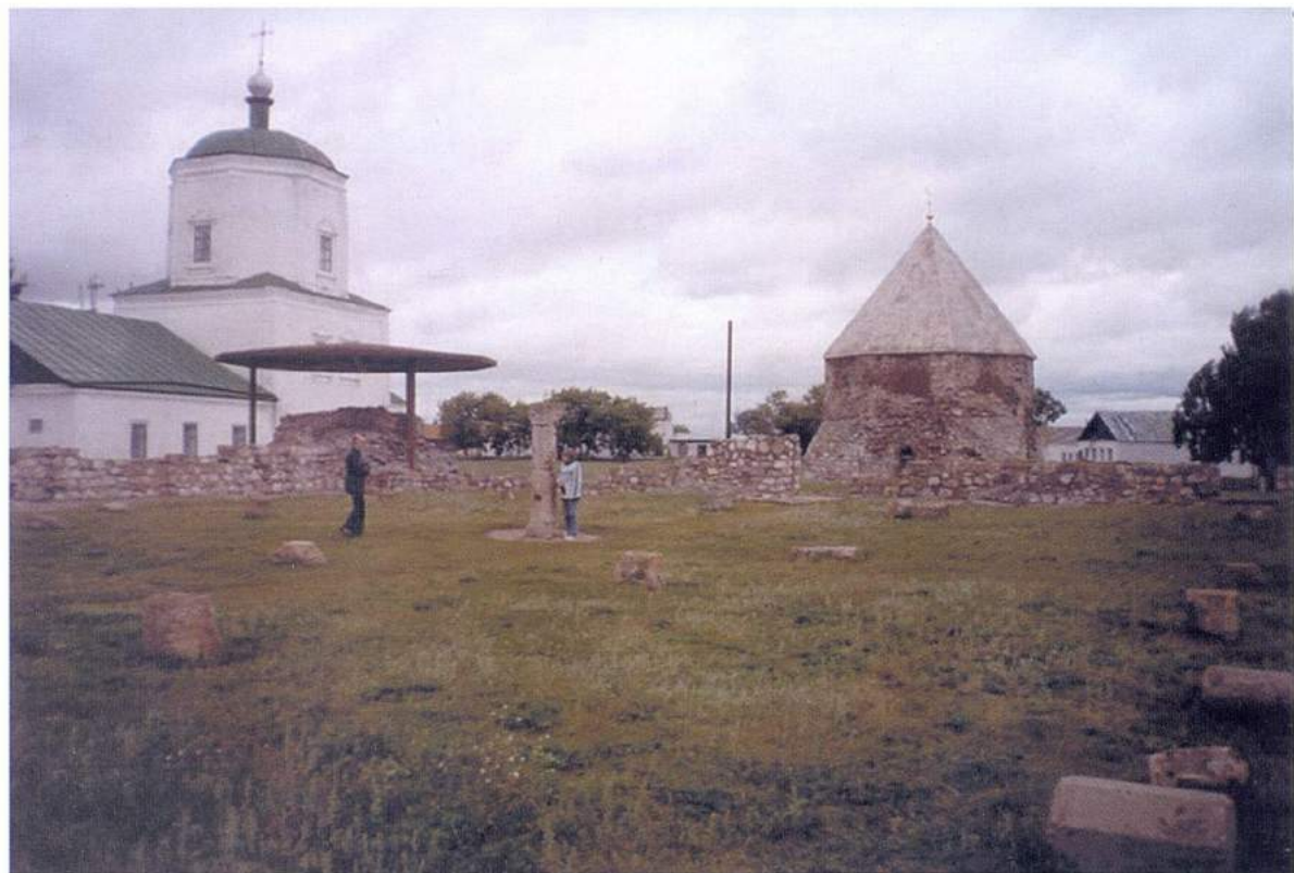
Рис. 9. Болгар. Соборная мечеть