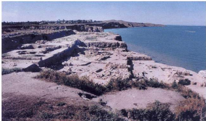
Рис. 13. Тамань. «Спираль истории» – древнерусский город Тмутаракань – хазарское городище – древнегреческий город Гермонасса