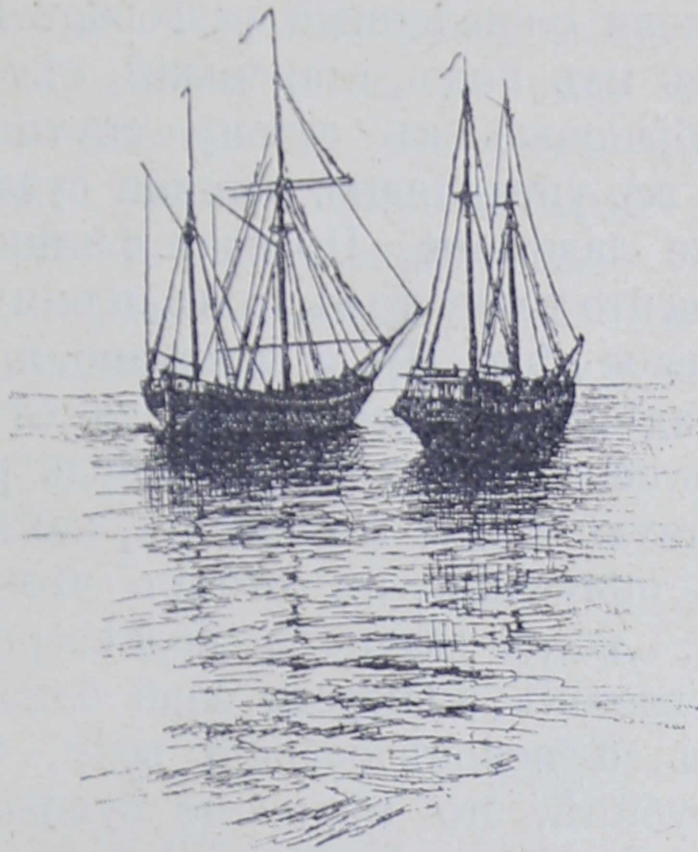
Рис. 2. Галіоты.

родцы во времена процвѣтанія Великаго Новгорода.