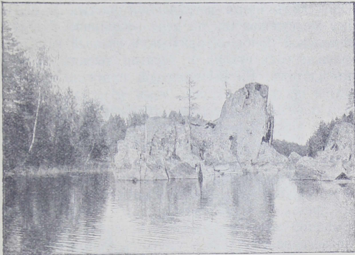
Рис. 3. Колоссальный камень въ Церковной губѣ Онежскаго озера.

Онего замерзаетъ сплошь, такъ что зимой черезъ него можно ѣхать прямо на саняхъ. Въ