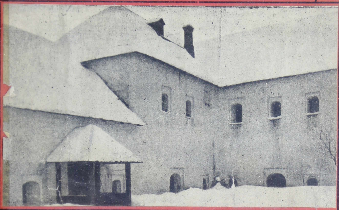
ПСКОВ, ПОГАНКИНЫ ПАЛАТЫ