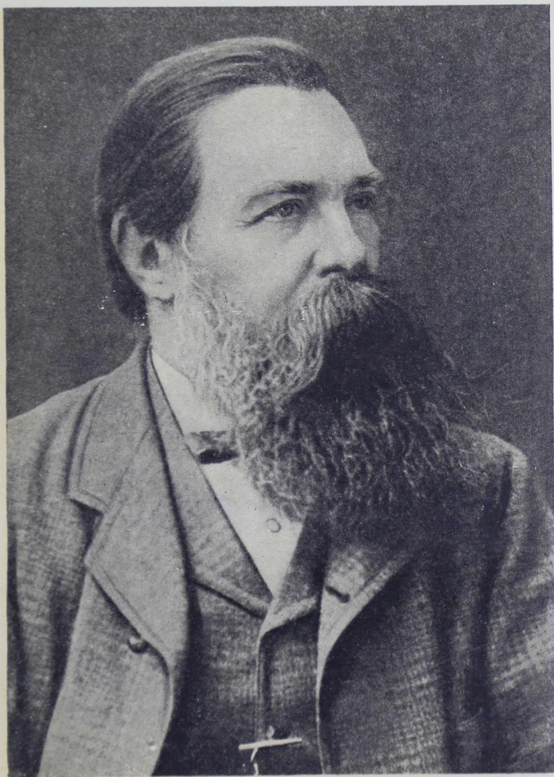
ФРИДРИХ ЭНГЕЛЬС (1879 г.)