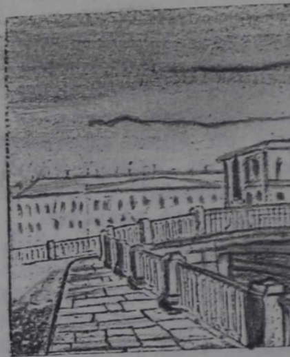
Коломна у К