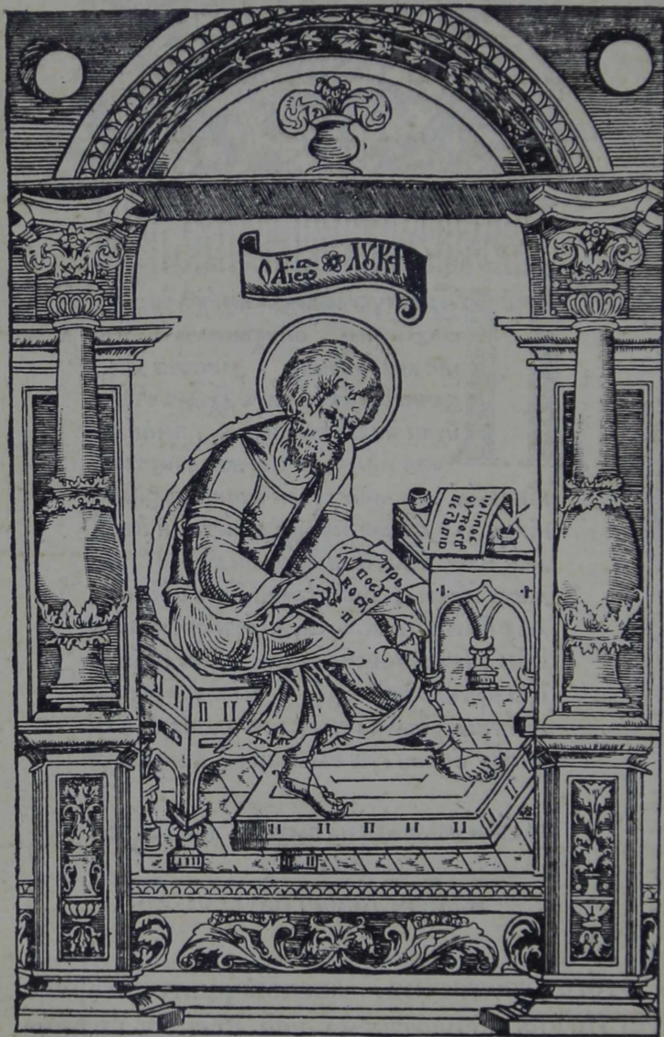
изъ апостола львовскаго изданіи, (1573-1574)

съ патриархами и лично переводилъ съ греческаго. Говорить о дѣятельности всѣмъ извѣстнаго князя Константина Острожскаго не приходится. Но то, что предпринимали отдѣльные борцы, продолжало долгіе годы Львовское ставропигійное братство: извѣстны его школа, его типографія, гдѣ работалъ печатникъ Иванъ Федоровъ, и гдѣ печатались многія сла-