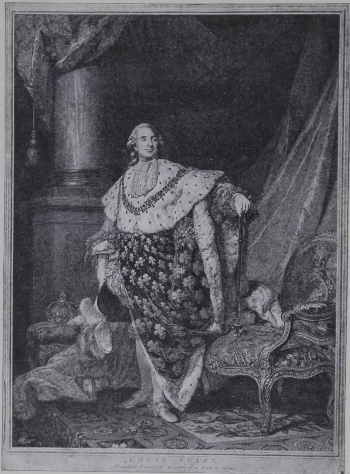
Людвикъ XVI. По картинѣ Дюплесси.

мени, ни терпѣнія прочитатъ хотя бы одну серьезную книгу. Спрашивается, могла-ли втрое сильнѣйшая сила воли и даже гораздо болѣе ясный умъ предотвратить то бѣдствіе, которое уже давно надвигалось и выказалось въ несомнѣнномъ признакѣ своемъ—въ разстройствѣ финансовъ.