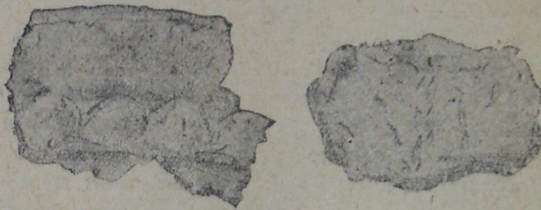
Рис. 1. Из Любавичского городища, Смол. у.

Большинство из обследованных городищ данной группы очень бедны инвентарем. В них встречаются изредка каменные орудия. Найдены они в следующих городищах: близ д. Новые-Батеки (район Гнездова)—