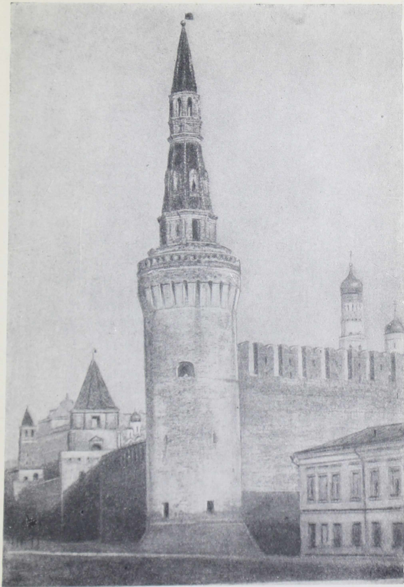
Беклемишевская башня Московского Кремля. Заложена в 1487 г. Верх — начала 80-х гг. XVII в.