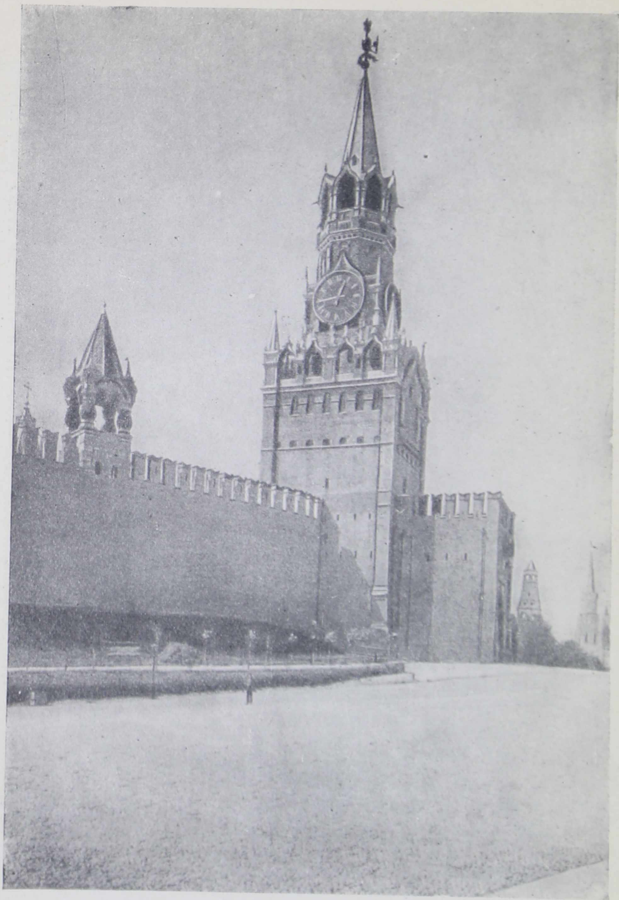
Спасская башня Московского Кремля. Поставлена в 1491 г. Верх надстроен Христофором Галловеем в 1624—1625 гг.