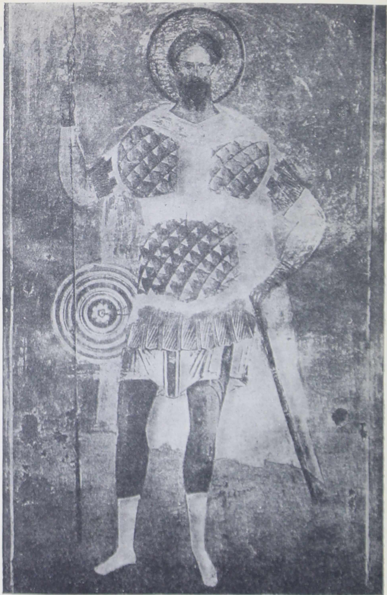
Фреска Дионисия в Феррапонтовом монастыре (1500—1502 гг.) Никита-воин