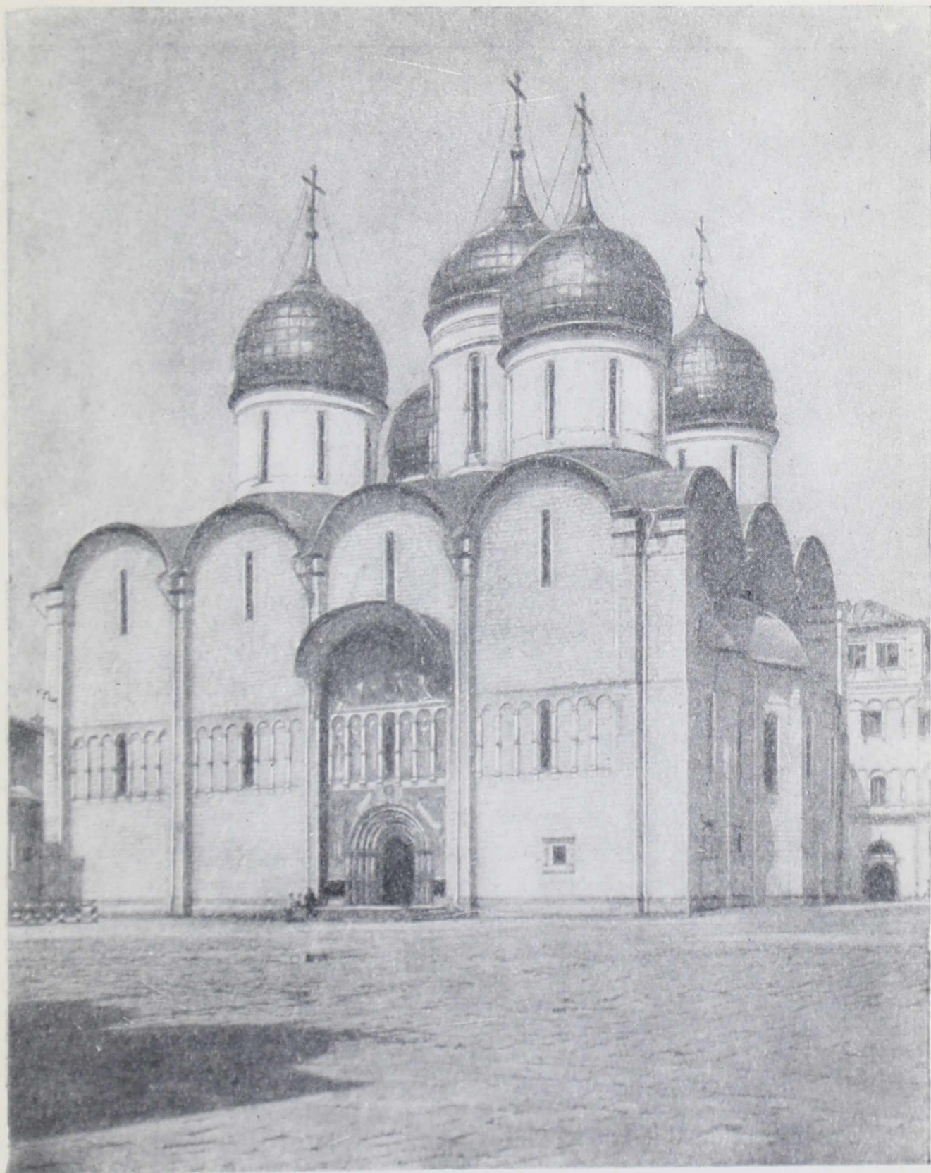
Успенский собор Московского Кремля (1475—1479 гг.)