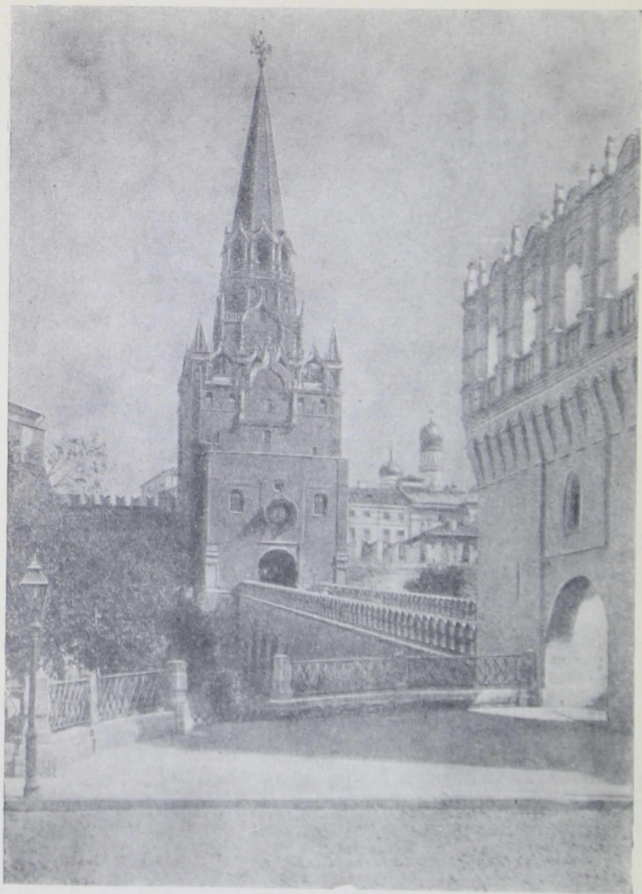
Троицкая башня Московского Кремля (90-е гг. XV в.) и отводная стрельница «Кутафья» 1516 г. (справа) Верх Троицкой башни 1685 г. Каменный мост перестраивался, но сохраняет формы 1516 г.