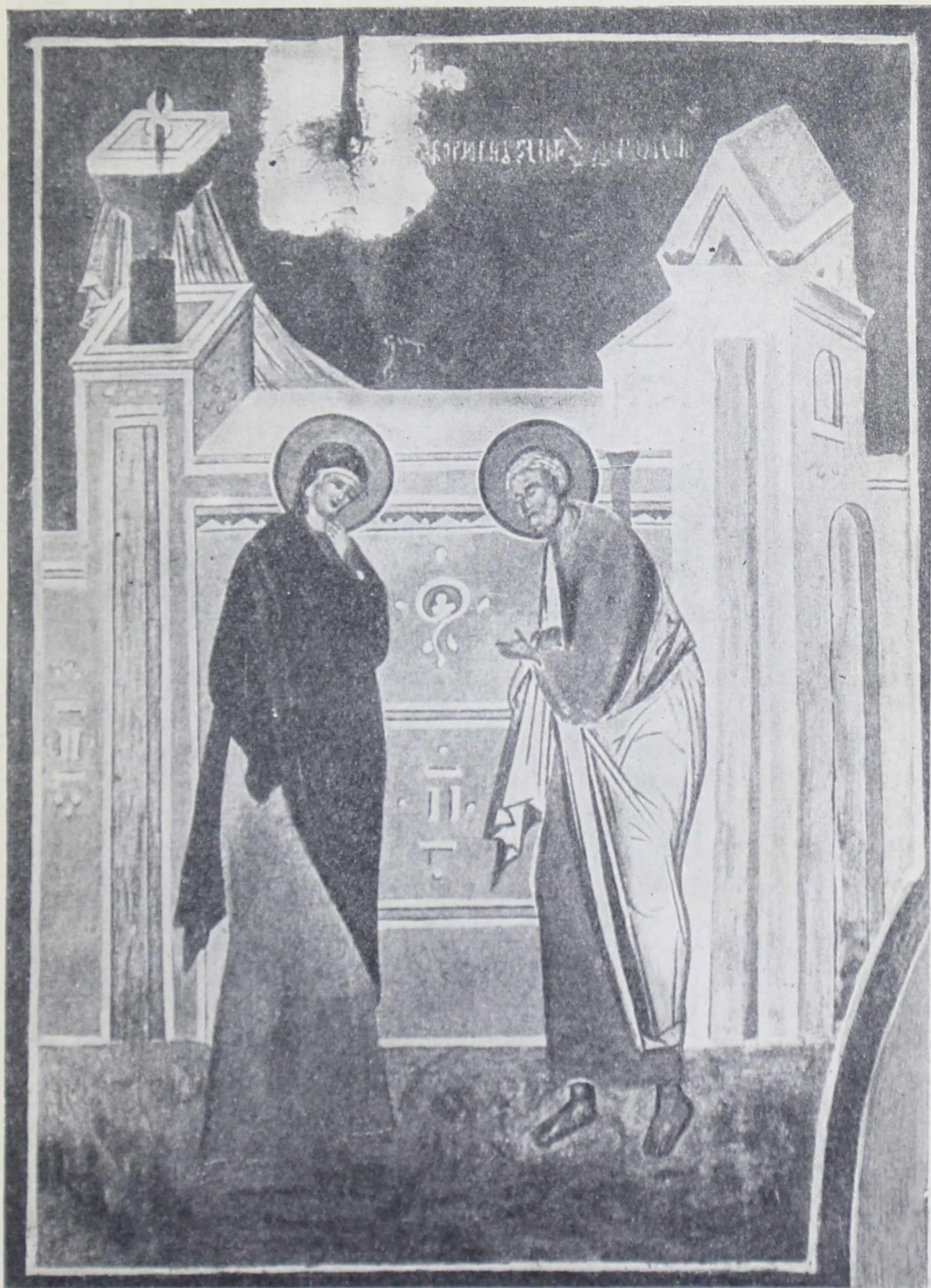
Фреска Дионисия в Ферапонтовом монастыре (1500—1502 гг.) «Бурю внутрь имея»