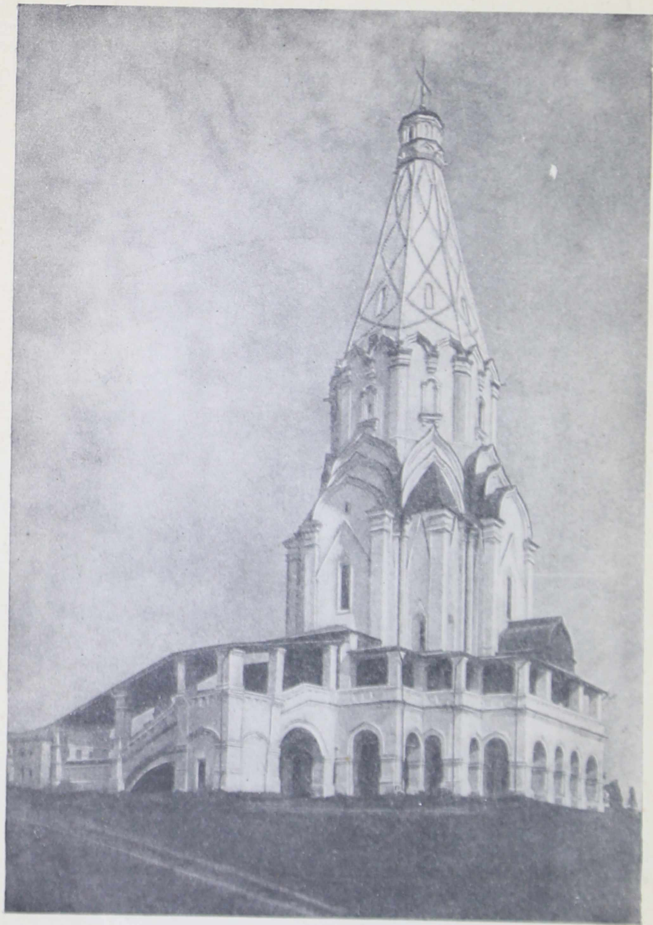
Церковь Вознесения в селе Коломенском (1532 г.)