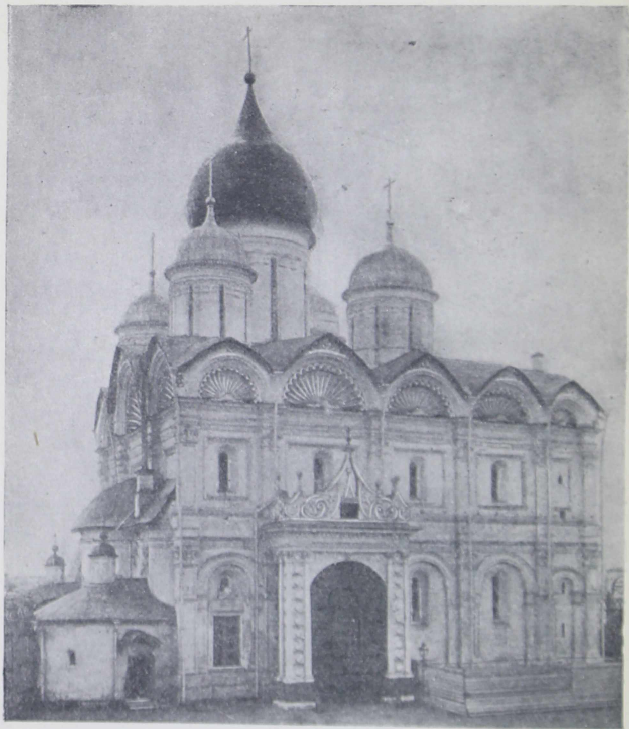
Архангельский собор Московского Кремля (1505—1509 гг.)