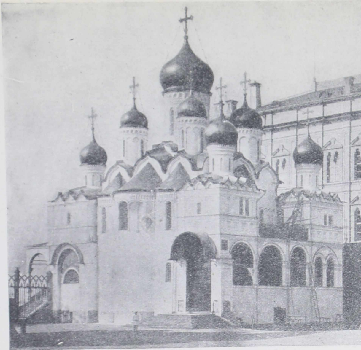
Благовещенский собор Московского Кремля (1482—