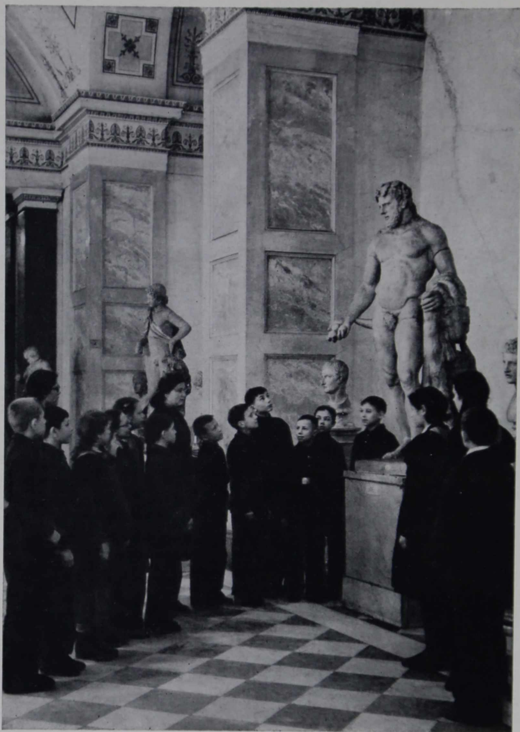
Школьная экскурсия в залах Эрмитажа

мых различных слоев населения. С интересом прослушали цикл из 6 занятий две группы рабочей молодежи Кировского завода. Кроме того, в Эрмитаже были организованы циклы экскурсий для рабочих и служащих других заводов и предприятий города («Электроаппарат», типография им. Евг. Соколовой, Центральное картографическое производство и т. д.). Ряд экскур-