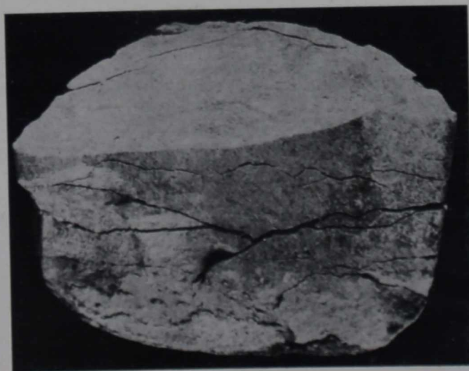
Вид статуэтки снизу (до реставрации)

Основной и главной задачей реставрации было прекращение процесса разрушения камня. Простая склейка трещин и кусков не могла ликвидировать этот процесс. Надо было так связать ча-