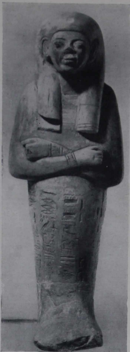
Египетская статуэтка (после реставрации)

стицы известняка, чтобы не только прекратить уже имеющееся расслаивание, но и, по возможности, предупредить его в дальнейшем.