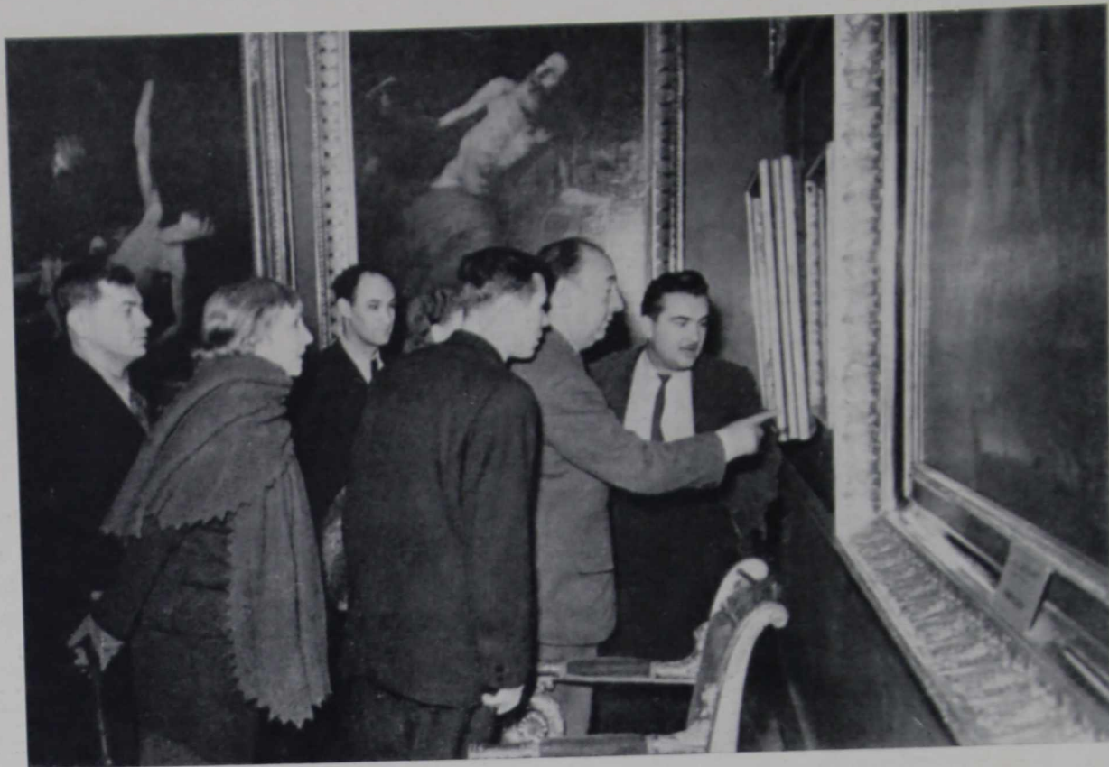
Пабло Неруда осматривает собрание испанской живописи