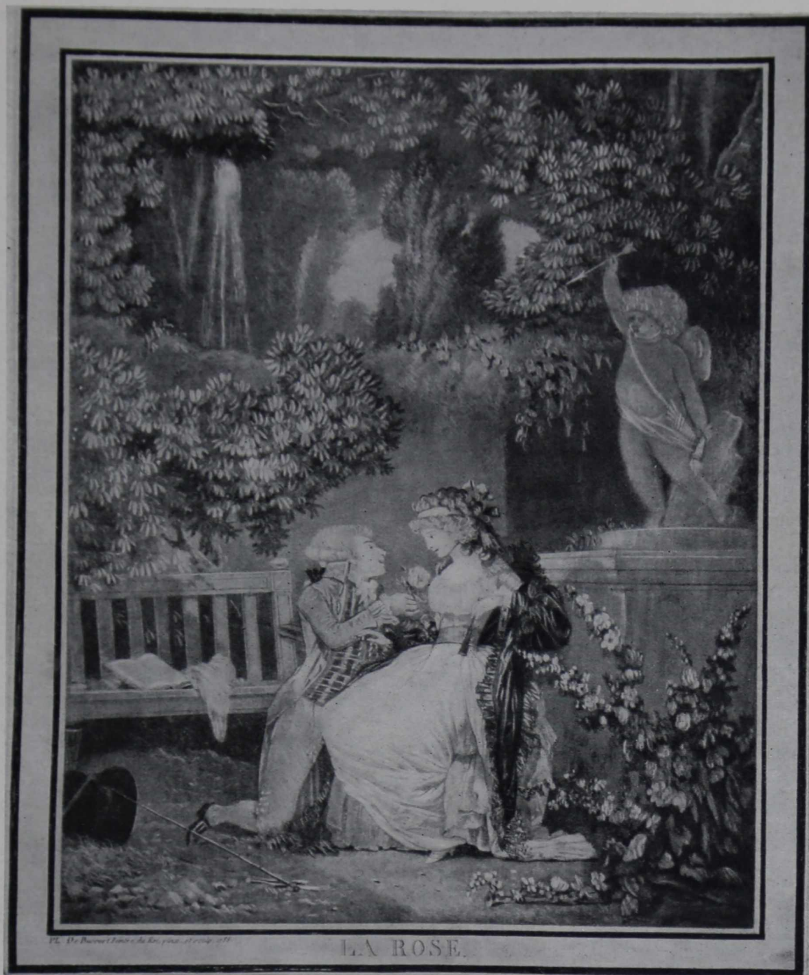
Л. Ф. Дебюкур. Преподнесение розы

и Уайтом — с Добсона, а также превосходной резцовой гравюрой Стрэнджа «Портрет королевы Генриетты Марии» — с Ван-Дейка.