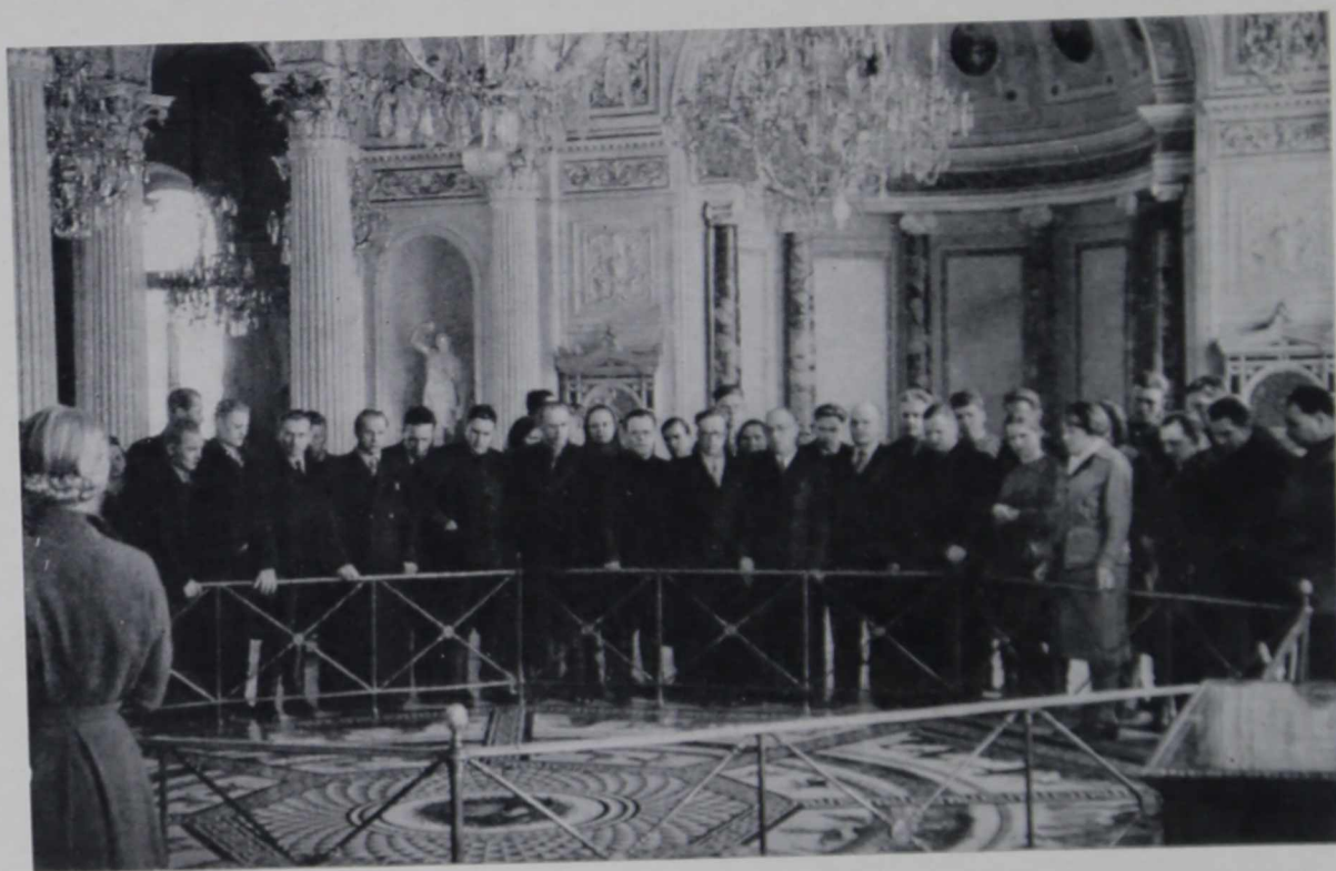
Экскурсия работников сельского хозяйства в залах Эрмитажа