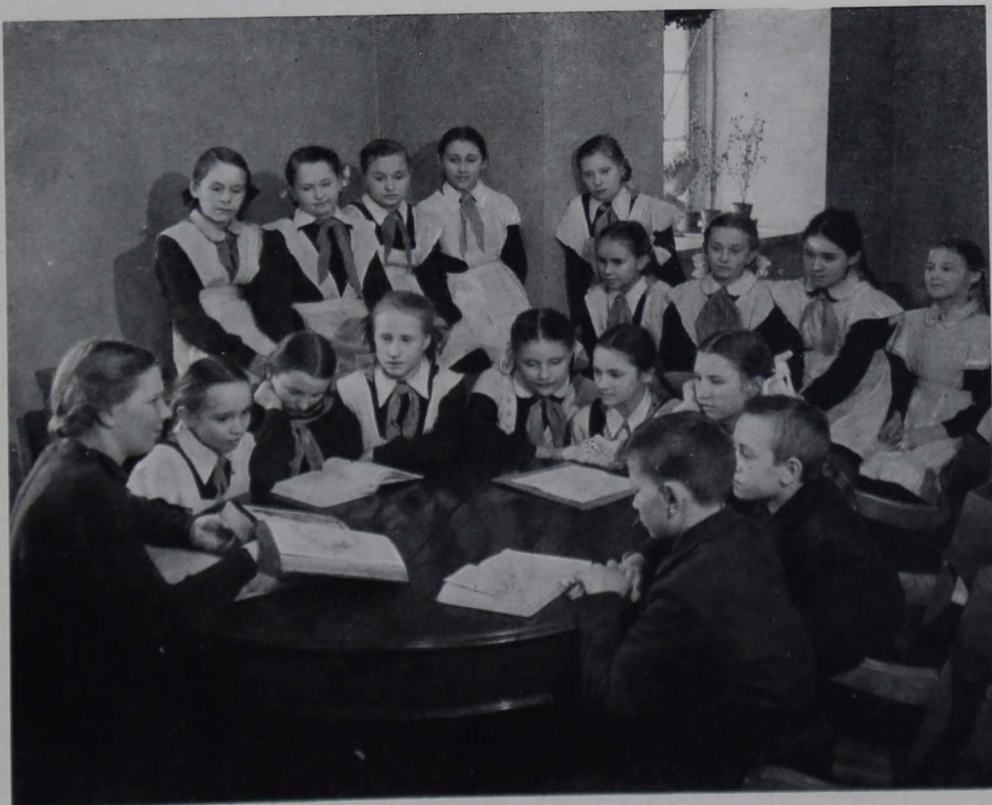
Занятия школьного кружка

Вводная экскурсия используется как отправной момент при изучении темы, предваряет прохождение ее в классе и, разгружая урок, переносит ряд вопросов, связанных с ней, в музей.