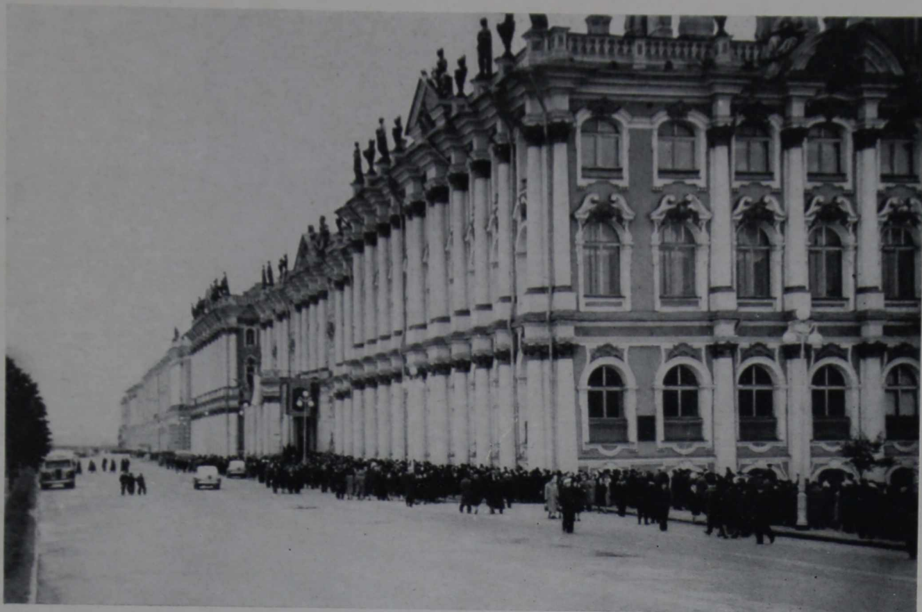
Посетители, направляющиеся на выставку индийского искусства

ников осматривать музей. За последнее время Эрмитаж посетили рабочие и служащие заводов «Электросила», «Красный выборжец» и «Хрустальная горка», фабрики «Красное знамя» и ряда других предприятий. Только за первое полугодие 1955 г. состоялся 21 культпоход.