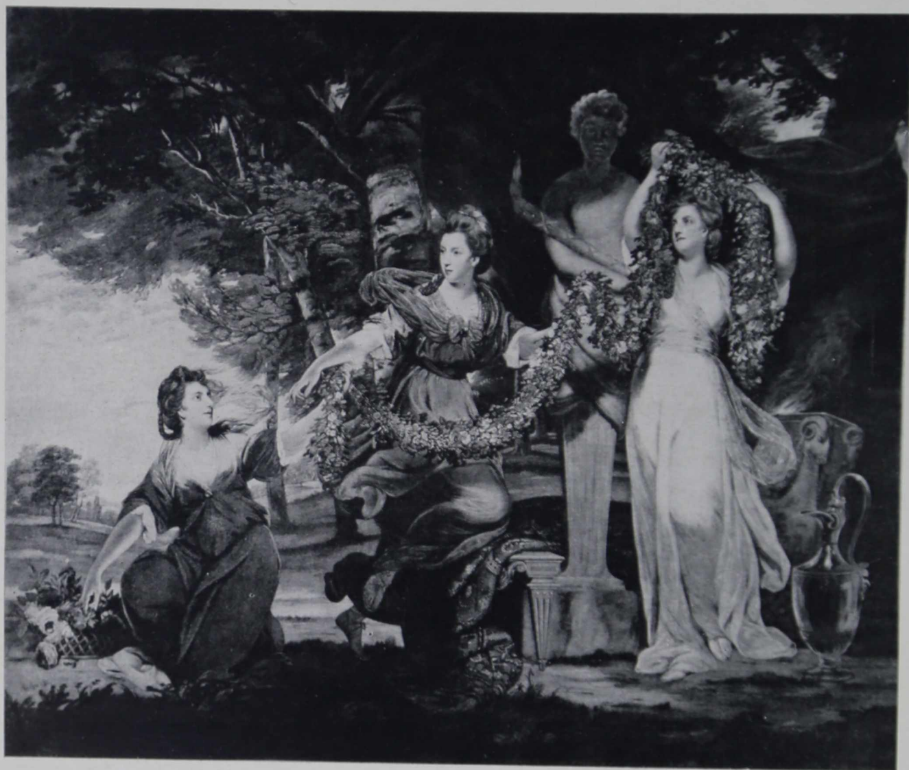
Т. Уотсон (с Рейнольдса). Три Грации, венчающие бюст Гименя

Графика начала XVIII в. была представлена выполненными в черной манере портретами, гравированными Мак Арделлем с Гудсона и Рамзея