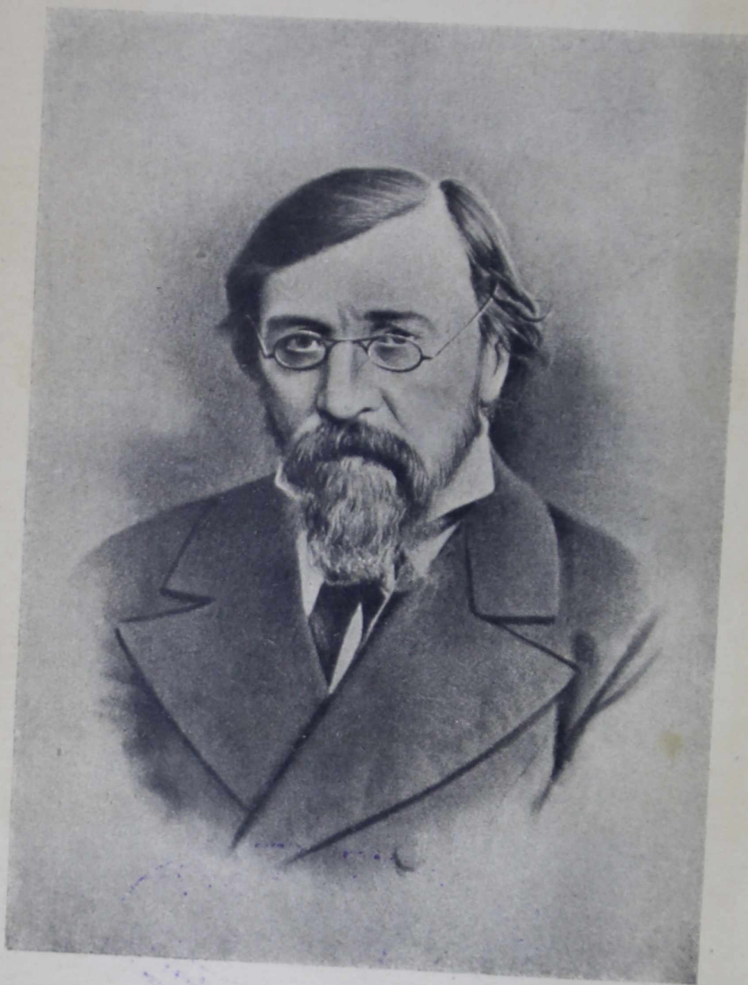
Н. Б. ЧЕРМЫШЕВСКИЙ