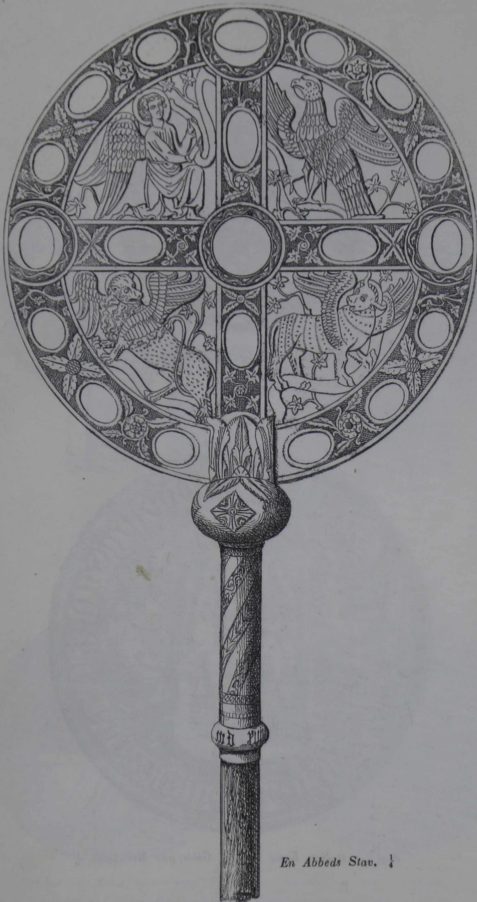
En Abbeds Stav. \frac{1}{4}