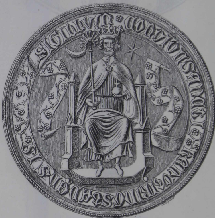
Segl for et Sct. Knud Hertugs Gilde paa Bornholm. \frac{1}{4}