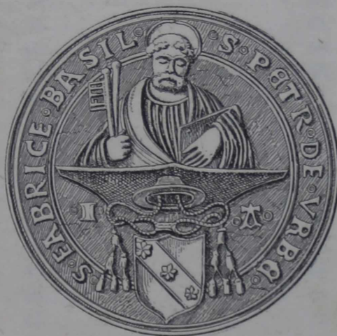
Afladskræmmeren Arcimbolds Segl. \frac{1}{4}