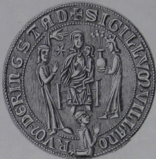
Gammelt Segl for Ringsted By. \frac{1}{4}