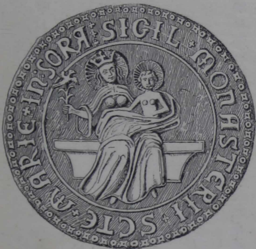
Det sorøske Marieklosters Segl. \frac{1}{4}