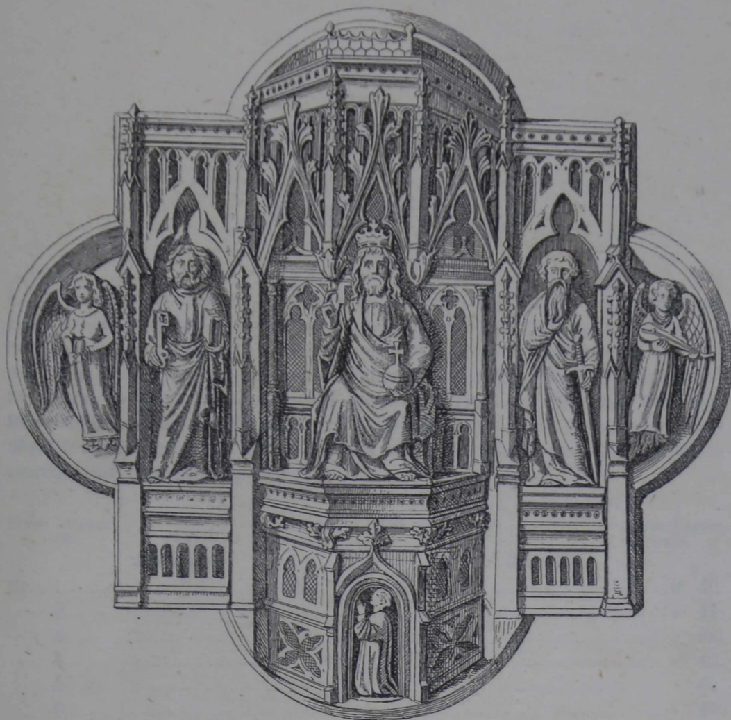
Spænde af forgyldt Messing til en Bispekaabe. \frac{4}{4}