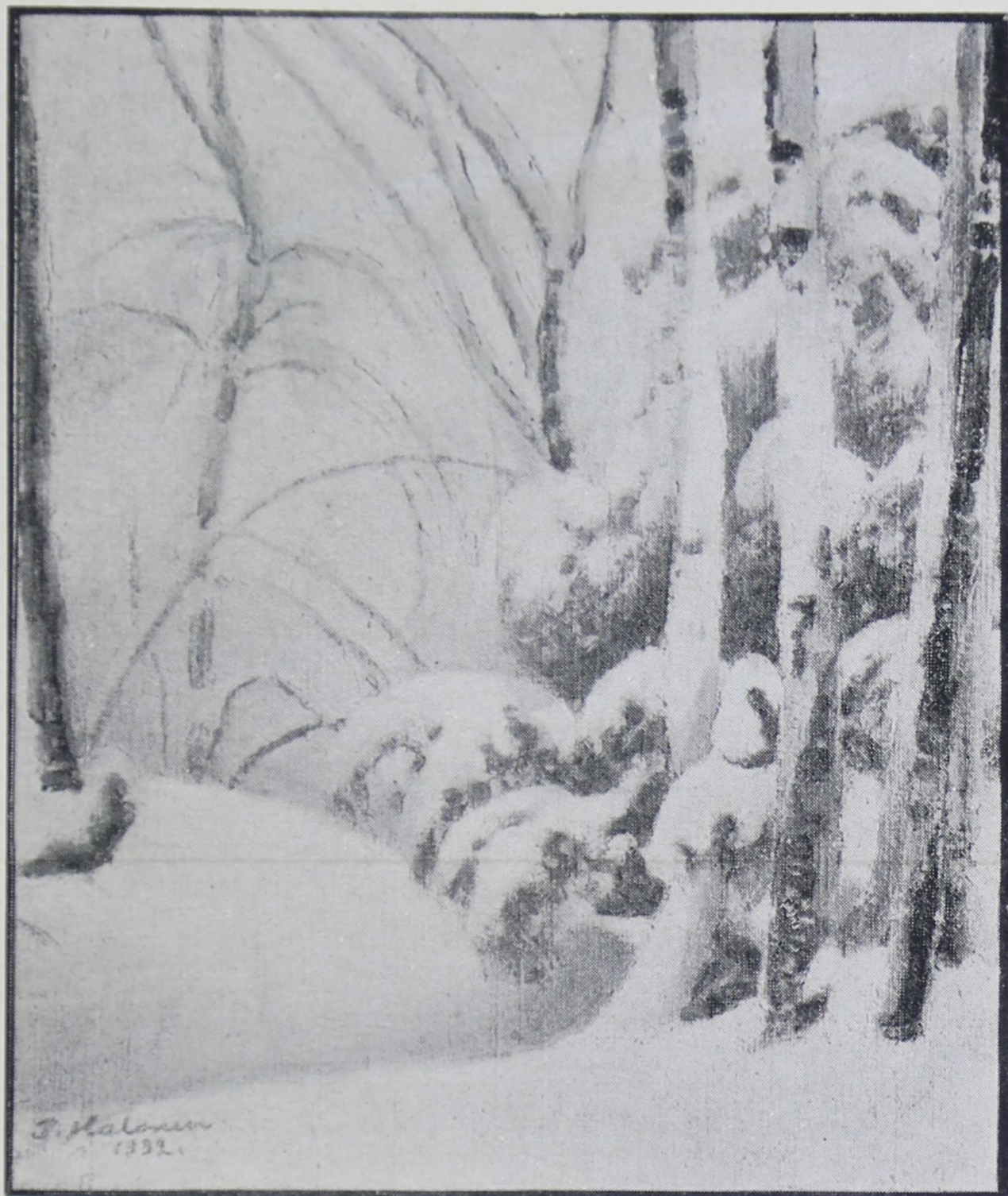
П. ХАЛЛОНЕН. Зимний пейзаж