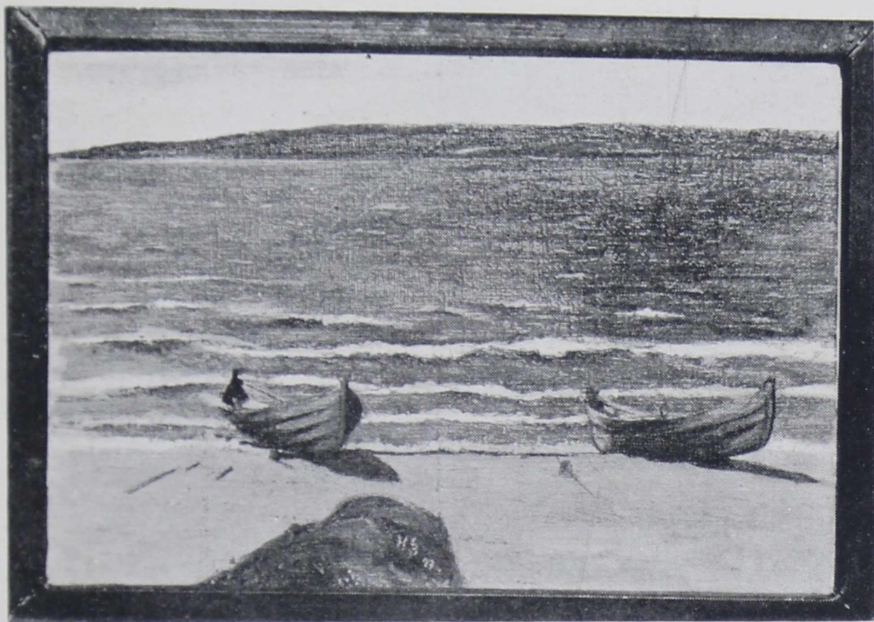
Х. СИМБЕРГ. Лодка на берегу