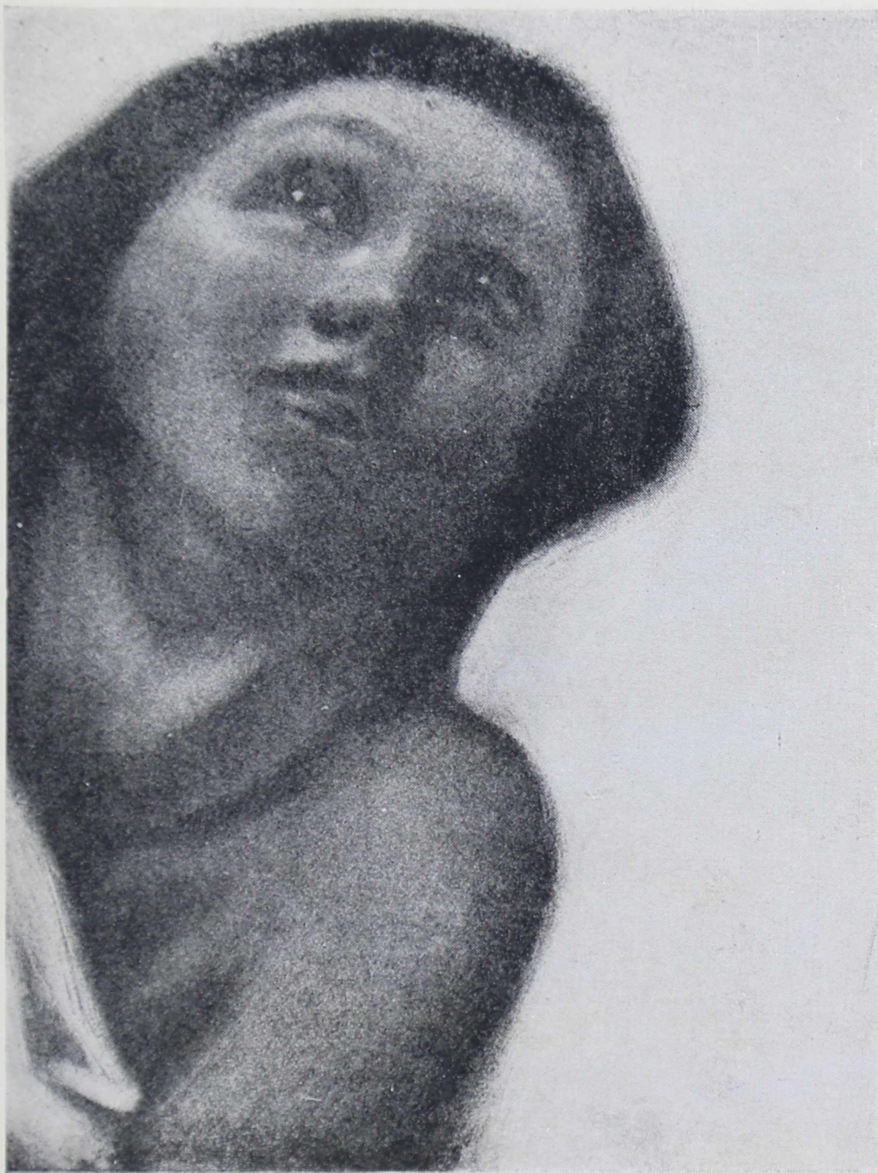
А. ГАЛЛЕН-КАЛЛЕЛА, Голова девушки (офорт)