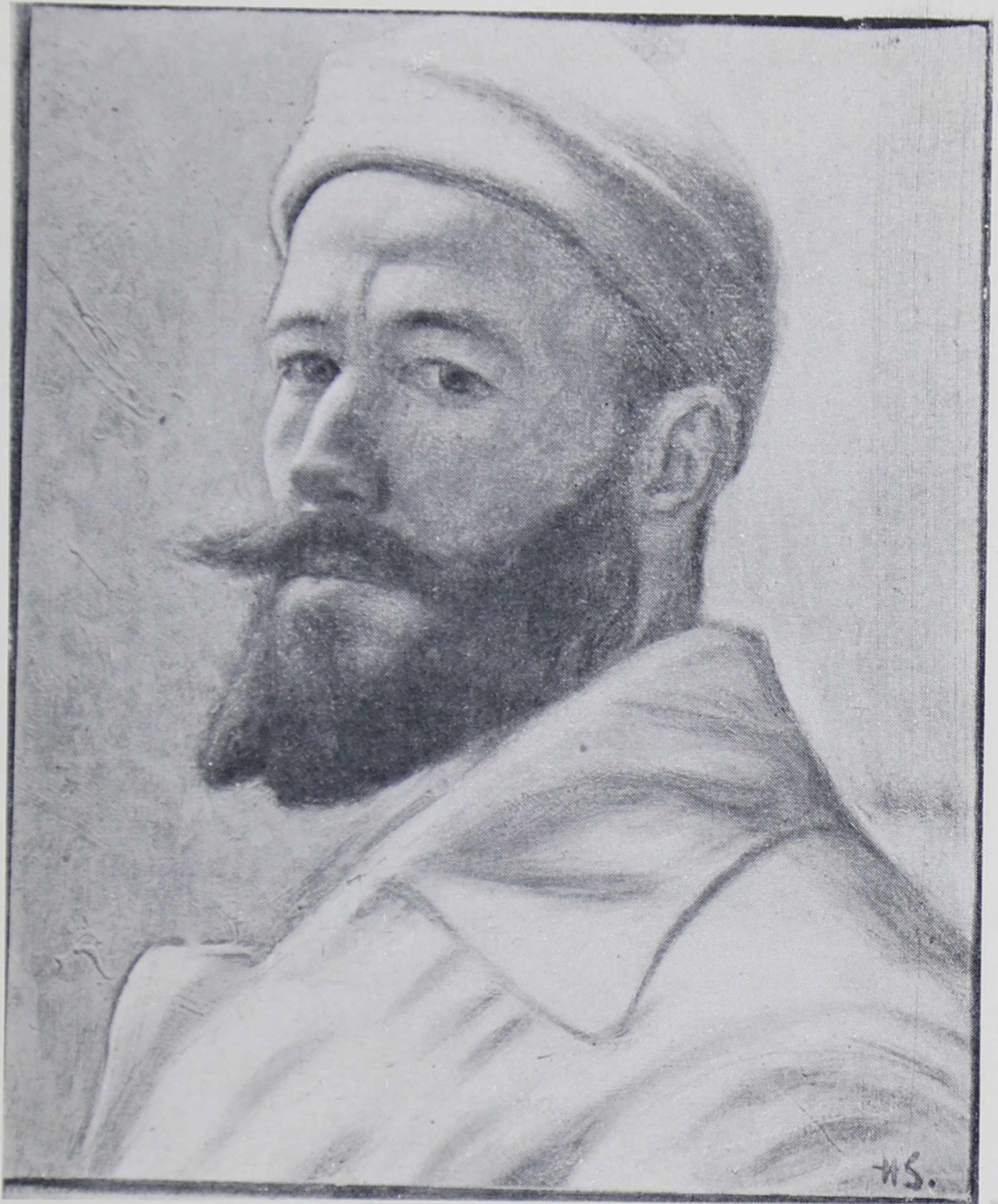
Х. СИМБЕРГ. Автопортрет