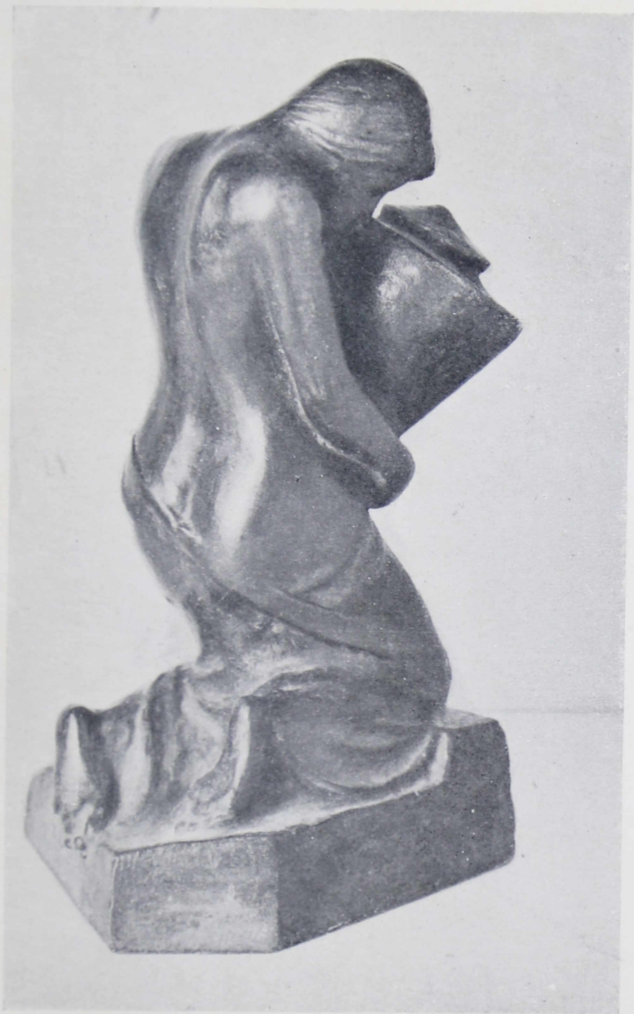
В. В АЛЛГРЕН. Перед могилой (бронза)