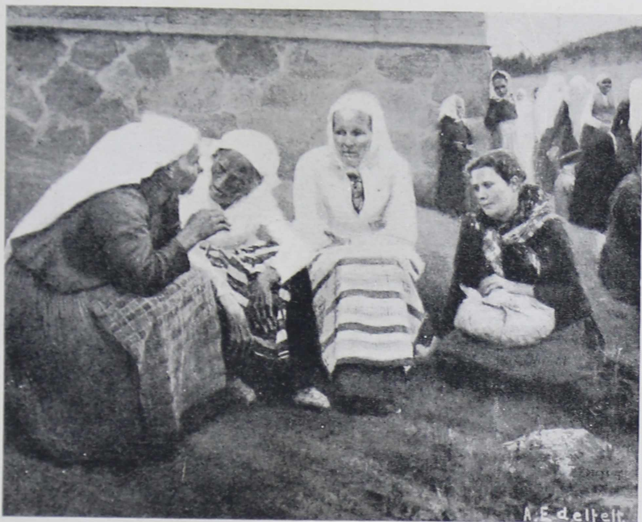
А. ЭДЕЛЬФЕЛЬТ. Крестьянки у Руоколакской церкви