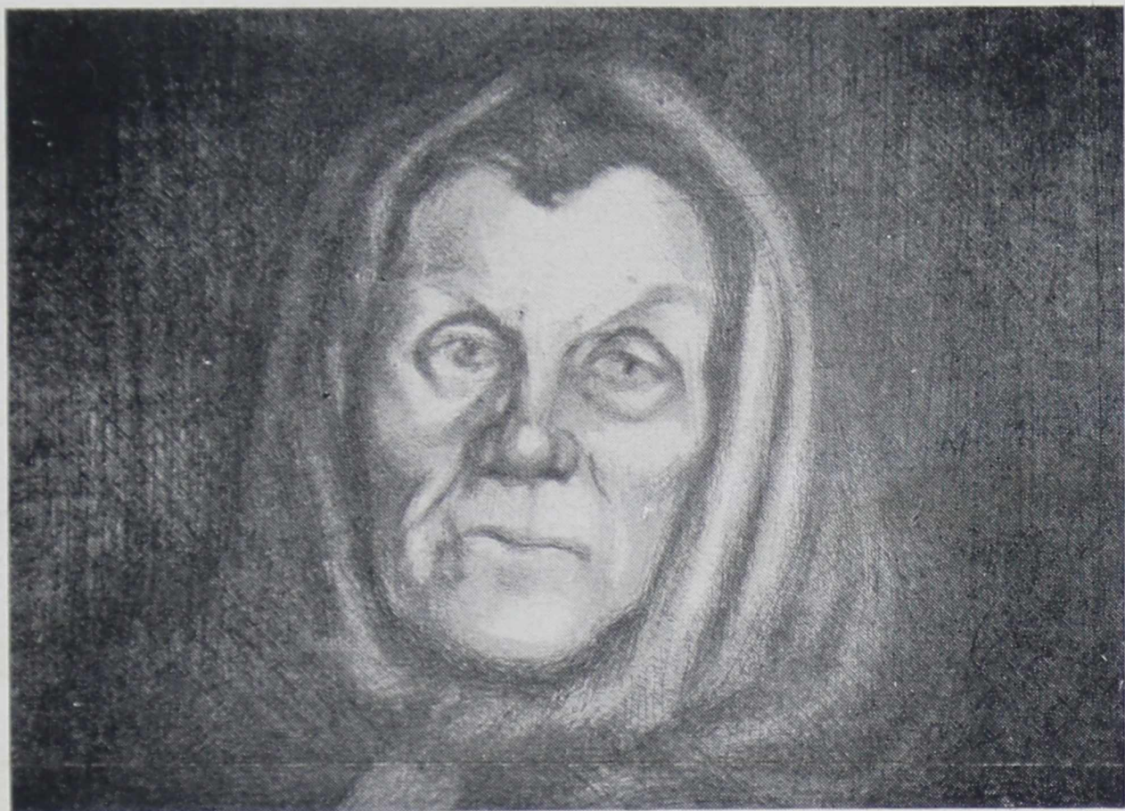
М. ОЙНОНЕН. Портрет (Акватинта)