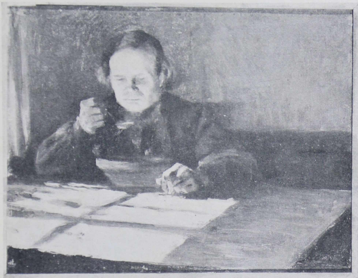
А. ЭДЕЛЬФЕЛЬТ. Крестьянин за едой