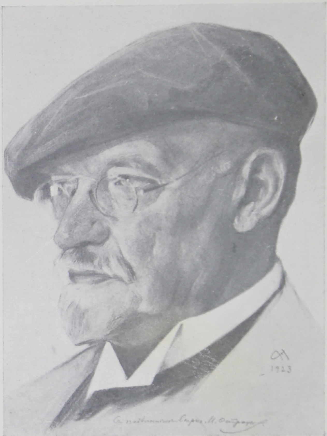
№ 3. Н. А. Андреев. Портрет Ильи Семеновича ОСТРОУХОВА.