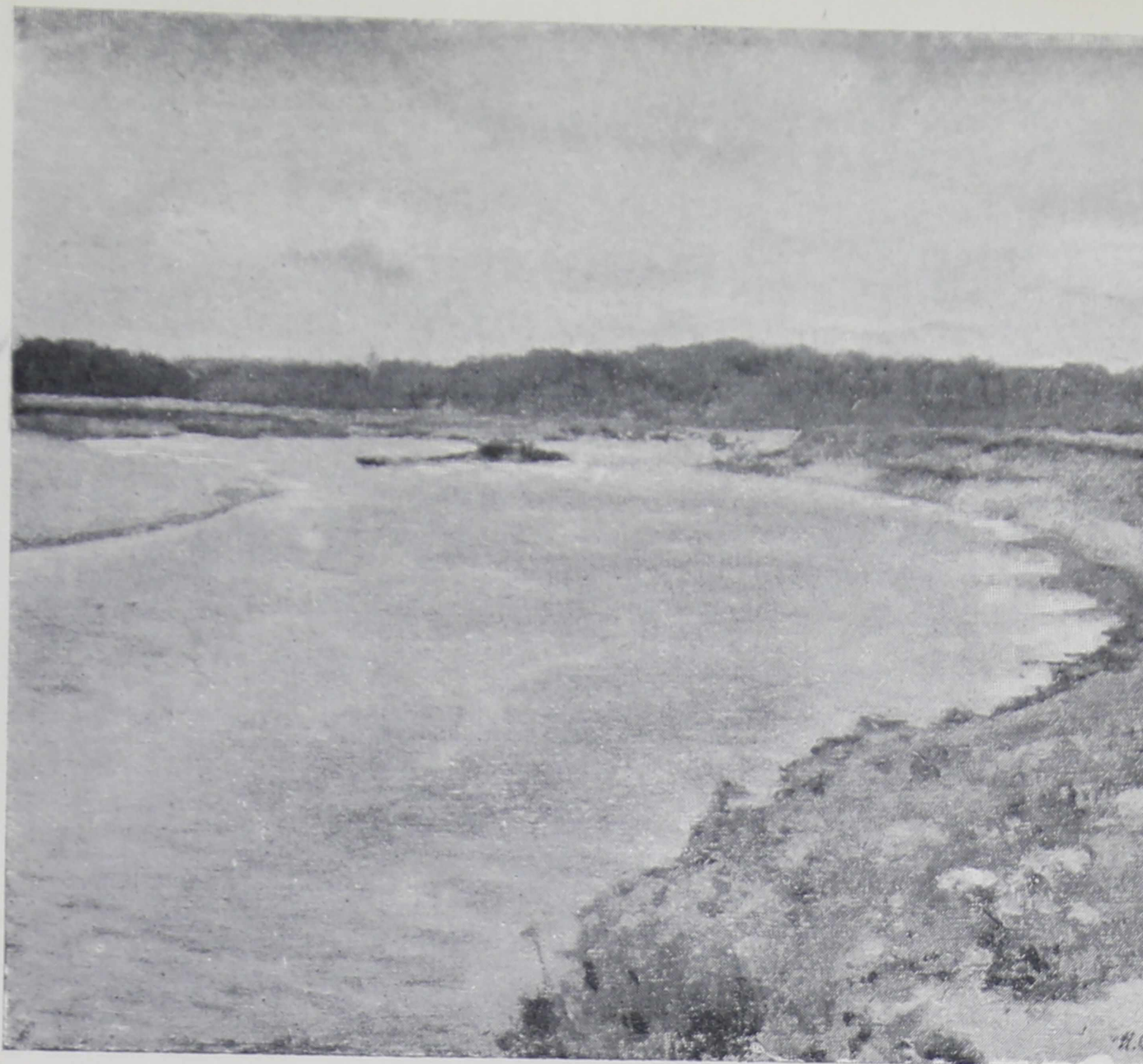
№ 26. И. С. Остроухов. Сиверко (этиюд).