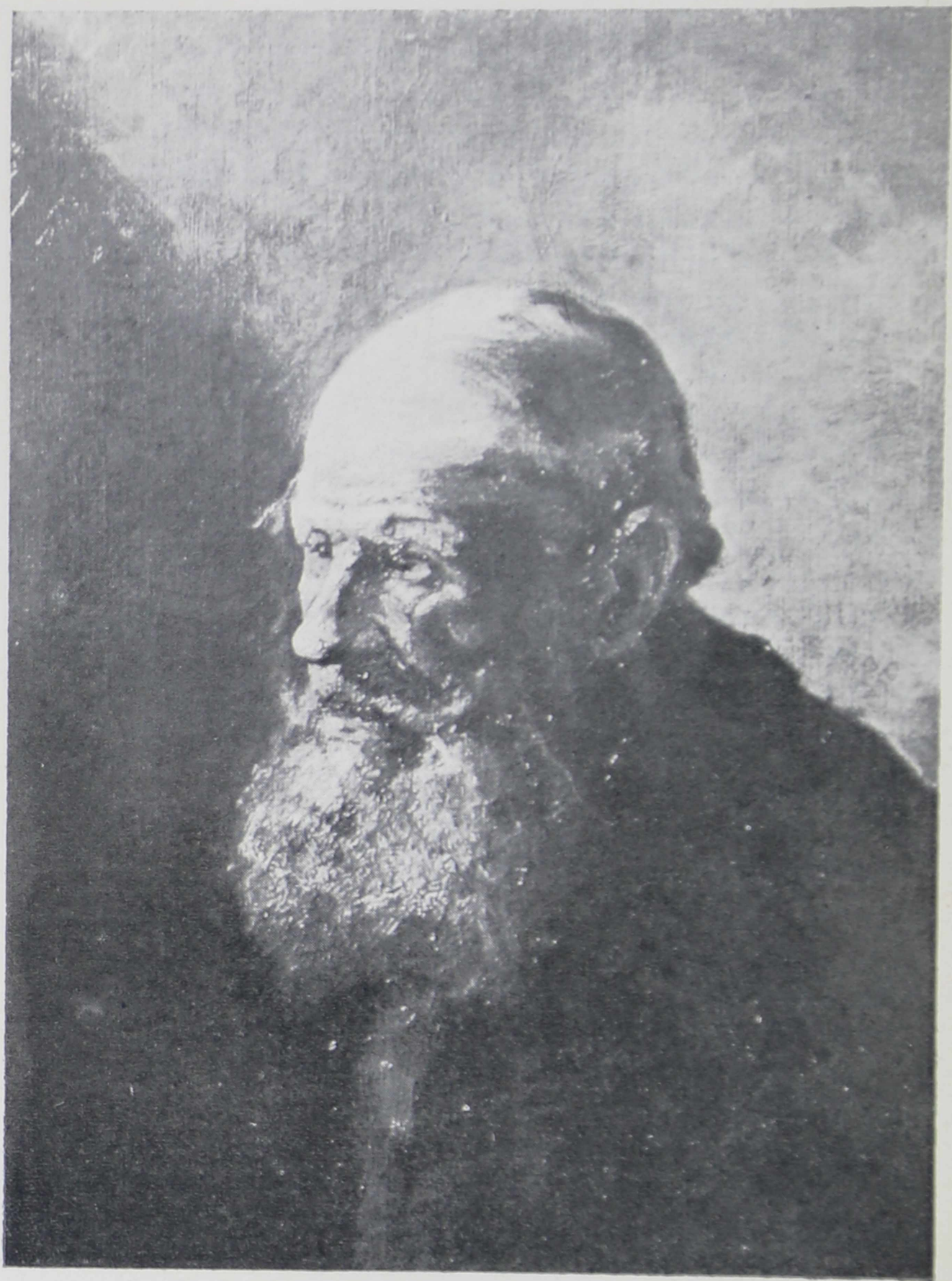
№ 4. И. С. Остроухов. Старик.