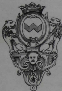
Къ № 7967.