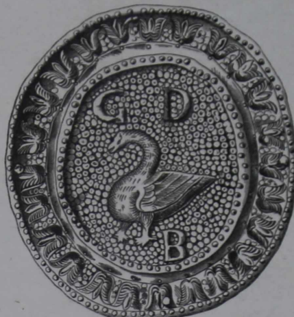
Къ № 7702.