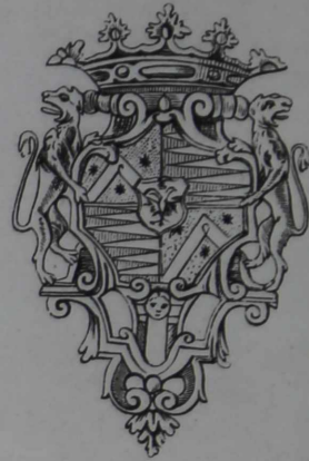
Къ № 7149.