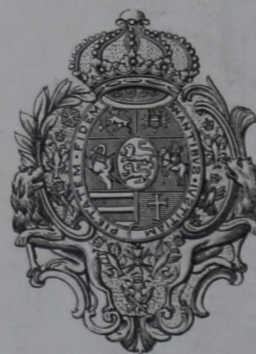
Къ № 8048.