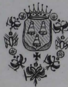
Къ № 7248.