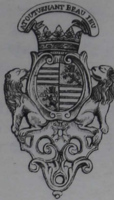
Къ № 7101.