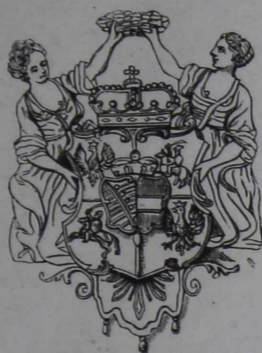
Къ № 7722.