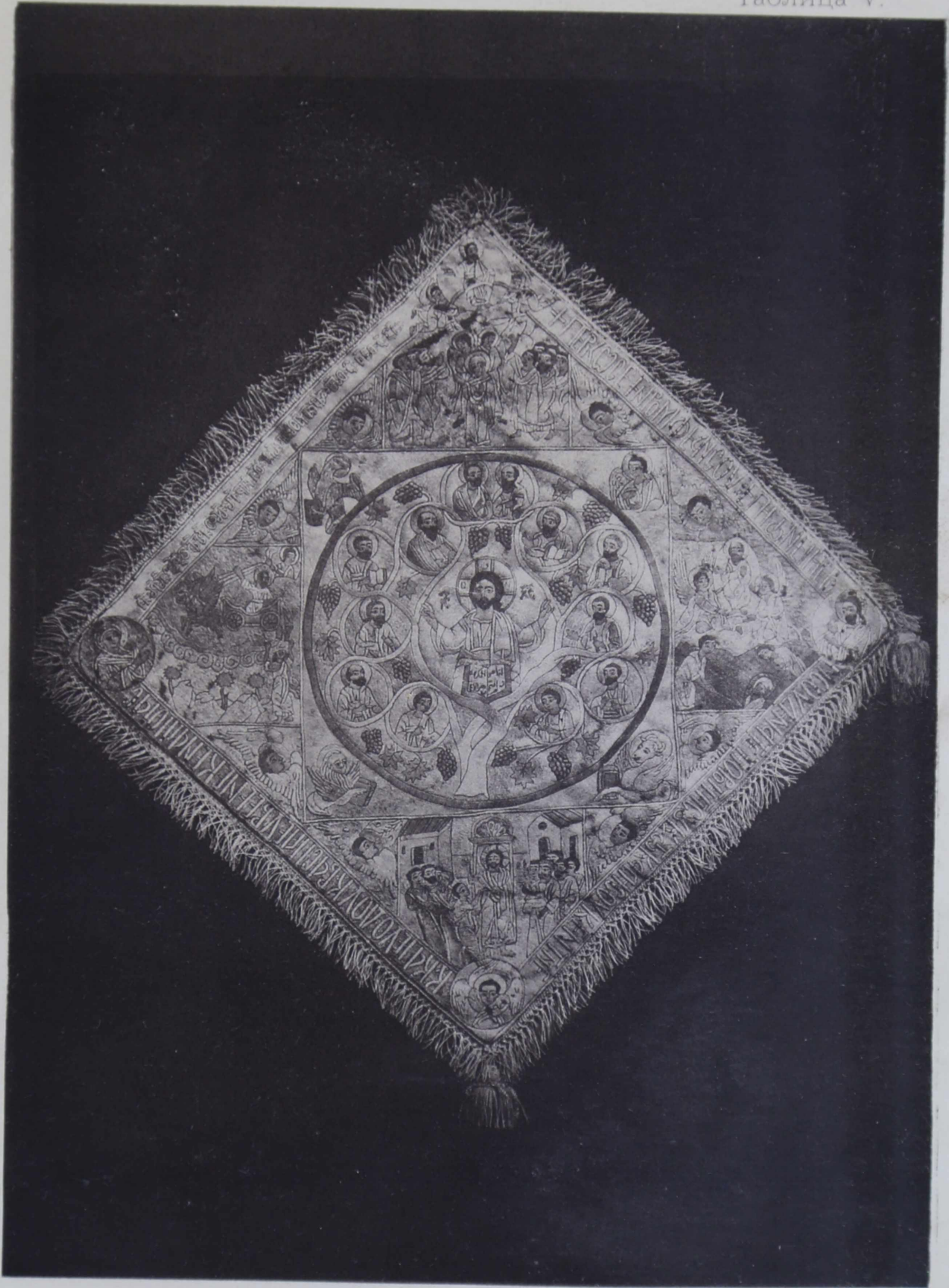
13. Грузинская архіерейская палица XVII вѣка.