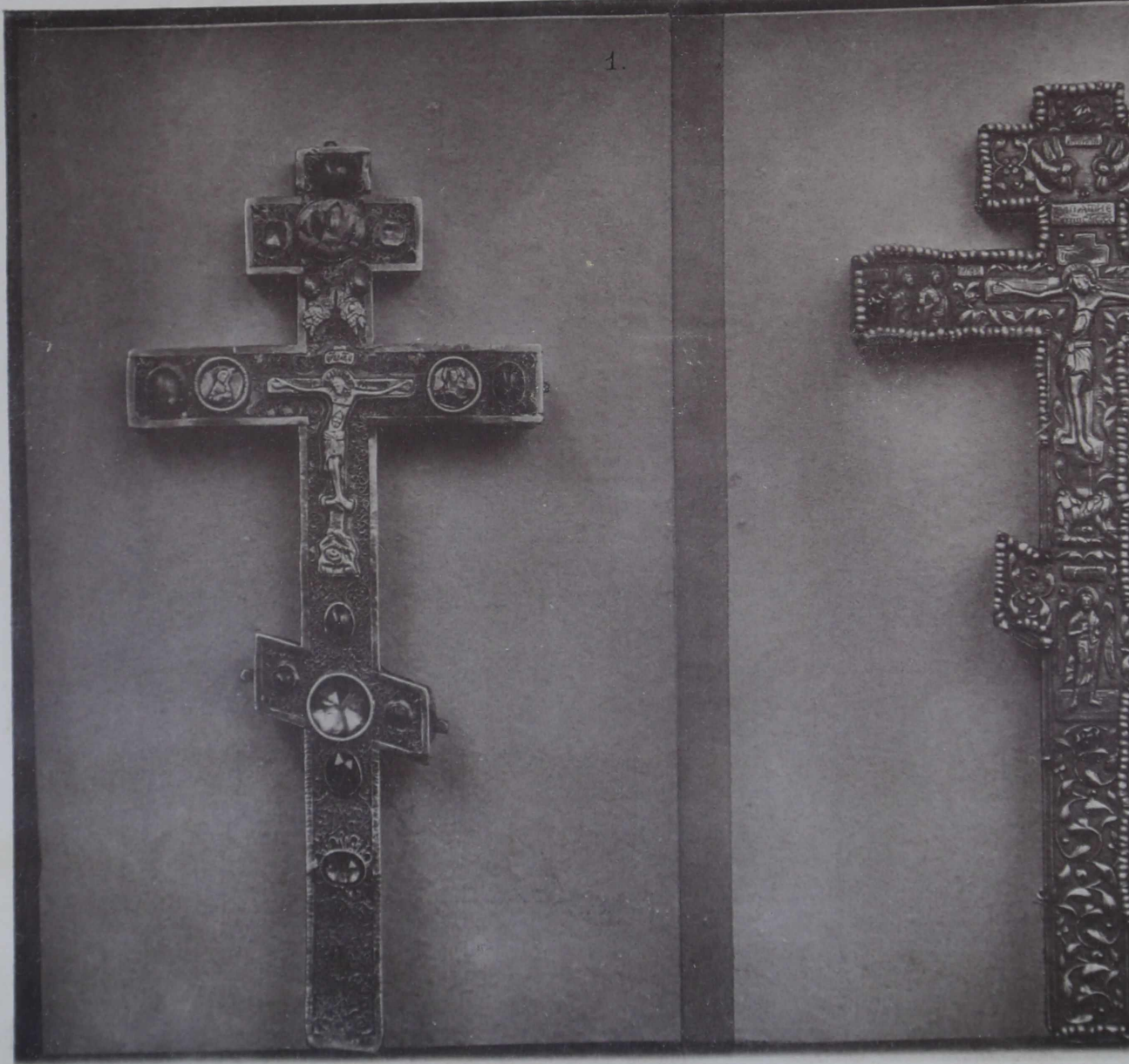
1. Напрестольный крестъ 1612 г.