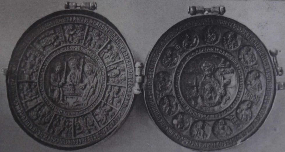
7. Панагія складная XVI вѣка.— 8 и 9. Панагія складная первой половины XVI вѣка.