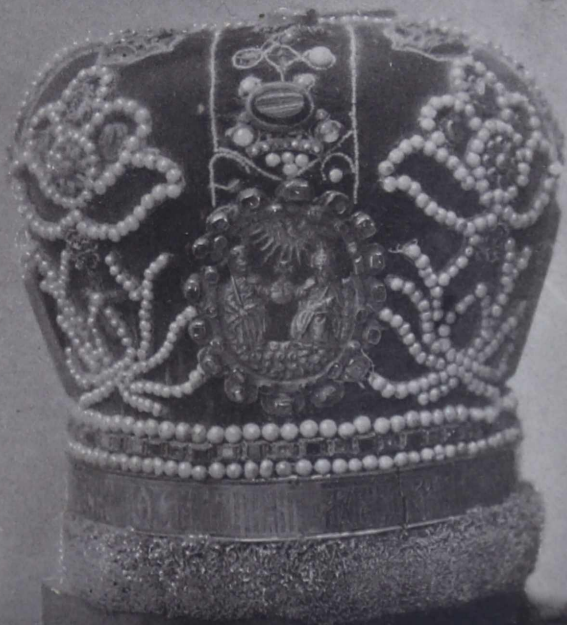
3. Потиръ 1633 г. 4. Дискось 1633 г. 5. Архіерейскій жезлъ XVII вѣка.—6. Шапка-митра Никиты Архі- епископа Коломенскаго, 1682 г.