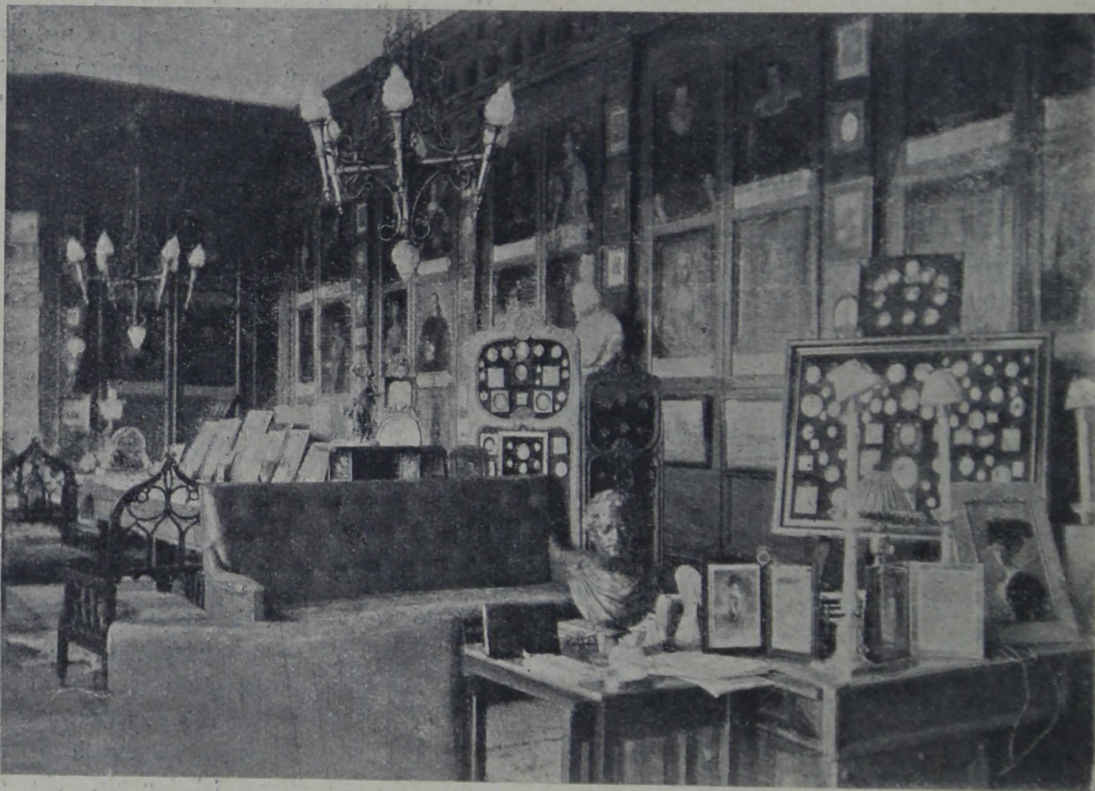
БИБЛИОТЕКА ВИШНЕВЕЦКАГО ЗАМКА.

До послѣдняго времени,—пишутъ В. и Г. Лукомскіе,—у многихъ окрестныхъ помѣщиковъ можно было находить рѣдкія книги въ великолѣпныхъ кожаныхъ переплетахъ съ