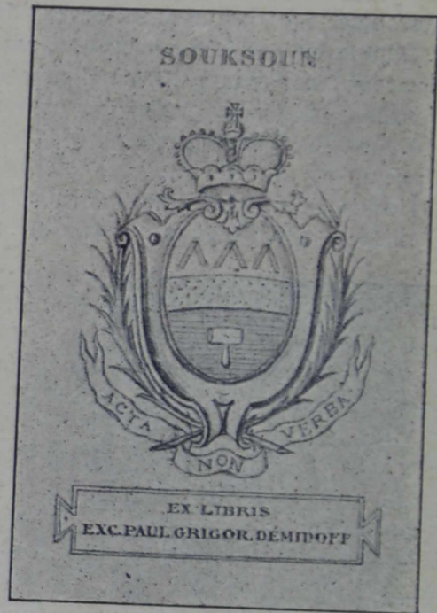
Ex-libris суксунской вѣдлотекы П. А. Демидова.

это вопросъ о степени его независимости. Во-вторыхъ, это вопросъ о томъ, насколько его идеи могутъ выдержать испытаніе времени, этого «великаго критика», какъ онъ