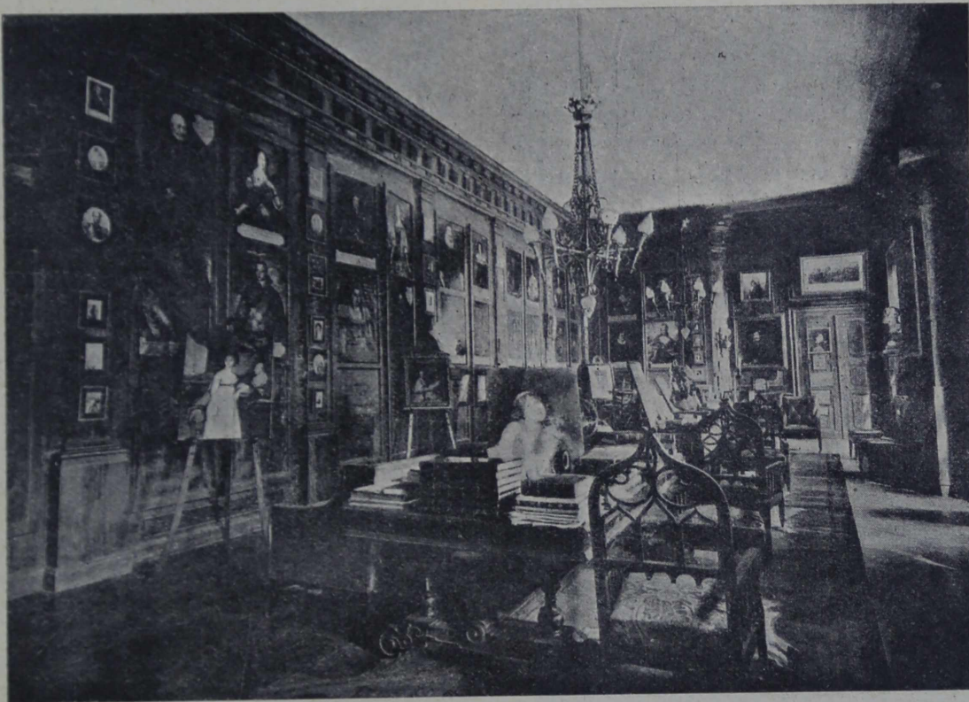
БИБЛИОТЕКА ВИШНЕВЕЦКАГО ЗАМКА.

наго человѣка, котораго русскій народъ считалъ сначала «истиннымъ царемъ», а потомъ развѣчалъ и призналъ обманщикомъ. Здѣсь, въ Вишневцѣ, если вѣрить преданіямъ, былъ задуманъ смѣлый «походъ на московскій престолъ». Казалось бы поэтому, что именно Вишневецкій замокъ долженъ бы служить музеемъ-библіотекою, въ которомъ надлежало бы собрать все, что имѣетъ отношеніе къ Димитрію Самозванцу, всѣ сочиненія о немъ, документы (или, по крайней мѣрѣ, точныя ихъ копіи), портреты и пр.