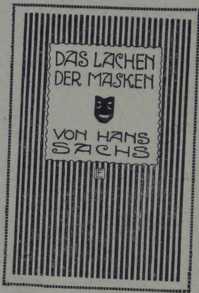
ОБРАЗЦЫ НОВѢЙШИХЪ КНИЖНЫХЪ УКРАШЕНІЙ: обложка книги «Das Lachen der Masken».

Зелененькій чеховскій домикъ стоитъ ближе къ степи и какъ-то немножко угломъ, а не по прямой линіи, какъ остальные: этимъ онъ уже немножко выдѣляется отъ остальныхъ, выдѣляется и по окраскѣ: зеленого цвѣта есть лишь два домика, и досадно