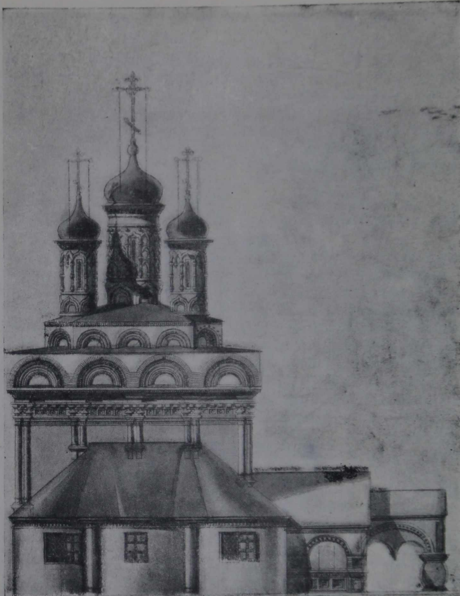
9. Церковь Николая на Берсеневке. Восточный фасад Обмер арх. Д. В. Разова

средней главы, дающий особый тип разновидности убранства главок в московской архитектуре.