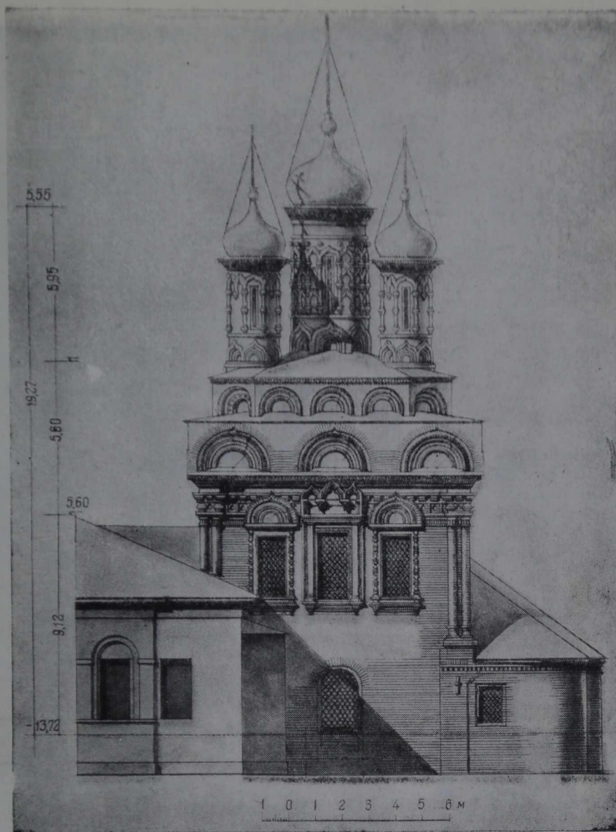
10. Церковь Николая на Берсеневке. Южный фасад Обмер арх. Д. В. Разова

ственным изменениям: были закрыты кирпичными парапетными стенками заподлицо архивольты того и другого рядов кокошников, и по выложенным парапетам надстенного и верхнего рядов накрыты крыши с прямыми скатами, как показано на наших обмерных чертежах северного и других фасадов (рис. 8, 9, 10).