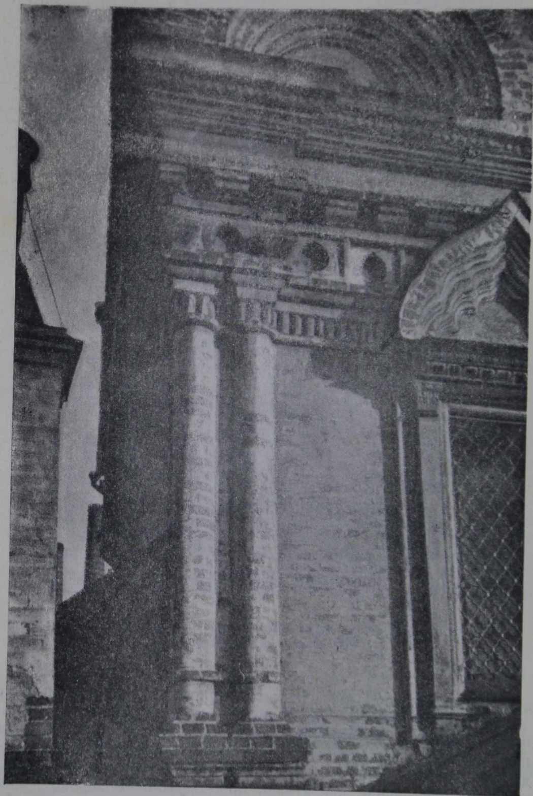
11. Церковь Николая на Берсеневке. Фрагмент северо-восточного угла