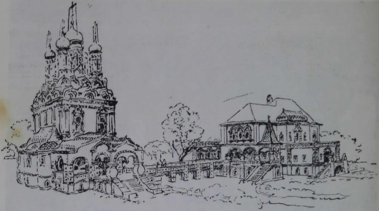
13. Палаты Аверкия Кириллова и церковь Николая на Берсеневке. Общий вид Проект реконструкции арх. Д. В. Разова

При первом взгляде на храм невольно останавливаешься на своеобразной, очень занятой обработке оконных отверстий, в которых западно-европейские элементы (орнаментация, композиция капителей, симметричное расположение) пытаются занять место среди доминирующих в здании мотивов кирпичных и каменных декораций, идущих от древних традиций деревянной народной резьбы; местами техника обработки оконных проемов граничит с мастерством ювелирного искусства. Эти высеченные из камня детали, надо сказать, не масштабны по отношению к большинству более древних мотивов кирпичных и каменных декораций храма Николая, относящихся к XVII столетию.