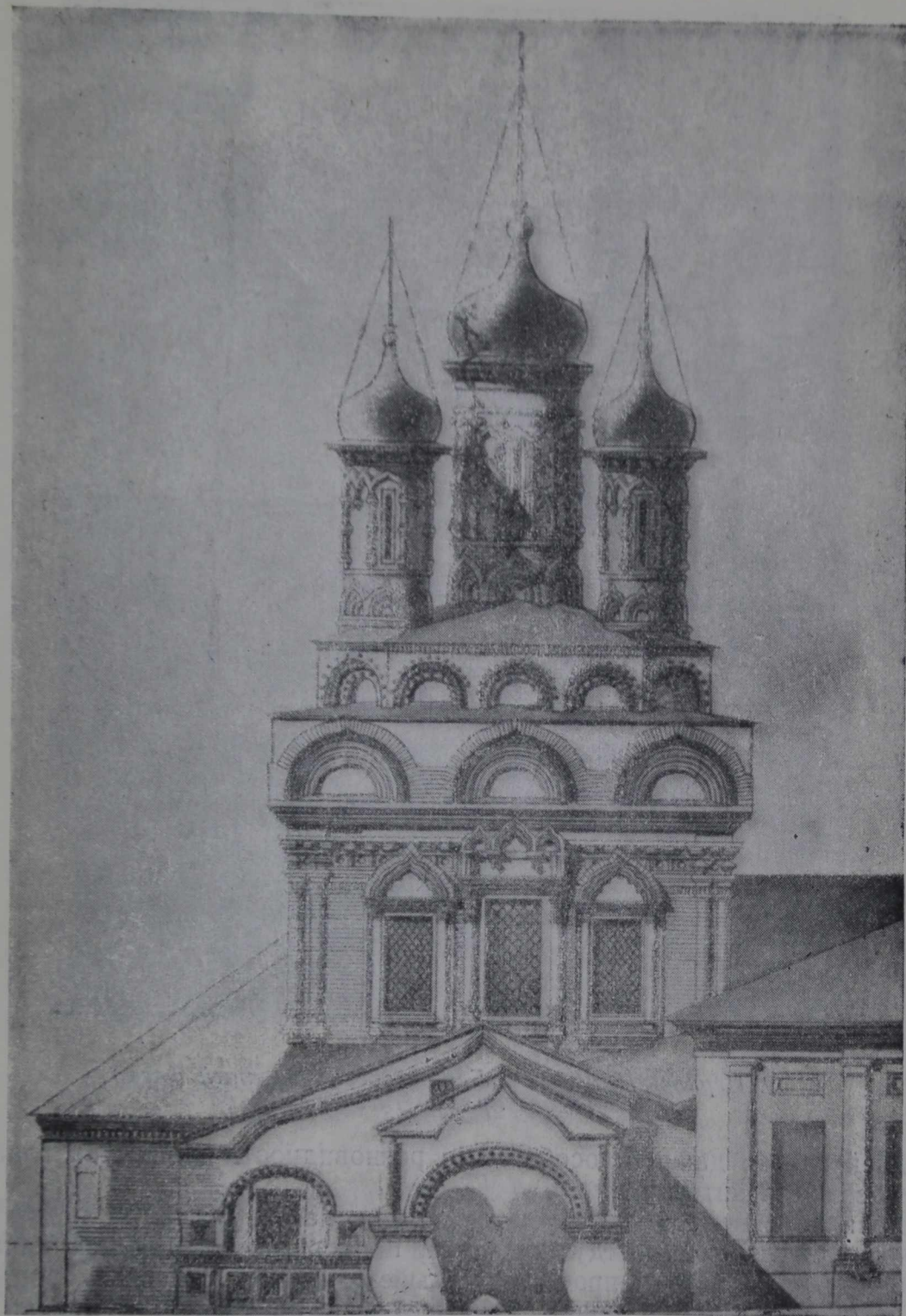
8. Церковь Николы на Берсеневке. Северный фасад Обмер арх. Д. В. Разова