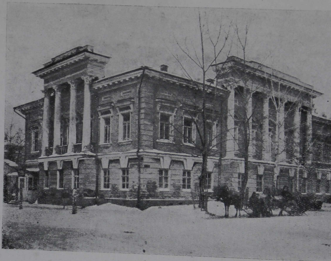
Главное здание Томского Краевого Музея.