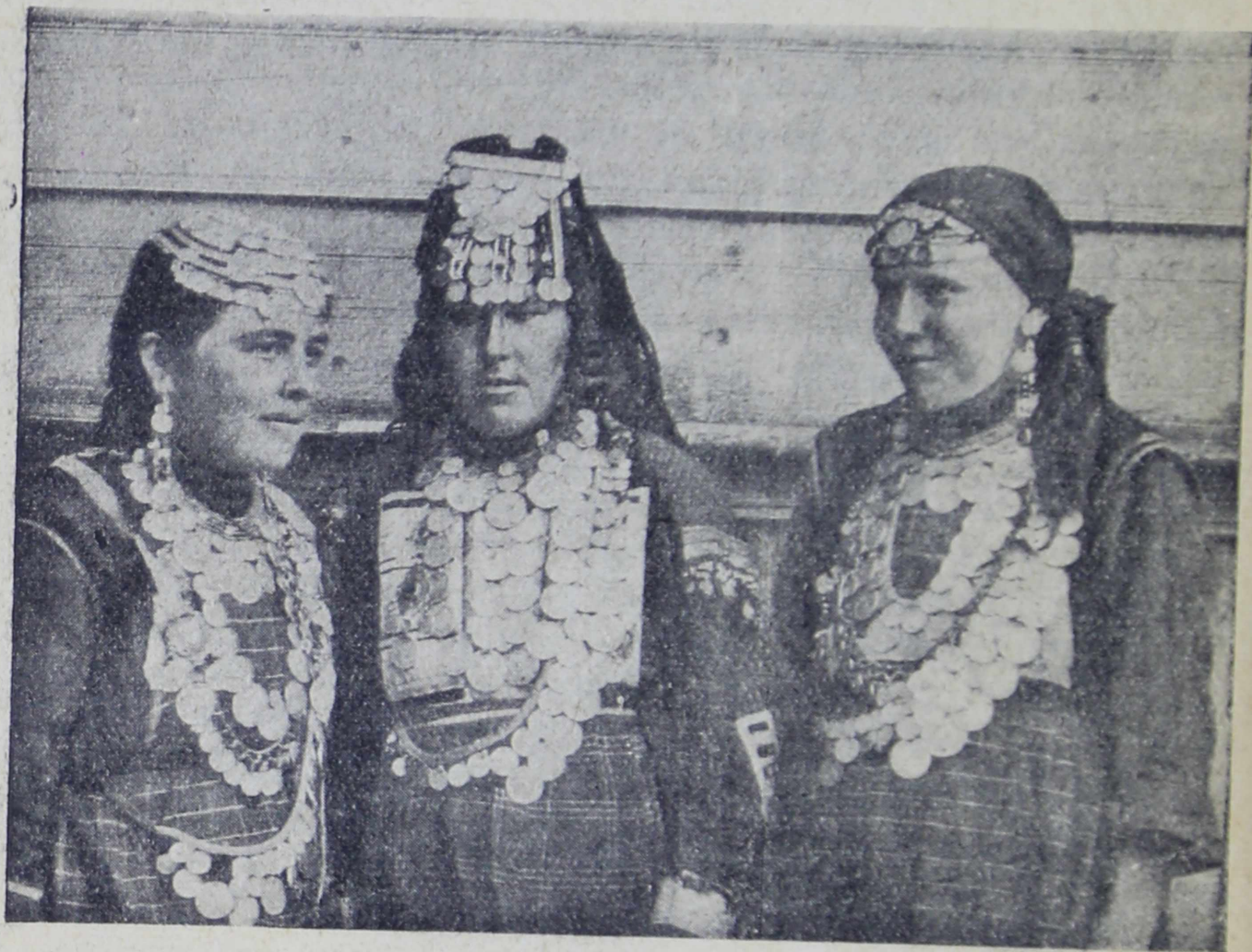
Вотячки в национальных костюмах. (По материалам Ц. Ч. Н.).

Это большей частью двухэтажные сооружения, в нижних этажах которых хранится мука и зерно, т. е. они попросту представляют собой амбар. В верхних-же этажах обычно хранится домашний скарб вотяка и вотячки. Верхний этаж в летнее время нередко превращается и в спальное место. Содержится „кенос“ в чистоте и опрятности. В обычное время „кенос“ является и помещением для девушки вотячки до замужества, а после замужества местом брачной спальни. В весенние теплые вечера и в осенние длинные ночи „кенос“ является местом сборищ молодежи, песен и танцев и вообще веселья.