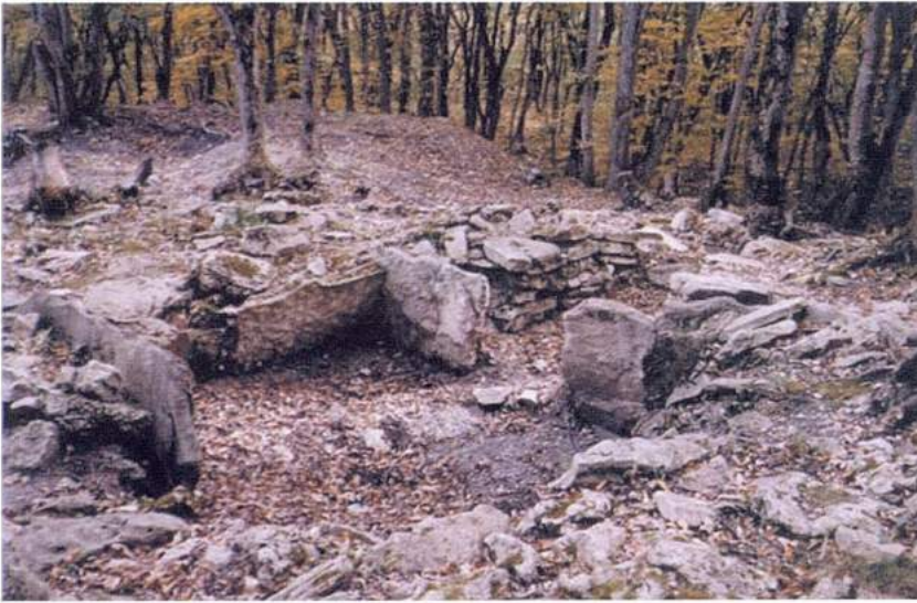
Рис. 28. Татарское городище. Склеп