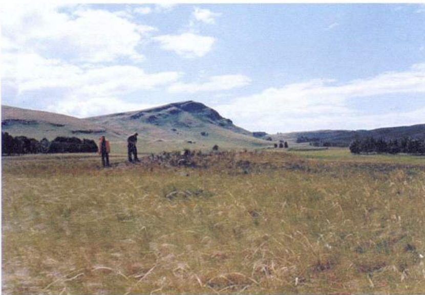
Рис. 29. Ирндик. Сакский курган