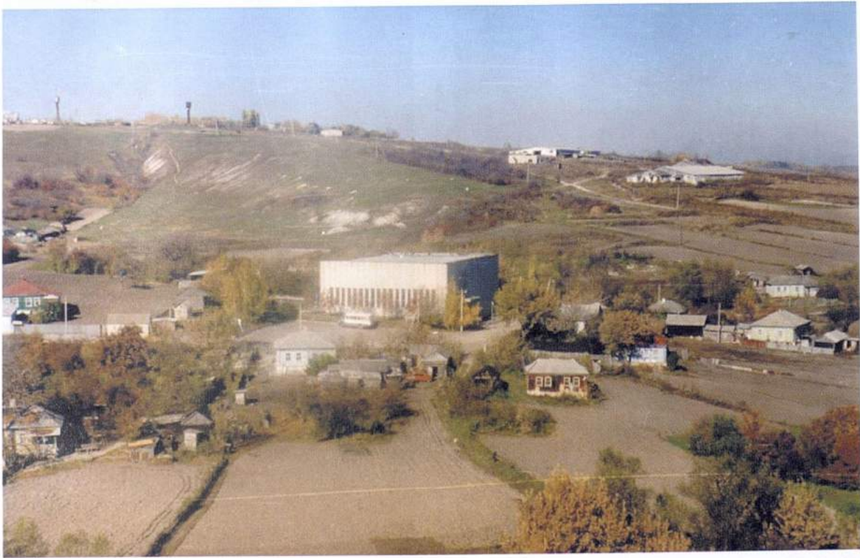
Рис. 30. Костенки. Здание музея