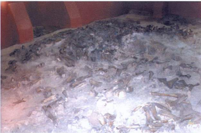
Рис. 32. Костенки. Музеефицированное палеолитическое жилище