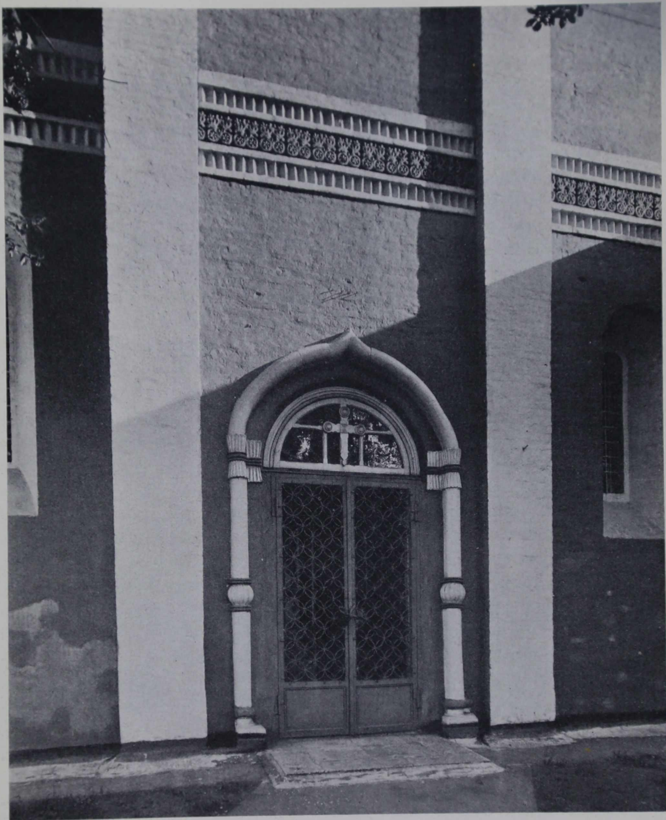
Северный порталъ церкви Рождества Богородицы въ Старомъ Симоновѣ подь Москвой.—1509 г.