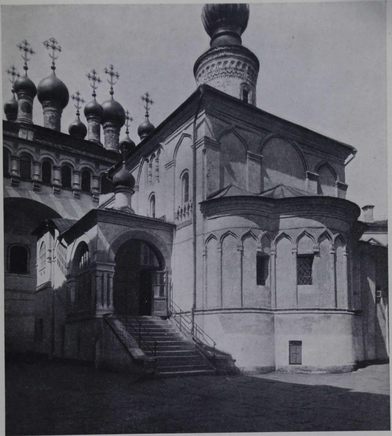
Церковь Ризъ Положенія Божіей Матери въ Московскомъ Кремлѣ. 1485 — 1486 г.