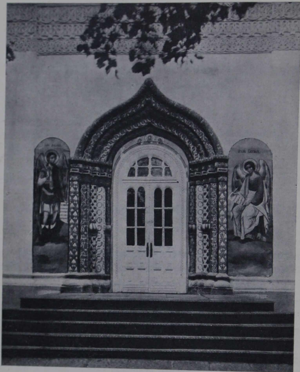
Сѣверный порталъ собора Рождества Богородицы въ Саввинѣ-Сторожевскомъ монастырѣ близъ Звенигорода. — 14-й вѣкъ.

Фигуры, личины, хитро украшенныя колонки уступили свое мѣсто менѣ изящнымъ, простымъ и часто ложно истолкованнымъ орнаментамъ, рядами поясовъ замѣщавшимъ прежнія богатыя архитектурныя формы. Правда, въ этихъ бѣдныхъ формахъ было нѣчто новое, что едва лишь намѣчалось во Владиміро-Суздальской архитектурѣ и въ чемъ сказывалось вліяніе Востока. Это новое въ корнѣ измѣняетъ взглядъ на архитектурныя декораціи внѣшности храма. Оно трактуеть былыя,