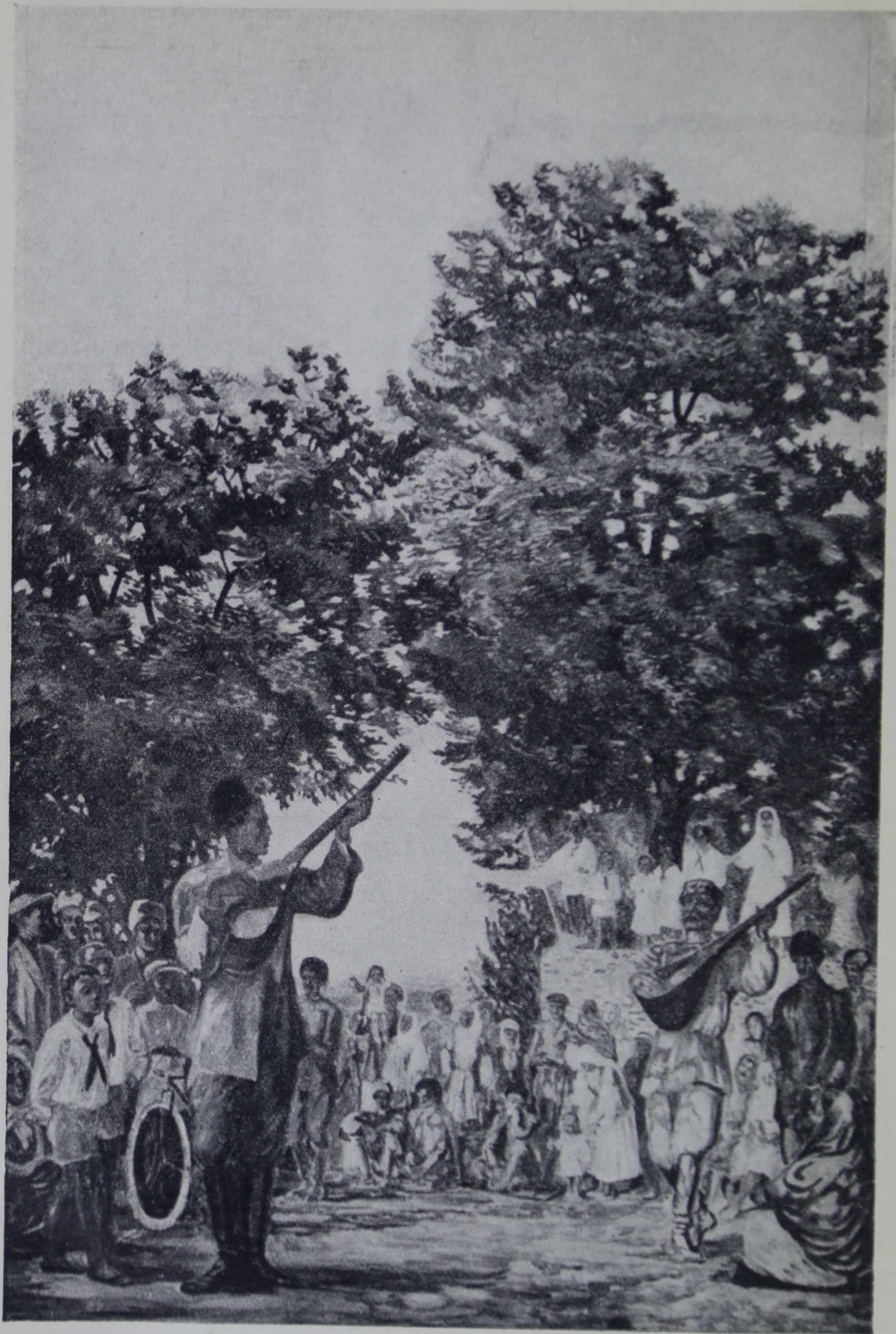
3. Фреска в Азербайджанском павильоне Всесоюзной сельскохозяйственной выставки 1939 г. «Колхозный праздник». Худ. проф. Бруни