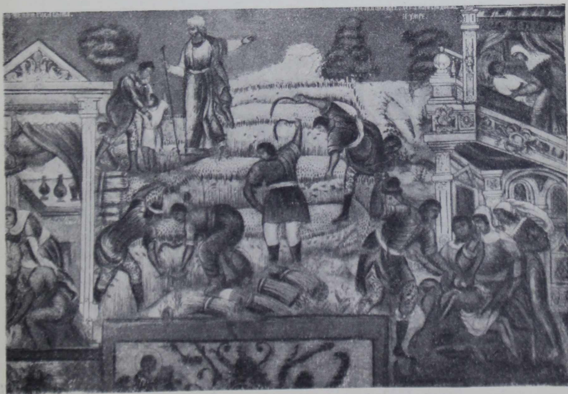
2. Фреска Ильинской церкви в Ярославле. «Жатва». XVII в.