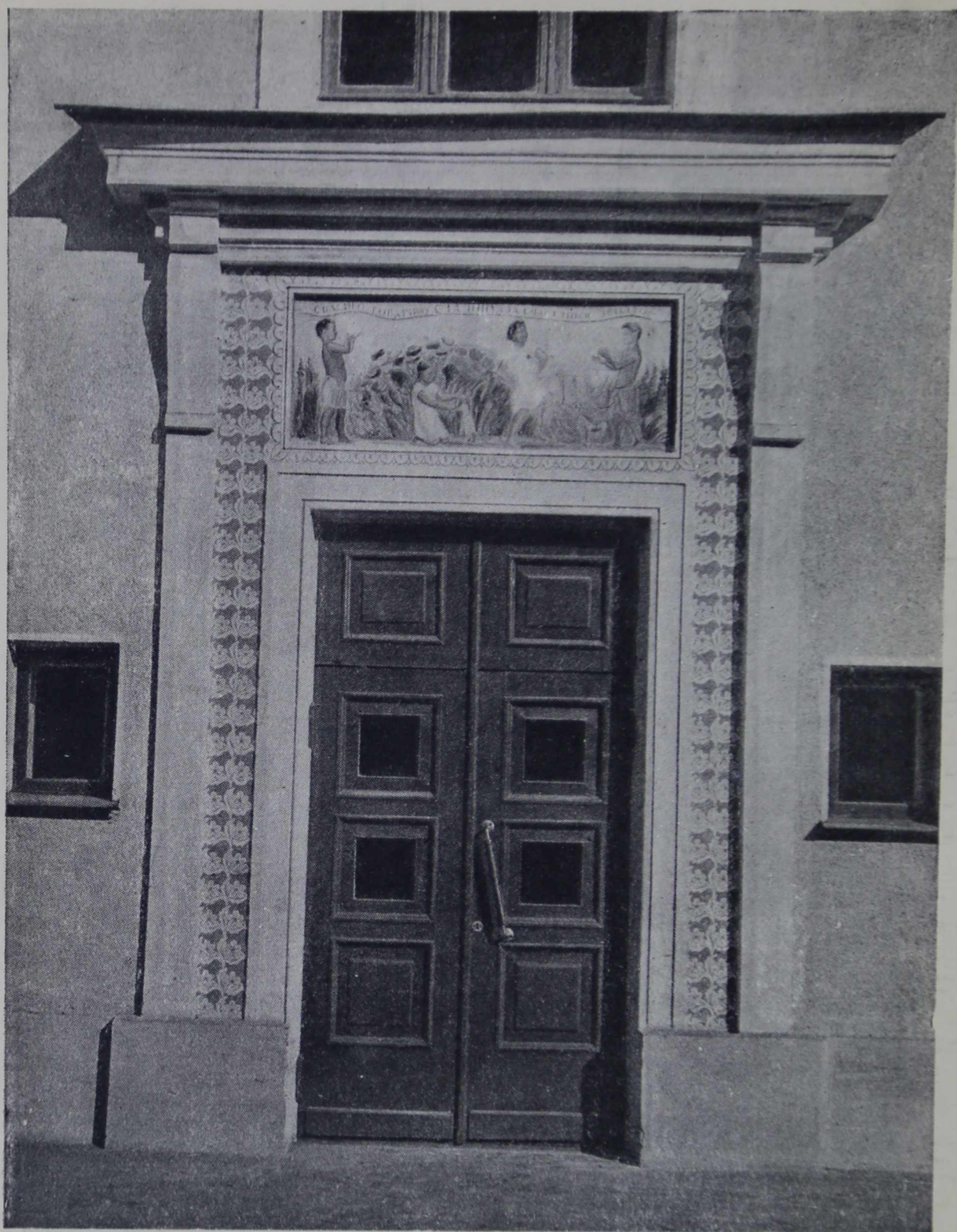
5. Фреска и сграффито в портале детского дома (Москва). 1939 г. Худ. Фаворский, арх. Чалдымов