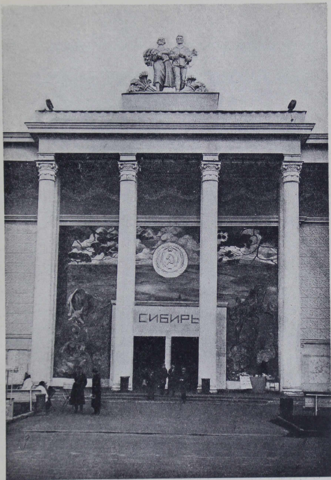
4. Фреска в портале павильона «Сибирь» Всесоюзной сельскохозяйственной выставки 1939 г. Худ. Курилко, арх. Ершов