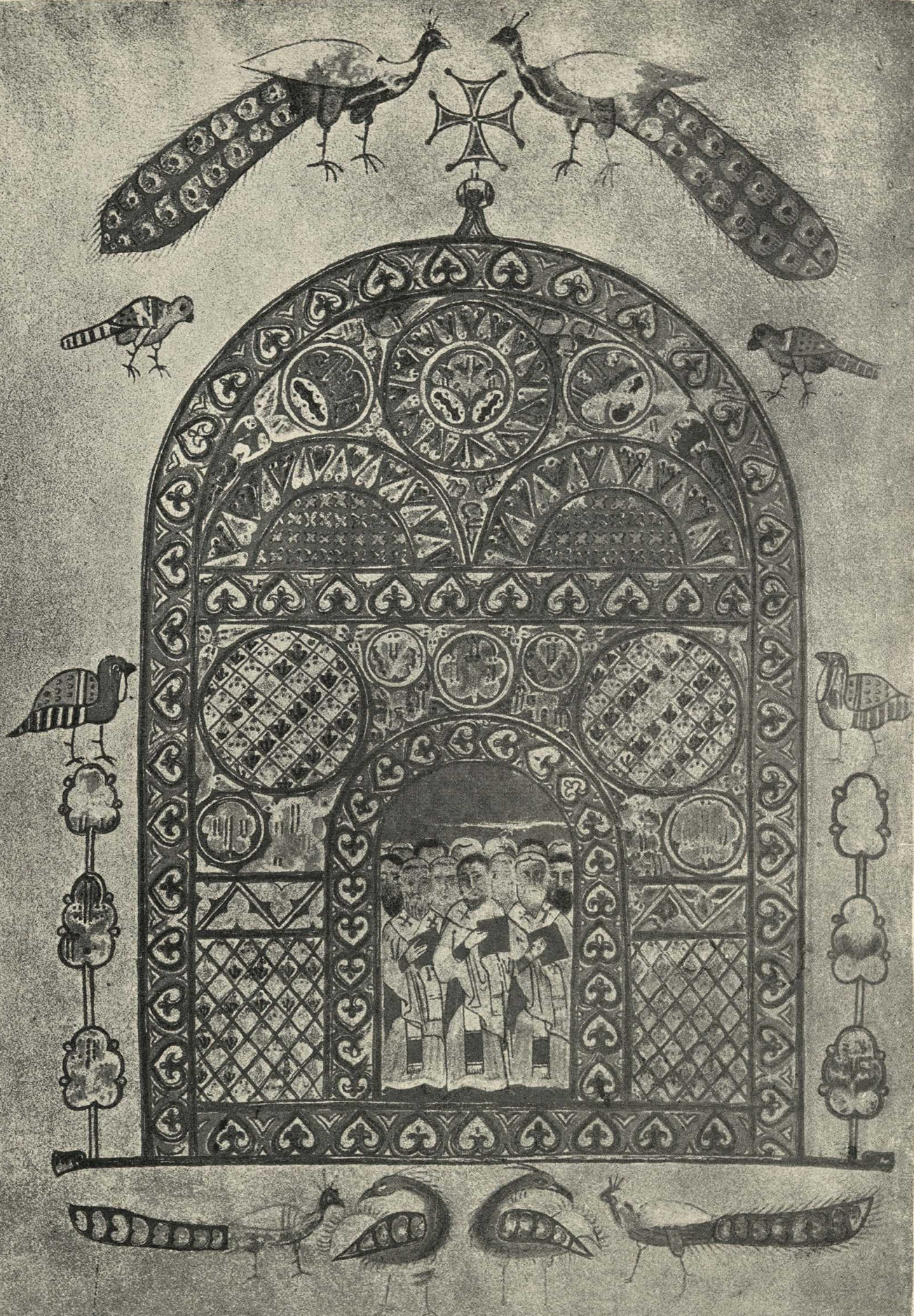
Таблица XXVII. Изборникъ Святослава.